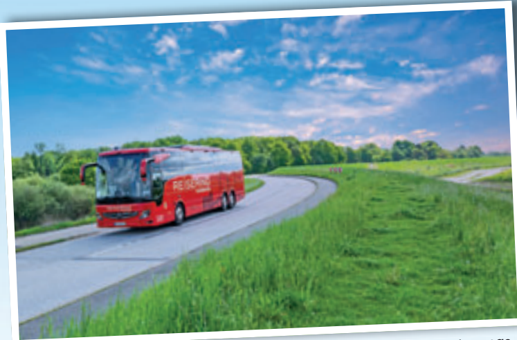
Mit dem knallroten Komfortbus in Deutschland und ganz Europa unterwegs.