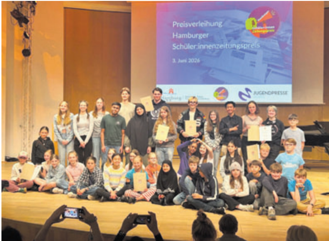
Die Sieger:innen des Hamburger Schüler:innenzeitungspreises wurden im Miralles-Saal der Jugendmusikschule gefeiert

Jeweils die drei erstplatzierten Hamburger Schülerzeitungen aus den Kategorien Grundschulen, Stadt-