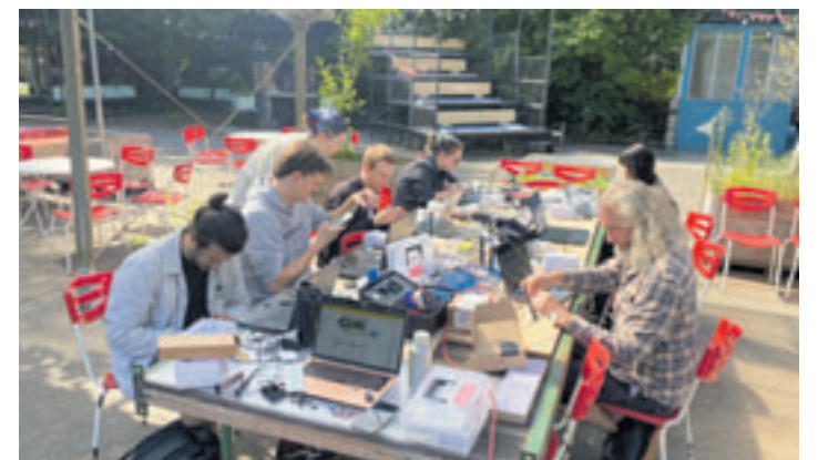
Informatik draußen bei jedem Wetter