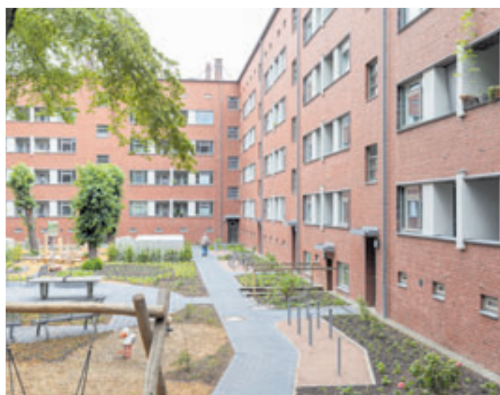
Nicht nur die Wohnungen selber, auch die Innenhöfe erstrahlen in neuem Glanz