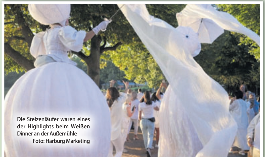
Die Stellenzläufer waren eines der Highlights beim Weißen Dinner an der Außenmühle