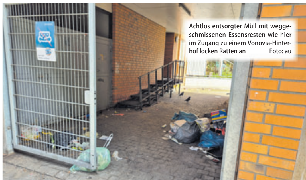
Achtlos entsorgter Müll mit weggeworfenen Essensresten wie hier im Zugang zu einem Vonovia-Hinterhof locken Ratten an

Ab 17 Uhr wird auf dem Gelände der Zinnwerke der Ofen im Rahmen des „Abendbrot“ angefeuert. „Wir werden gemeinsam Brot backen und essen – ihr seid herzlich eingeladen, dabei zu sein und gerne auch einen kleinen kulinarischen Beitrag zu leisten“, so die Veranstalter. Für Getränke wird gesorgt. Mehr Informationen gibt es hier: https://www.instagram.com/abendbrot.jetzt .