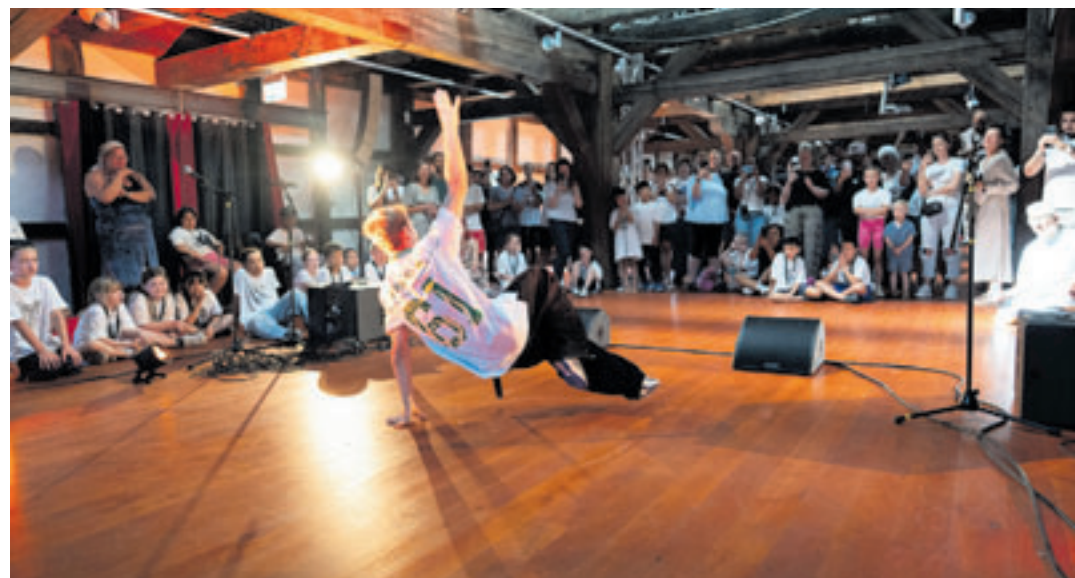
Cooler Moves erlernen, das geht in den Feriencamps der HipHop Academy

es der Tanz? Oder vielleicht eher Gesang? Aber toll ist auch das Lernen, wie man coole Graffitis erstellt. Ist die Entscheidung gefallen, können die Kinder drei Tage lang mit ihrem Lieblingstraining durchstarten, bevor es am letzten Tag eine große Show gibt. Hier wird das Erlernte auf die Bühne gebracht und vor Eltern und Freunden präsentiert.