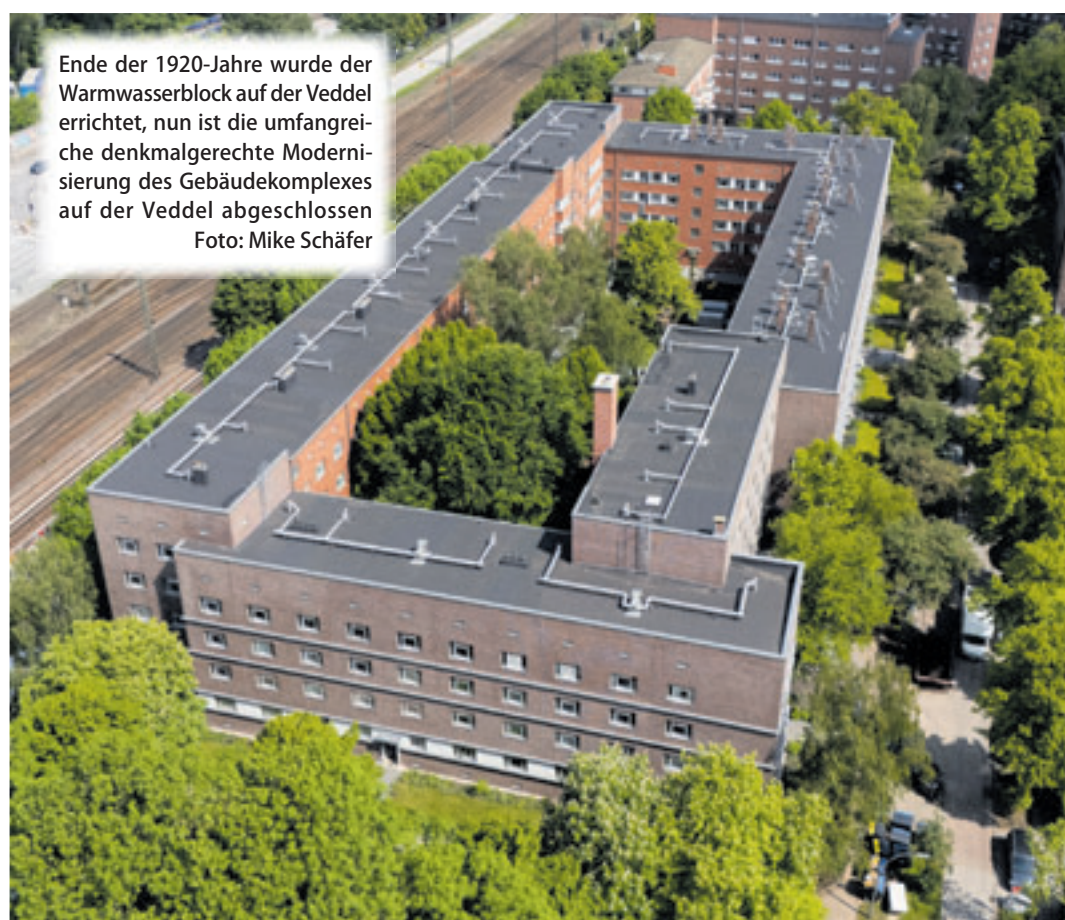
Ende der 1920er-Jahre wurde der Warmwasserblock auf der Veddel errichtet, nun ist die umfangreiche denkmalgerechte Modernisierung des Gebäudekomplexes auf der Veddel abgeschlossen

■ (au) Veddel. Nach rund vier Jahren Bauzeit hat die SAGA-Unternehmensgruppe die umfangreiche denkmalgerechte Modernisierung des sogenannten Warmwasserblocks abgeschlossen. Im Sommer 2015 hatte die SAGA den sogenannten Warmwasserblock in einem baulich schlechten Zustand übernommen. Eigentlich sollte der Ende der 1920er-Jahre nach städtebaulichen Entwürfen Fritz Schumachers entstandene Wohnblock abgerissen werden, doch Bewohner und die Lokalpolitik wehrten sich erfolgreich gegen diese Pläne. 2018 wurde die Wohnsiedlung unter Denkmalschutz