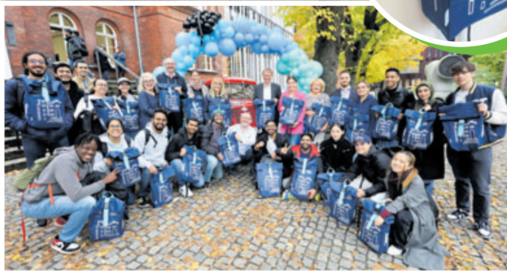
Jedes Jahr begrüßt Harburg rund 1.000 neue Studierende der Technischen Universität Hamburg, wie hier im Jahr 2023

Die Studierenden erhalten zum Studienstart eine prall gefüllte Tasche mit Goodies von Harburger Unternehmen