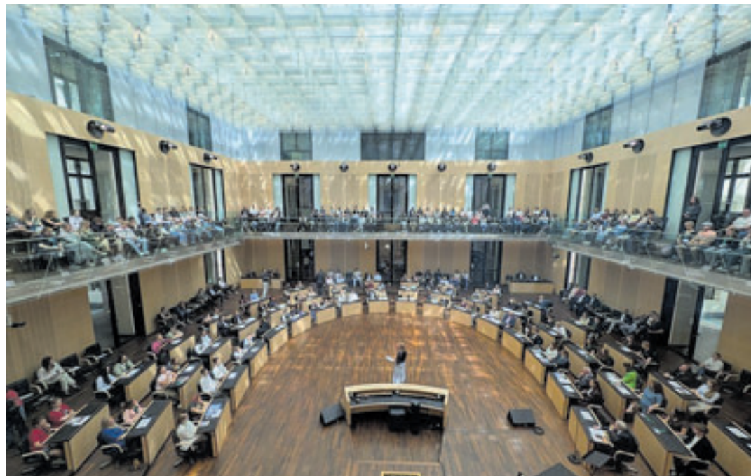
Einmal im Jahr sitzen keine Politiker im Bundesrat, sondern Schüler bei der Preisverleihung des Schülerzeitungswettbewerbs der Länder