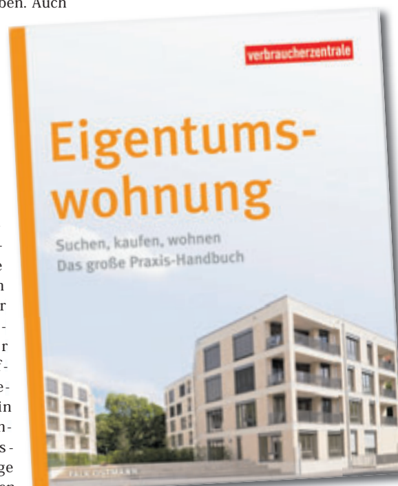
Der Ratgeber der Verbraucherzentrale hat viele Tipps zum Kauf einer Immobilie zusammengefasst

haben. Vorgestellt wird, was sich hinter dem Wirtschaftsplan oder einem Baulastenverzeichnis verbirgt. Das Buch erläutert typische