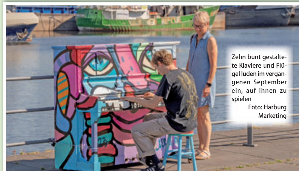
Zehn bunt gestaltete Klaviere und Flügel luden im vergangenen September ein, auf ihnen zu spielen