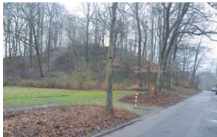
Die Freizeitanlage Am Burgberg bedarf einer gründlichen Instandsetzung

erst im Juni 2025. Mittlerweile wird die Fertigstellung erst für das Jahr 2026 angekündigt. Für die Öffentlichkeit bleibt weiterhin unklar, welche Maßnahmen bislang umgesetzt wurden, welche Kosten entstanden sind und aus welchen Gründen es trotz angekündigter Finanzierung zu erheblichen Verzögerungen gekommen ist. Vor diesem Hintergrund stellte die VOLT-Partei eine Anfrage an das Bezirksamt Harburg, um den Stand der Dinge zu erfahren.