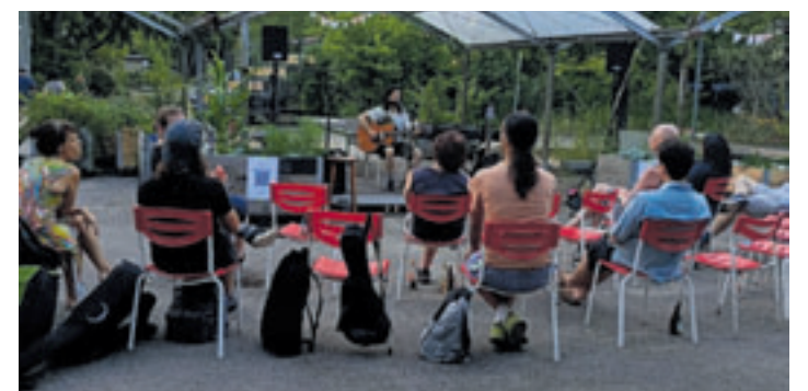
Seit fast zehn Jahren engagiert sich TAK Wilhelmsburg ehrenamtlich für Bühnenkunst, kulturelle Teilhabe, Begegnung und lokale Kunst- und Kulturszenen

zutragen. Seit fast zehn Jahren engagiert sich TAK Wilhelmsburg ehrenamtlich für Bühnenkunst, kulturelle Teilhabe, Begegnung und lokale Kunst- und Kulturszenen. Unter dem Motto „Kultur ist gelebte Vielfalt“ schafft TAK Räume, in denen Menschen aus dem Stadtteil zusammenkommen, kreative Ausdrucksformen sichtbar werden und Kultur niedrigschwellig erlebbar bleibt. Mit der Gründung der TAK Wilhelmsburg gUG stellt sich die Initiative für die kommenden Jahre verbindlicher auf. Ziel ist es, bestehende Formate weiterzuentwickeln, neue Projekte auf den Weg zu bringen und kulturelle Infrastruktur in Wilhelmsburg langfristig zu stärken. Die TAK Release Party ist ein persönlicher, gemeinschaftlicher Abend für alle, die TAK bereits begleiten oder kennenlernen möchten. Besucher sind eingeladen, vorbeizukommen, ins Gespräch zu kommen, den Unterstützer*innen-Film zu erleben und gemeinsam Kultur in Wilhelmsburg zu feiern. Der Eintritt ist frei.