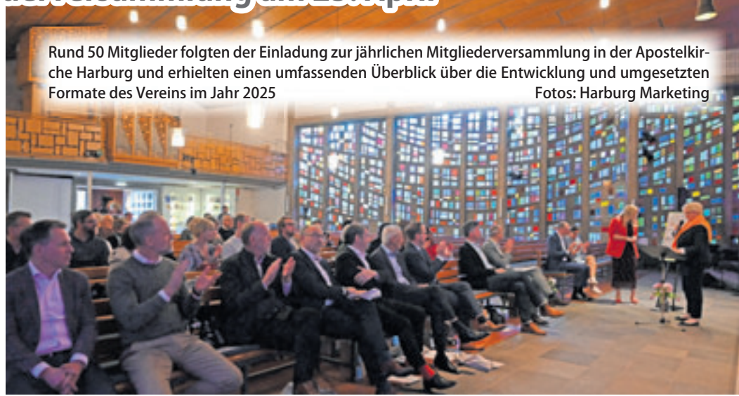
Rund 50 Mitglieder folgten der Einladung zur jährlichen Mitgliederversammlung in der Apostelkirche Harburg und erhielten einen umfassenden Überblick über die Entwicklung und umgesetzten Formate des Vereins im Jahr 2025

Ein zentraler Erfolgsfaktor war die Finanzierung: Durch die Kombination aus Mitgliedsbeiträgen und bezirklicher Förderung gelang es Harburg Marketing, zusätzliche projektgebundene Drittmittel in gleicher Höhe einzuwerben. Dadurch konnte das verfügbare Budget verdoppelt und gezielt in Projekte für