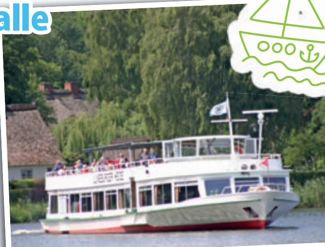
Mit der LÜNEBURGER HEIDE unterwegs.

am Zielort ein einstündiger Stopp für Landgang eingelegt. Fahrräder können auf Anmeldung hin mitgenommen werden. Kürzere Touren sind die regelmäßigen Nachmittagsfahrten zum Schiffshebewerk Scharnebeck mit zweimaliger Durchfahrung des 38 m hohen Bauwerks sowie Rundfahrten durch das wunderschöne Biosphärenreservat Elbtalau mit nahezu garantierter Sichtung von Seeadlern. An diversen Terminen gibt es auch Buffet-Fahrten in die Elbtalau mit Brunch- und Spargel-Bufferets. Hinzu kommen Fahrten zu besonderen Events im Hamburger Hafen sowie Fahrten mit unterschiedlichen Buffetts wie z.B. Brunch, Spargel, Matjes etc. ab/bis Hoopte mit ausführlicher Hafenrundfahrt in Hamburg. Eine Sitzplatzreservierung,