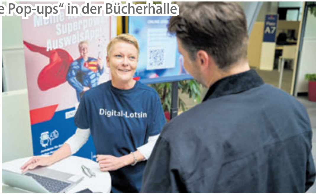
Die Digital-Lotsen helfen Bürgern dabei, den Online-Ausweis freizuschalten – einfach den Personalausweis und Smartphone mitbringen

Am Mittwoch, 15. Juli, sind diese Digitallotsen von 12 bis 18 Uhr in der Harburger Bücherhalle, Eddelbüttelstraße 47a. Hier können alle Hamburger kostenlos und ohne vor-