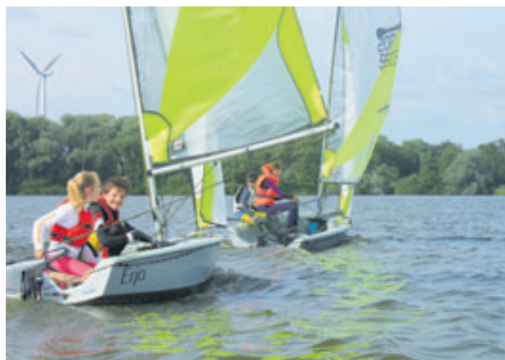
Wer das Segeln erlernen möchte, hat dazu in den Hamburger Sommerferien die Gelegenheit

beide Kurse sind noch Plätze frei. Vom 3. bis 6. August können 11- bis 15-Jährige in einer Jolle auf dem Neuländer Baggersee in Hamburgs Süden das Segeln ausprobieren und unter Anleitung erlernen. Der Kurs