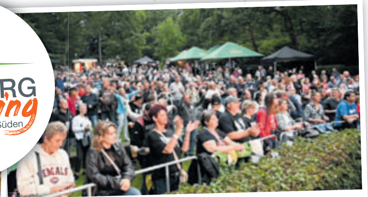
Der Charme der Freilichtbühne ist neben dem romantischen Ambiente auch die gute Sicht von jedem Platz