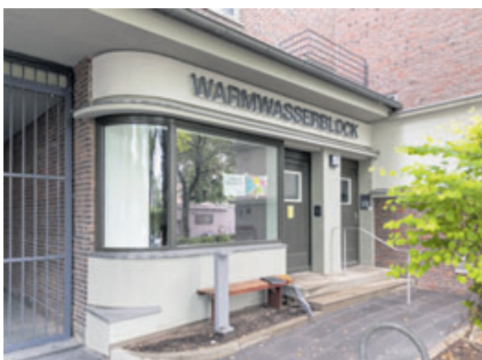
Beim Warmwasserblock handelte sich um das erste Gebäude auf der Veddel mit fließend warmem Wasser für die Bewohner

zu neuen Holzfenstern, die in der ursprünglichen Gestaltung und Farbgebung eingesetzt werden und zeitgemäßen energetischen sowie schallschutztechnischen Ansprüchen genügen“, so die SAGA in einer Pressemitteilung. Hinzu komme eine energetische Ertüchtigung durch Dämmung der obersten Geschossdecken, der Kellerdecken sowie einem Teil der Innenwände. Zu den weiteren Maßnahmen zählten unter anderem der Einbau eines neuen Blockheizkraftwerks, der Austausch aller