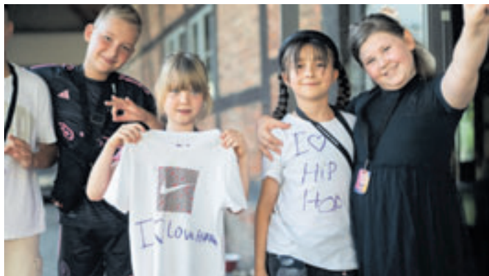
Der Kreativität freien Lauf lassen im Hip-Hop-Camp im Kultur Palast Harburg

■ (sl) Harburg. Kinder und Jugendliche, die in den Sommerferien Lust haben, etwas Neues auszuprobieren, sind willkommen bei den kostenlosen Hip-Hop-Camps im Kultur Palast Harburg. Von Montag, 27. bis Freitag, 31. Juli, dreht sich in der Rieckhoffstraße 12-14 alles um Hip-Hop-Tanz, Breaking, Rap, Graffiti und Gesang. Das YoungstersCamp richtet sich an Kinder von acht bis zwölf Jahren. Jeden Vormittag von 9 bis 13 Uhr wird trainiert. In den ersten beiden Tagen checken die Teilnehmenden alle Sparten der urbanen Kultur aus, wichtigste Frage: Was macht mir Spaß? Ist