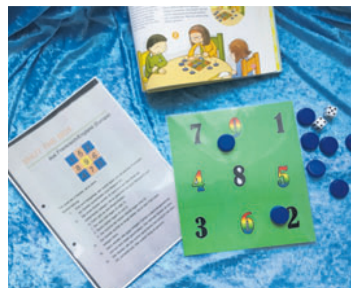
In der Bücherhalle Wilhelmsburg können sich die Kinder ihr eigenes „Shut the box“ basteln

die Teilnehmerzahl begrenzt ist, ist eine vorherige Anmeldung unter wilhelmsburg@buecherhallen.de oder direkt in der Bücherhalle Wilhelmsburg erforderlich. Das Ferienangebot ist Teil des Sommerferienprogramms der Bücherhallen Hamburg. Neben zahlreichen kreativen Veranstaltungen erwartet Kinder von 6 bis 12 Jahren ein Mitmachbuch, eine Lese-Challenge mit bunten Buttons zum Sammeln sowie jede Menge Bücher und Spiele für spannende Ferientage. Zudem können sich alle Kinder, die noch keine eigene Bücherhallen-Karte besitzen, bis zum 16. Juli 2026 kostenfrei für ein Jahr bei den Bücherhallen Hamburg anmelden. Alle Informationen zum Sommerferienprogramm der Bücherhallen gibt es unter www.buecherhallen.de/meldung/sommerferienprogramm.html.