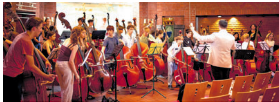
Die jungen Musiker zeigen am Sonntag, 21. Juni, in der St.-Petrus-Kirche in Heimfeld die Ergebnisse ihrer Workshop-Arbeit

Besonders wichtig ist den Veranstaltern die Vernetzung mit dem Stadtteil. Deshalb werden auch Harburger Schulkinder in das Projekt einbezogen. Der Workshop versteht sich