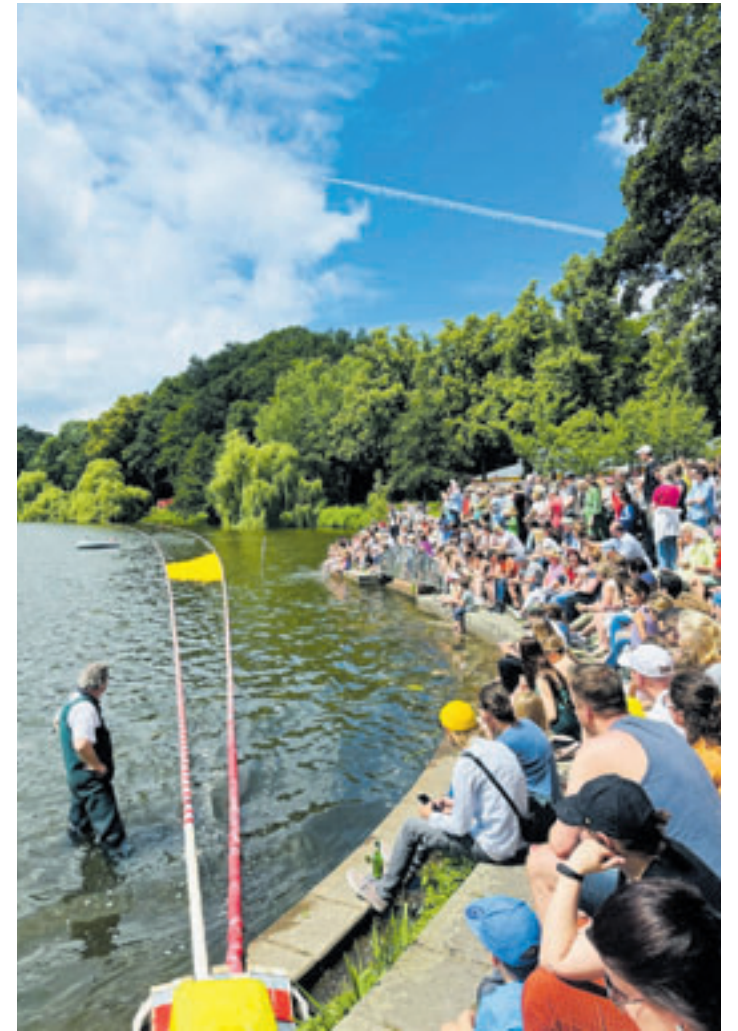
Die Entenrennen an und auf der Außenmühle sind seit 15 Jahren ein Garant für ein fröhliches Familienfest und eine große Spendensumme

Hamburg-Harburg versprechen ein fröhliches Fest und ein spektakuläres Rennen im Jubiläumsjahr der Außenmühle.