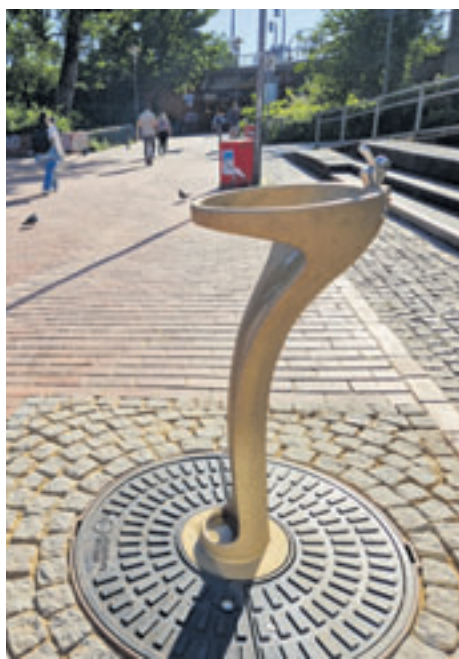
Einer von sechsen: Der Trinkwasserbrunnen von Hamburg Wasser am Seeveplatz wurde 2024 installiert

Richtig verärgert zeigt sich der Abgeordnete aus Süderelbe über die Begründung des rot-grünen Senats für den Stillstand bei der Trink-