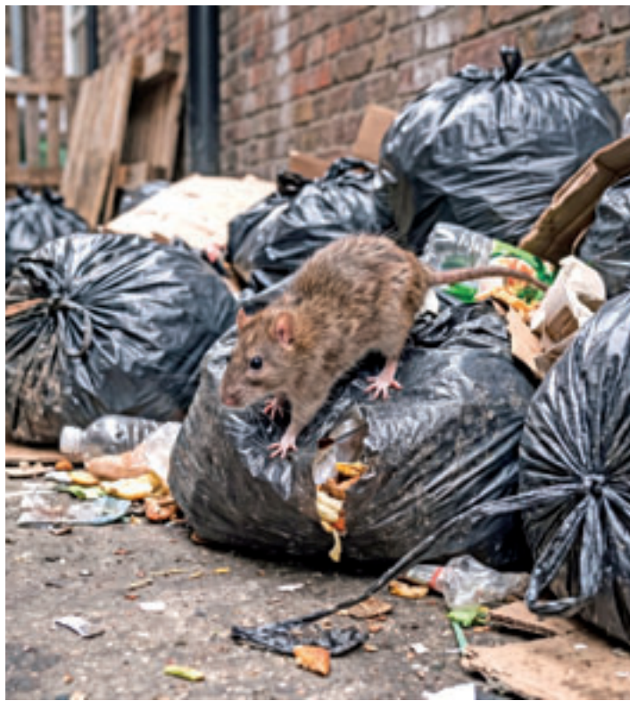
Ratten übertragen Krankheiten und müssen umgehen den zuständigen Behörden gemeldet werden. In Wilhelmsburg sind sie mittlerweile in einigen Bereichen zur Plage geworden