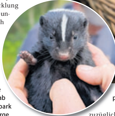
Kleine Luchsbabys verzaubern die Besucher des Wildparks

Acht kleine Stinktier-Babys halten die Eltern auf Trab