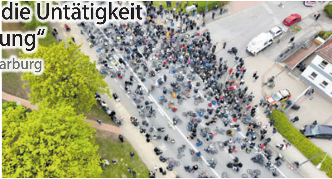
Hunderte Menschen beteiligten sich nach dem tödlichen Unfall Mitte April an der vom ADFC organisierten Mahnwache für den elfjährigen Jungen

hat sich für Fußgänger*innen und Radfahrer*innen dort bisher überhaupt nichts“, so Schmolz weiter. Um weitere Straßenverkehrsunfälle zu verhindern, fordert der Fahrradclub in einer Pressemitteilung den Bau von sicheren Radwegen in der Winsener Straße von der Hohen Straße/Hannoverschen Straße bis zur Rönneburger Straße. Schmolz: „Dort gibt es überhaupt keine Infrastruktur für den Radverkehr, während der Autoverkehr vier bis sechs Fahrstreifen hat“. Doch Bezirk und Senat zögen eine gerechte Verteilung des Straßenraums bislang noch nicht einmal in Erwägung, ist der ADFC der Ansicht. Als Sofortmaßnahme zur Erhöhung der Sicherheit von ungeschützten Verkehrsteilnehmern in Harburg müsse dringend Tempo 30 zwischen Trelter Weg und Freudenthalweg eingerichtet werden. „Dort queren täglich hunderte Schüler*innen mit dem Rad oder zu Fuß auf dem Weg zu den Bushaltestellen die Winse-