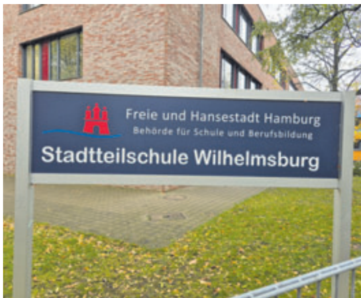
Die Stadtteilschule Wilhelmsburg fährt im September nach Berlin zum Finale um den Deutschen Schulpreis 2026

„Die Stadtteilschule Wilhelmsburg ist eine der bundesweit 4.000 Schulen, die durch das Startchancen-Programm für Schulen in herausfordernden Lagen gefördert wird. Etwa 86 Prozent der 1.228 Schülerinnen und Schüler haben einen Migrationshintergrund, viele leben in prekären Verhältnissen. Das Lernkonzept setzt vor allem auf Beziehungsarbeit. Im Schulalltag wechseln Input- und freie Arbeitsphasen, jede Phase wird mit einer gemeinsamen Reflexion im Kreis beendet. In der ersten Jahrgangsstufe formuliert die Klasse noch gemeinsame Ziele, ab der zweiten Klasse lernen die Kinder, sich eigene Ziele zu setzen und ihr Lernen zu reflektieren. Den Kern des Konzeptes bilden wöchentliche, etwa zehminütigen Coaching-Gespräche mit jedem Kind, die fest im Stundenplan verankert