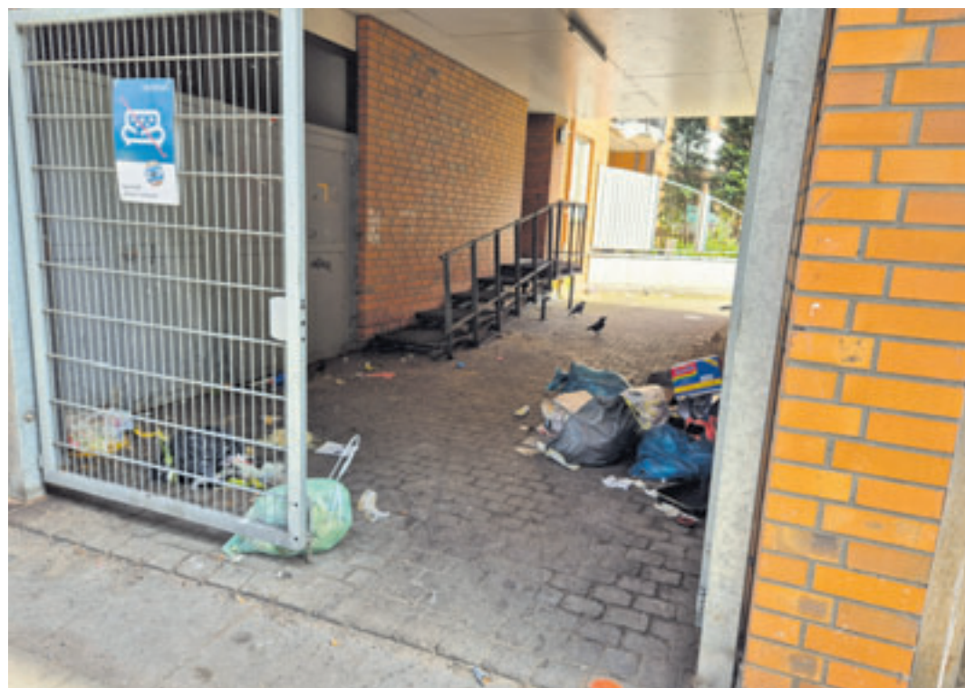
Achtlos entsorgter Müll mit weggeschmissenen Essensresten wie hier im Zugang zu einem Vonovia-Hinterhof locken haufenweise Ratten an

■ (au) Wilhelmsburg. Rémy, die Wanderratte aus dem Animationsfilm „Ratatouille“, ist nicht nur niedlich anzuschauen, sondern auch ein Gourmet sondergleichen. Er verfügt über einen sehr feinen Geruchs- und Geschmackssinn und avanciert im Laufe der Geschichte sogar zum meisterlichen Koch. Weniger wählerisch hinsichtlich der Nahrung und ihres Wohnumfelds sind Rémys reale Verwandten, die sich derzeit in großer Zahl auf Hinterhöfen im Alten Bahnhofsviertel tummeln, insbesondere zweier