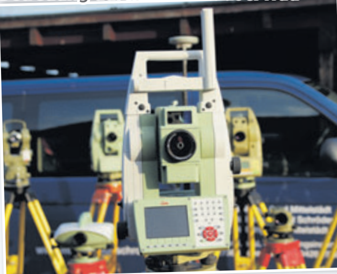
Mittelstädt & Trau setzen modernste technische Messsysteme ein

■ (mk) Scheeßel. Gegründet 1975, bietet das Vermessungsbüro Mittelstädt & Trau als öffentlich bestellte Vermessungsingenieure aus Scheeßel eine umfangreiche Betreuung für Bauherren. Darunter fallen amtliche Lagepläne und Bescheinigungen zum Bauantrag ebenso wie Gebäudeabsteckungen und amtliche Gebäudevermessungen.