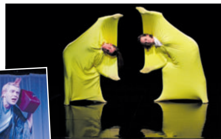
Am 3. Juli wird das Stück „Luca – eine Urzelle spielt verrückt“ im Rahmen des Ersten Harburger Kindertheaterfestivals gespielt

umsgespräch mit Hamburger Kinder- und Jugendtheatermachern und Vertretern aus Kulturpolitik und Wissenschaft. Das Thema ist der gesellschaftspolitische Aspekt der künstlerischen Arbeit im Theater für junges Publikum.