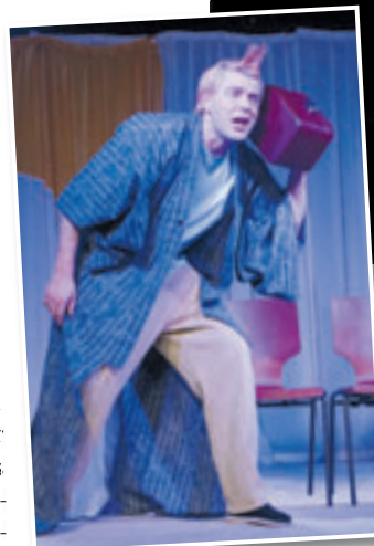
In dem Theaterstück „Prinz Eile“ landet der total gestresste Prinz in einem Land, in dem die Zeit stillzustehen scheint

Los geht es am Sonntag, 28. Juni, um 15 Uhr im Kultur Palast Harburg, Rieckhoffstraße 12, mit dem Stück „Prinz Eile“ für Kinder ab sechs Jahren vom Ensemble Theaterbox. Im Land der Langeweile scheint die Zeit stillzustehen. Als Prinz Eile aus seinem getakteten Alltag voller Stress, Termine und Beschäftigung hierher katapultiert wird, erlebt er extreme Langeweile – die in Kurzweil umschlägt, als er sich mit seiner Fantasie die Zeit zu vertreiben beginnt. Um 16.45 Uhr sind die Theatergäste und auch alle anderen kulturinteressierten Menschen eingeladen in den Kultur Palast zu einem Podi-