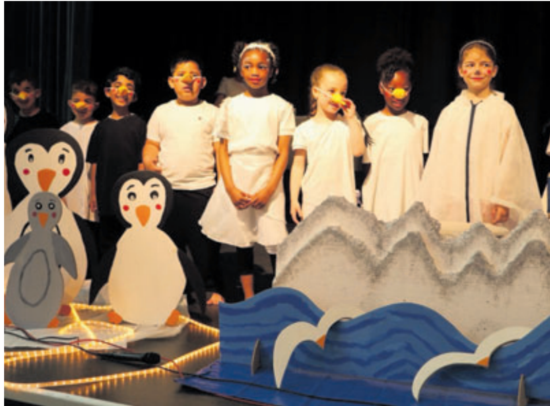
Die Vorschüler der Stadtteilschule Wilhelmsburg waren sichtlich stolz auf ihre schauspielerischen Leistungen