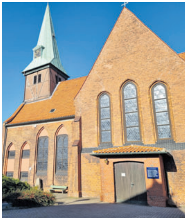
In der Kreuzkirche Kirchdorf können sich Besucher im Rahmen des Harburger Kirchenmusik-Sommers dem Können der Kirchdorfer Kantorei lauschen