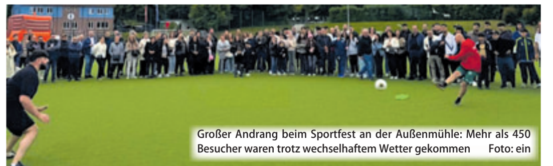
Großer Andrang beim Sportfest an der Außenmühle: Mehr als 450 Besucher waren trotz wechselhaftem Wetter gekommen

Stadtteil und das Quartier. Sie schaffen Begegnungen, fördern das Miteinander und bereichern das gesellschaftliche Leben vor Ort.“