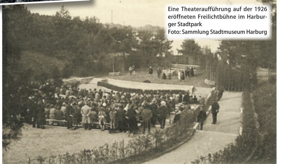
Eine Theateraufführung auf der 1926 eröffneten Freilichtbühne im Harburger Stadtpark

Das 100-jährige Jubiläum haben das Archäologische Museum und Stadtmuseum Harburg gemeinsam mit dem Autor Jürgen Ehlers zum Anlass genommen, ein neues Buch herauszubringen. Die reich bebil-