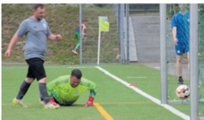
Drin oder nicht drin – das war beim Benefizturnier der HTB Heroes Anfang Juni auf der Jahnhöhe Nebensache