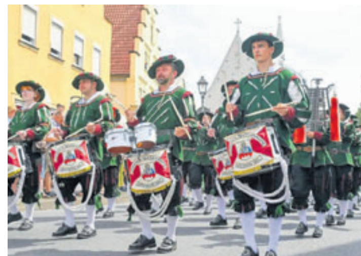
Der Spielmannszug aus Hofheim zählt zu den besten Deutschlands und trägt aktuell den Titel des Deutschen Vizemeisters

Um 16 Uhr beginnt dann der Ausmarsch, gegen 19 Uhr gibt es dann den Zapfenstreich vor dem Harburger Rathaus.