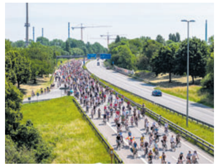
Am morgigen Sonntag werden wieder tausende Radfahrer zur Sternfahrt erwartet, auch aus dem Hamburger Süden

■ (au) Hamburger Süden. Mit der Fahrradsternfahrt in Hamburg am 21. Juni 2026 demonstrieren zehntausende Menschen aus Hamburg und dem Hamburger Umland für das Fahrrad als umweltfreundliches Verkehrsmittel und den consequenten Ausbau der Radinfrastruktur innerstädtisch und im Bereich der Metropolregion Hamburg. Von über 80 Startpunkten aus fahren Radfahrende aus Hamburg, Niedersachsen und Schleswig-Holstein zum Hamburger Jungfernstieg, um sich gemeinsam für sicheren Radverkehr einzusetzen. Ein Höhepunkt ist in diesem Jahr auch wieder die Strecke über die Köhlbrandbrücke, mit einem phänomenalen Blick über den Hafen und die Stadt. Die Abschlussveranstaltung am Jungfernstieg beginnt um 15 Uhr. Auch aus Neugraben, Harburg und Wilhelmsburg starten Radfahrer zur gemeinsamen Sternfahrt. Aktuelle Informationen zu den Routen und Abfahrtszeiten unter https://fahrradsternfahrt.hamburg/ .