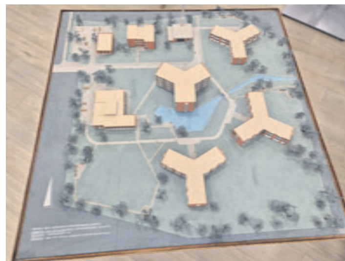
Ein altes Modell von ehemaligen Pflegeheim in der Hermann-Westphal-Straße. Heute steht keines der Gebäude mehr

GÜNSTIG ELEKTRO FAHREN! + 500,- € LADEKARTE + STAATL. E-AUTO-FÖRDERUNG 4