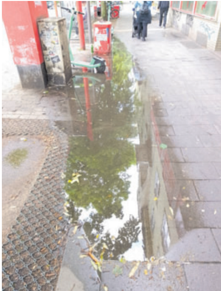
Wenn es länger oder stark regnet, bilden sich tiefe Pfützen an der Haltestelle Mannesallee in der Veringstraße. Außerdem gibt es zahlreiche Stolperfallen in dem Bereich

■ (au) Wilhelmsburg. Bei Temperaturen weit über 20 Grad und schönstem Sonnenschein denkt gerade eigentlich niemand an Regen und den Folgen, die daraus entstehen können. Da sind die Probleme trotzdem, spätestens beim nächsten Platzregen sogar ziemlich sichtbar. So wie an der Bushaltestelle in der Veringstraße auf Höhe der Hausnummer 45. Hier bilden sich bei stärkerem oder lang anhaltendem Regen große Wasserflächen, teils knöcheltief. Die CDU Wilhelmsburg sieht den Grund dafür schon länger zurückliegen, wie sie in einem Antrag schreiben, der gerade im Regionalausschuss Wilhelmsburg/Veddel auf der vergangenen Sitzung zur Abstimmung gestellt wurde. „Durch den Ausbau der Veloroute 11 in der nördlichen Veringstraße wurde im Jahre 2020 die Bushaltestelle Mannesallee in Fahrtrichtung Bahnhof Wilhelmsburg um einige Meter nach Süden verlegt. Anfänglich wohl nur als temporäre Verlegung angedacht, ist aus dieser Verlegung nunmehr ein Dauerzustand geworden. Im Zuge der Verlegung wurde die Bushaltestelle mit Wartehäuschen und Sitzgelegenheit versehen. Der Bordstein wurde entsprechend den Einsteigbedürfnissen angepasst. Nicht berücksichtigt wurde dabei, den Übergang der Bushaltestellenfläche zum originalen Fußweg baulich anzupassen. Hier haben sich im Laufe der Zeit zwischen den Hausnummern 45 und 47 Senkungen und Erhöhungen ausgebildet, die zu Stol-