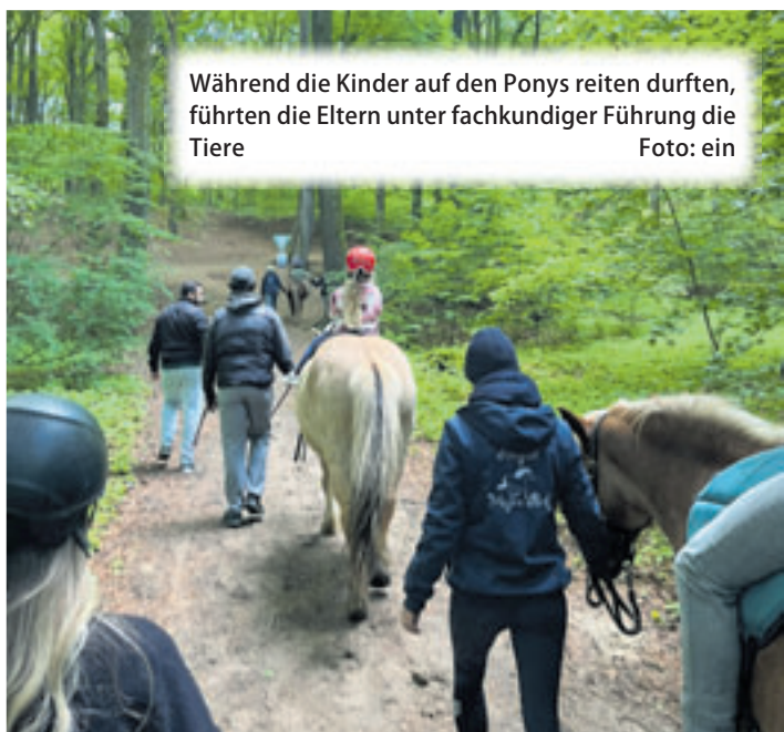
Während die Kinder auf den Ponys reiten durften, führten die Eltern unter fachkundiger Führung die Tiere