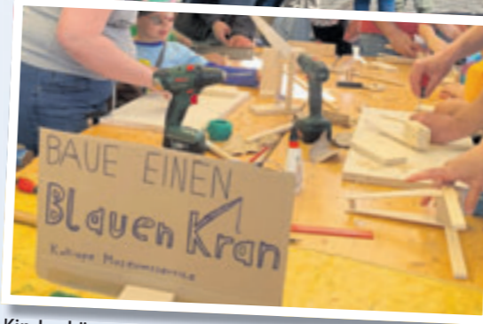
Kinder können bei der „Kalliope“ einen Ewer aus Holz basteln.

wieder ein kleines, aber extrem feines und vor allem familiäres Fest feiern. Und das Beste: Es ist umsonst und draußen“, erläutert Martina Siebert, Sprecherin der Organisationsteams. Gleichzeitig weist sie darauf hin, dass dieses Fest nicht darauf ausgelegt ist, die Taschen der Veranstalter zu füllen. Organisiert wird LEINEN LOS! 2026 von der Kulturwerkstatt Harburg e.V., dem Museums-hafen Harburg e.V., dem Harburger Turnerbund, der Gesichtswerkstatt Harburg e.V. Marias Ballroom