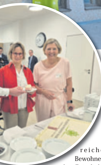
reiche Bewohner den Feierlichkeiten bei.

Wohnen (P&W) in der Hermann-Westphal-Straße. Neben zahlreichen Mitarbeitern von P&W, Vertretern der Sozialbehörde und weiteren geladenen Gästen wohnten auch zahl-