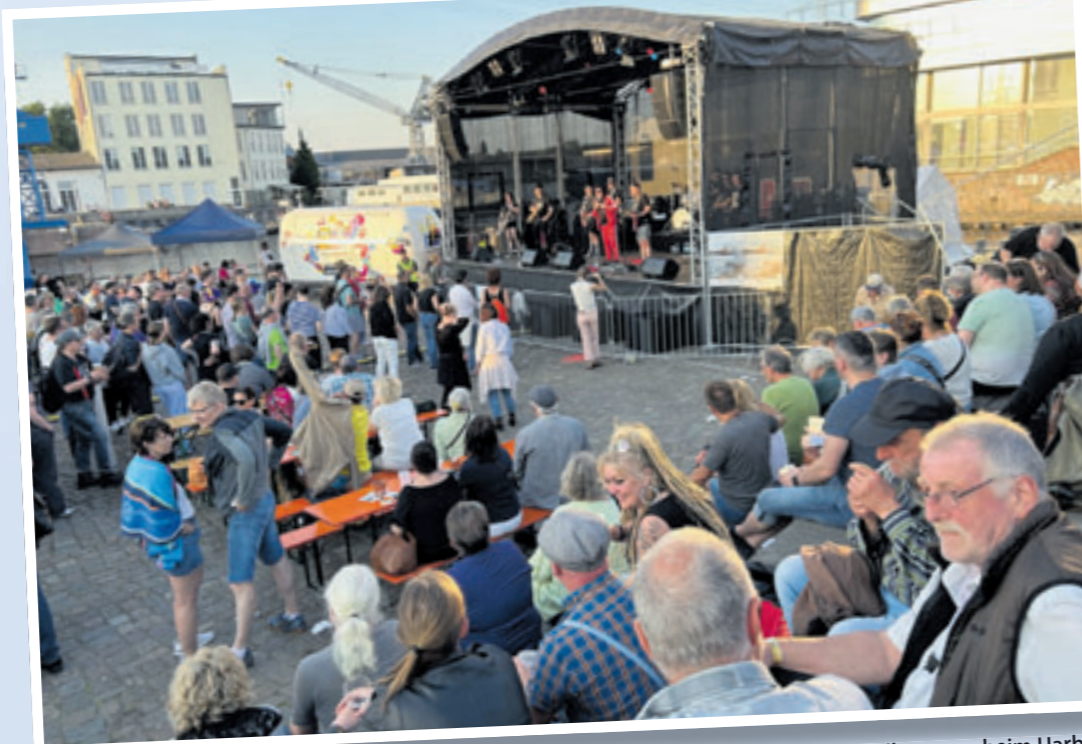
Gute Musik auf drei Bühnen, ein leckeres Getränk und entspannte Atmosphäre – das gibt es nur beim Harburger Binnenhafenfest.

und der Fischhalle Harburg. Mehr als 100 Helfer sind ehrenamtlich im Einsatz. Zahlreiche Schiffsführer stellen ihre Boote und Segelschiffe für Besichtigungen und Hafenerundfahrten zur Verfügung. Übrigens: Das Parkhaus am Veritaskai macht einen Sonderpreis für die Zeit des Festes, und sowohl am Samstag als auch am Sonntag gibt es einen bewachten Fahrradparkplatz bei Segel-Raap. Alle Informationen zu den einzelnen Schifften, wann welche Band spielt, und was noch so alles auf dem Binnenhafenfest zu entdecken ist, gibt es unter https://harburgerhafenfest.de/ .