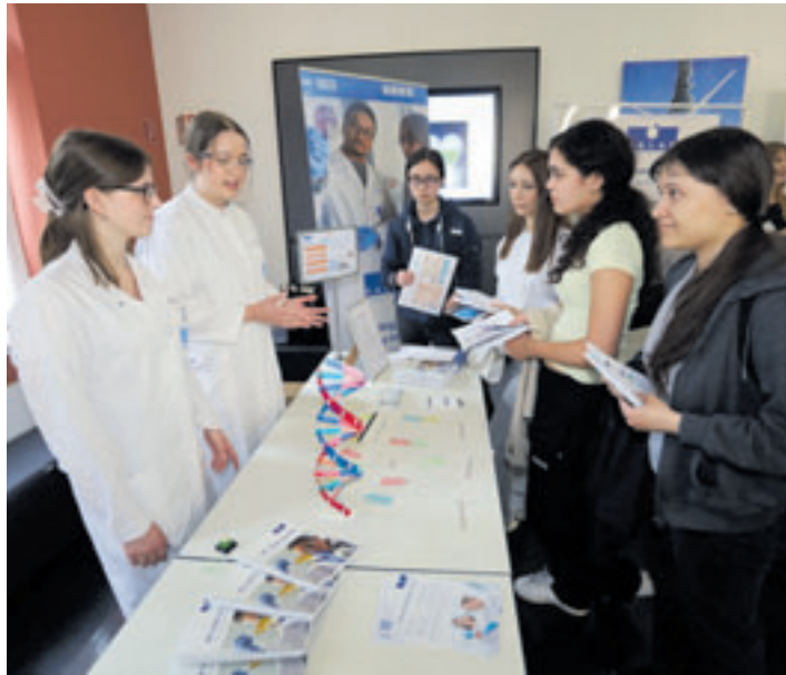
Am MINT Experience Day erleben Schüler und alle MINT-Interessierten Technik und Naturwissenschaft hautnah mit

■ (au) Heimfeld. Wie funktioniert virtuelles Schweißen? Was steckt alles in Tierfutter? Und wer sorgt dafür, dass Schiffe künftig nachhaltiger und effizienter fahren? – Wer Antworten auf diese Fragen möchte, ist genau richtig am Mittwoch, 3. Juni, von 10.30 bis 13 Uhr beim MINT Experience Day an der TUHH, Am Schwarzenberg-Campus 1. Am MINT Experience Day erleben Schüler und alle MINT-Interessierten Technik und Naturwissenschaft hautnah mit: bei Mitmach-Aktivitäten und Mini-MINT-Experimenten gibt es viel zu lernen und auszuprobieren. Schüler können sich über das breite Studien- und Ausbildungsangebot an der TU Hamburg und in den beteiligten Unternehmen informieren. Weitere Informationen auf www.nachwuchscampus.de unter „Aktuelles“.