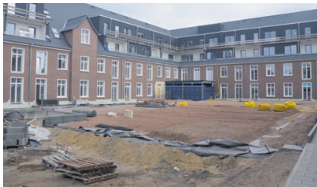
Im August 2026 soll der historische Altbau der Röttiger-Kaserne (Haus B) mit 96 Seniorenwohnungen bezugsfertig sein

A“ in Anspruch genommen werden können. 2. im Haus B ist darüber hinaus ein öffentliches Restaurant mit Veranstaltungsraum für Kleinkunst, Musik, Theater, Vorträge, Versammlungen und vieles mehr geplant: Das ehemalige Pförtnerhaus soll zum ein für alle zugängliches Café mit sonniger Außenterrasse zum Fischbeker Heidbrook werden – für generationenübergreifende nachbarschaftliche Begegnungen, erläutert Matthias Korff. Er weist darauf hin, dass in dem historischen Altbau 96 Seniorenwohnungen zur Verfügung stehen. Fischbeker Höfe Cuxhavener Straße 539, 21149 Hamburg Tel.: 040 181314-21 E-Mail: info@fischbeker-hoefe.de