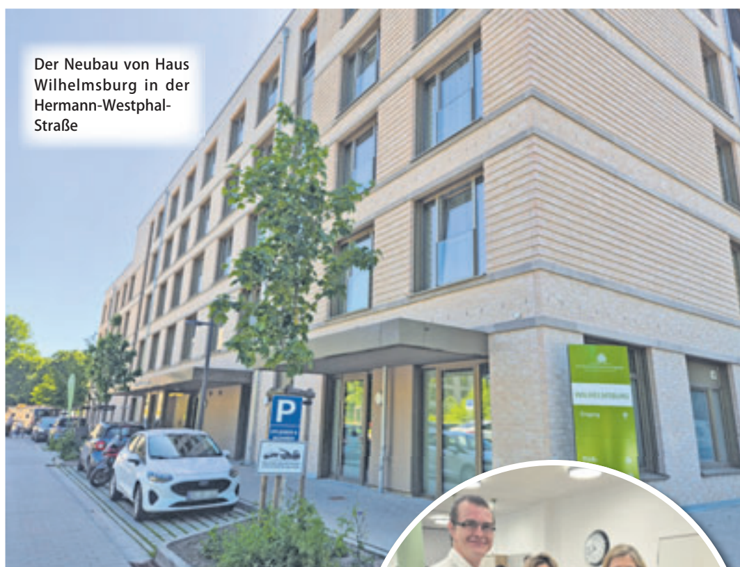
Der Neubau von Haus Wilhelmsburg in der Hermann-Westphal-Straße

309 stationäre Pflegeplätze zur Verfügung