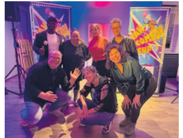
Beim TAK Comedy Cup werden dem Publikum vier verschiedene Comedy-Acts in der HASPA präsentiert

türme befindet sich das Café „Vju“ mit Aussichtsterrasse. Der Rundgang endet im Reiherstiegviertel. Der Rundgang hat die Kursnummer Q13120MMW98. Die Teilnahme kostet 18 Euro. Treffpunkt: S-Bahnhof Wilhelmsburg, Ausgang Neuenfelder Straße vor dem Fahrkartenselbstbedienungsautomaten. Anmeldung unter wilhelmsburg@vhs-hamburg.de.