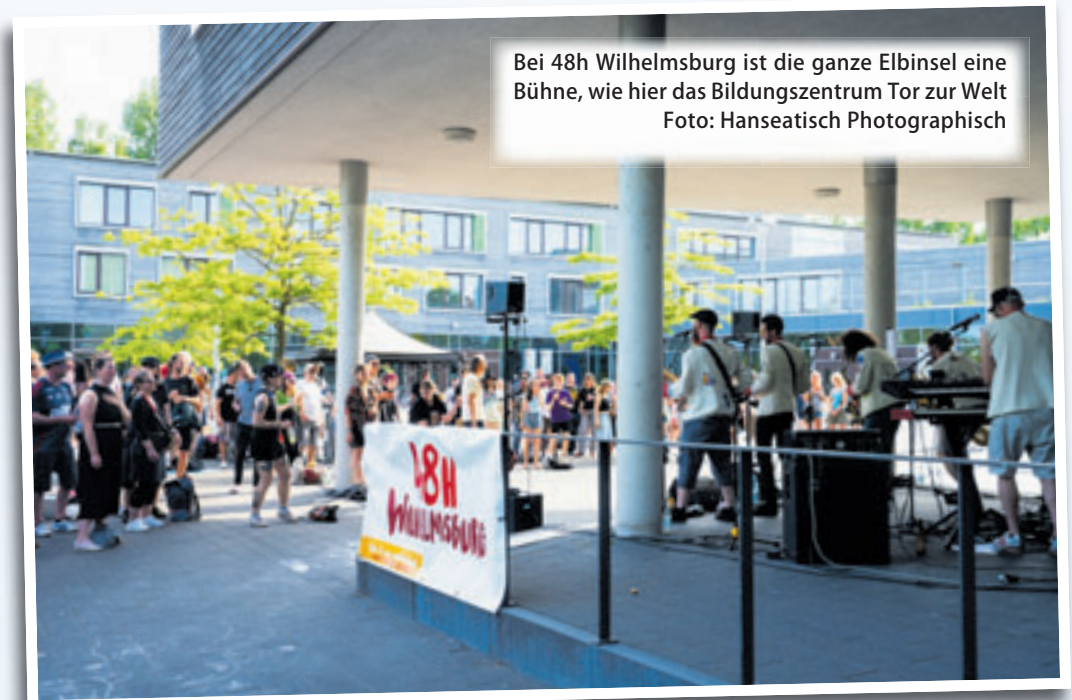
Bei 48h Wilhelmsburg ist die ganze Elbinsel eine Bühne, wie hier das Bildungszentrum Tor zur Welt

Empfohlene Genre-Routen führen auch in diesem Jahr durch das Festivalprogramm und erleichtern die Orientierung im vielfältigen An-