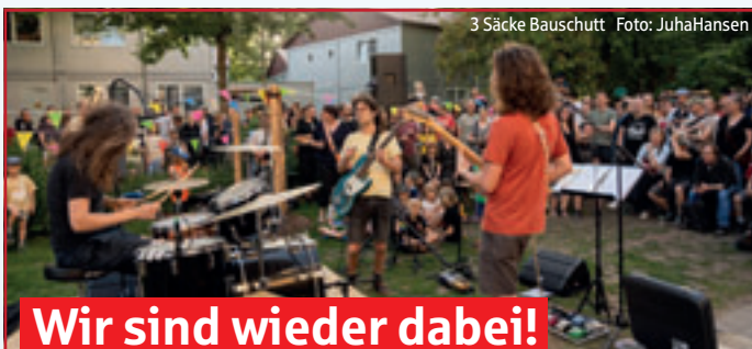
3 Sacke Bauschutt

Orten und der Unterstützung vieler Menschen aus dem Stadtteil. Besucher können das Festival unter anderem durch Spenden, Festivalbändchen sowie dem Kauf von Getränken und Speisen an den Veranstaltungsorten unterstützen. Das vollständige Programm gibt es ab jetzt online unter www.48h-mv.de .