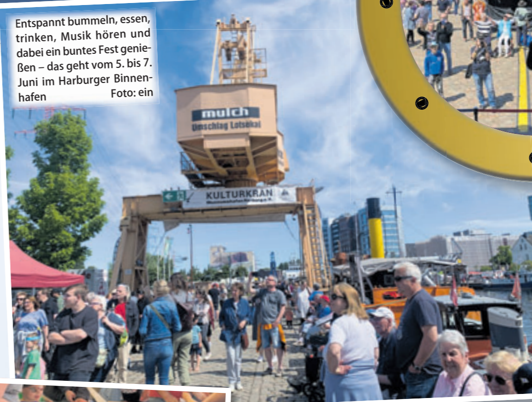
Mehr als 30 Bands wollen beim Binnenhafenfest auftreten.