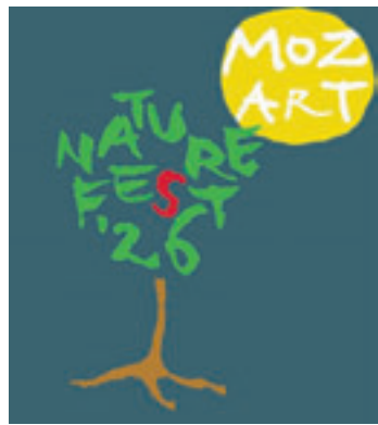
Die Mozartgesellschaft Hamburg und der NABU organisieren gemeinsam das Mozart Nature Fest 2026

sationsteam. Während die Mozart-Gesellschaft für die Musik sorgt, bietet der NABU