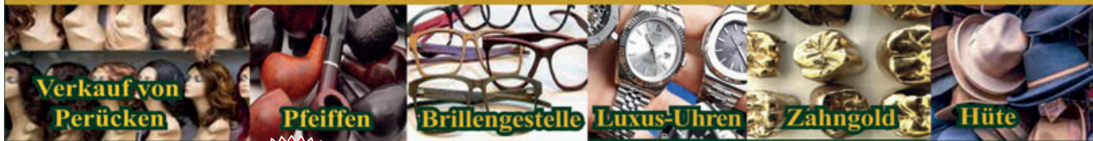
Verkauf von Perücken

Unverbindliche Beratung - Transparente Abwicklung!