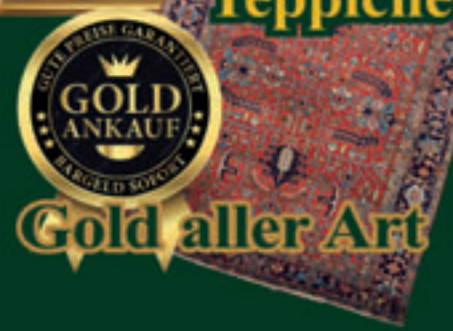
Gold aller Art