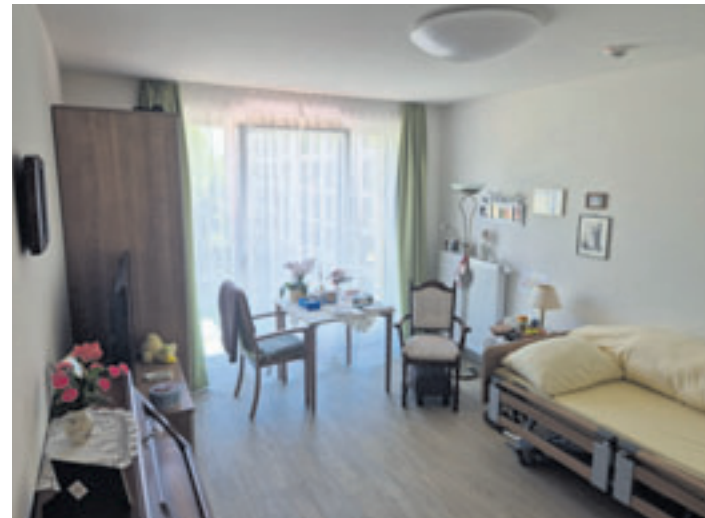
Doppelzimmer gibt es nicht mehr, dafür gemütliche Einzelzimmer mit eigenem, großem Badezimmer

Mit dem Umzug aus dem Altbau wurde die Zahl der Plätze leicht re-