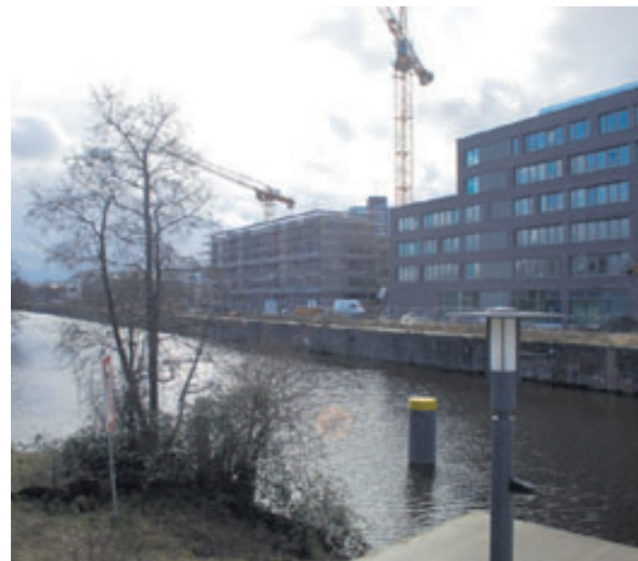
Die „Bucht“ des östlichen Bahnhofskanals soll nicht überbaut werden