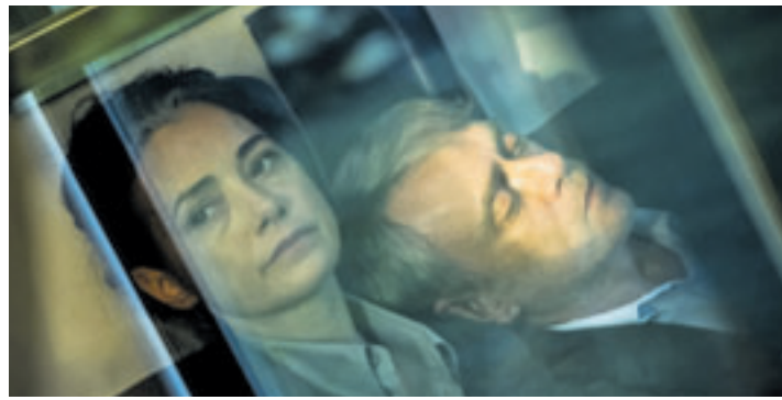
Mit dem Film „Gelbe Briefe“ zeigt das Kino im Planet Harburg den Gewinner der diesjährigen Berlinale