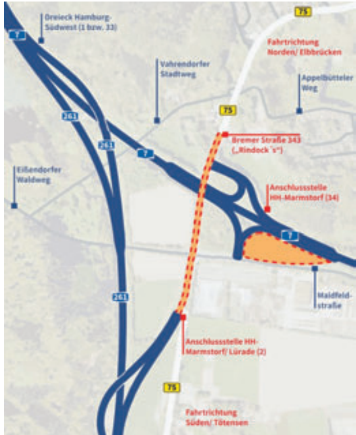
Im Rahmen der Grundinstandsetzung der Bremer Straße startet nun die Bauphase 3 Grafik: Autobahn GmbH des Bundes

Der Rad- und Fußverkehr in Ost-West-Richtung wird während der gesamten Bauzeit über den Vahrendorfer Stadtweg und die Bremer Straße umgeleitet. Der Vahrendorfer Stadtweg wird zu diesem Zweck provisorisch beleuchtet und die Oberflächen ertüchtigt. Eine Querung des Baufeldes am Knotenpunkt Bremer Straße/Maldfeldstraße/Eißendorfer Waldweg ist aus Sicherheitsgründen nicht möglich. Für die Zeiten der Vollsperrung der Bremer Straße in Richtung Tötensen entfallen auf der Linie 4200 die Haltestellen Tötensen, Ginsterhof, Metzendorfer Weg. In der Pietsch, Hagemannsweg, Hamburg, Lürader Weg und Lürade. Notwendige angepasste Linienvläufe und Fahrplanänderungen werden rechtzeitig durch die KVG GmbH & Co. KG ( www.kvg-bus.de ) bzw. die Hamburger Hochbahn AG ( www.hochbahn.de ) bekanntgegeben.