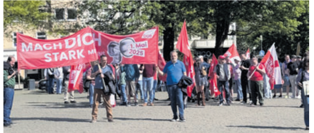
Der Stadtverband Harburg des Deutschen Gewerkschaftsbunds (DGB) ruft auch in diesem Jahr zu einer Demonstration und Kundgebung in Harburg auf

nicht an. Was hilft, sind Tarifverträge, die gut bezahlte Arbeit und gute Arbeitsbedingungen sichern. Deshalb fordern wir Gewerkschaften eine Ausweitung der Tarifbindung und kämpfen für den Erhalt des Sozialstaats. Nur so können wir gemeinsam den Turbokapitalismus ausbremsen.“