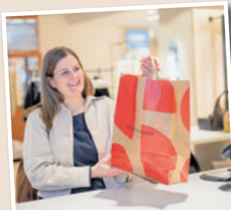
Mit märchenhaften Erlebnissen, frischen Frühlingsaktionen und genussvollen Momenten verspricht der verkaufsoffene Sonntag bei Stackmann wieder ein besonderes Einkaufserlebnis für die ganze Familie

alles um Märchen: Eine große Märchenlandschaft zum Ausmalen sowie ein liebevoll gestaltetes Märchen-Suchspiel sorgen für kreative Unterhaltung und spannende Entdeckungen. Neben den märchenhaften Aktionen gibt es im gesamten Haus viel zu erleben. In der Wäschewelt profitieren Kundinnen von attraktiven Aktionen und Angeboten. Die Kochwelt präsentiert praktische und schöne Küchenhelfer der Marken AdHoc und Zyliss und lädt zum Ausprobieren ein.