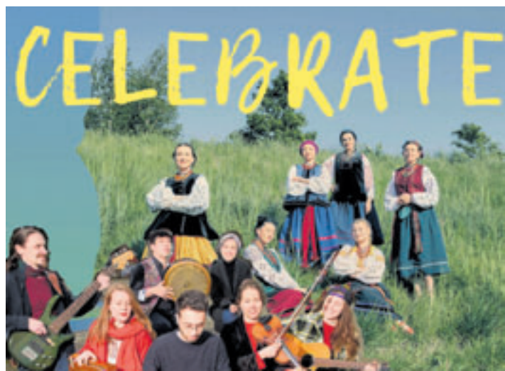
Die Ensembles WelCombo und Rodovid präsentieren ihre jeweils eigenen Arrangements und neue Stücke, die sie gemeinsam arrangieren – eine Symbiose aus beiden Bands

■ (au) Wilhelmsburg. Am Samstag, 2. Mai, findet in der Honigfabrik Wilhelmsburg, Industriestraße 125-131, ab 20 Uhr das Konzert „Celebrate – Um Heimat in der Ferne zu finden“ statt. „Feiern ist mehr als nur ein gesellschaftliches Ereignis. Es ist ein Moment, in dem wir die Verbindung zu unseren Traditionen und Mitmenschen stärken – auch wenn wir geografisch weit entfernt sind. Feiern bedeutet aber nicht nur das Erinnern, sondern auch das Neudefinieren. Es ist ein Prozess des Zusammenbringens – von alten Werten und neuen Perspektiven, von Vergangenheit und Gegenwart“, so die Organisatoren. Genau diesem Zusammenbringen widmet sich das Projekt CELEBRATE, einer Kollaboration der Hamburger Musikensembles WelCombo und Rodovid, die sich mit traditionellen Musikstilen aus den Herkunftsländern ihrer Mitglieder auseinandersetzen und diese in die Gegenwart transportieren. WelCombo und Rodovid spielen traditionelle Lieder aus der Ukraine, Syrien, Lettland, Irland, Iran und der Welt.