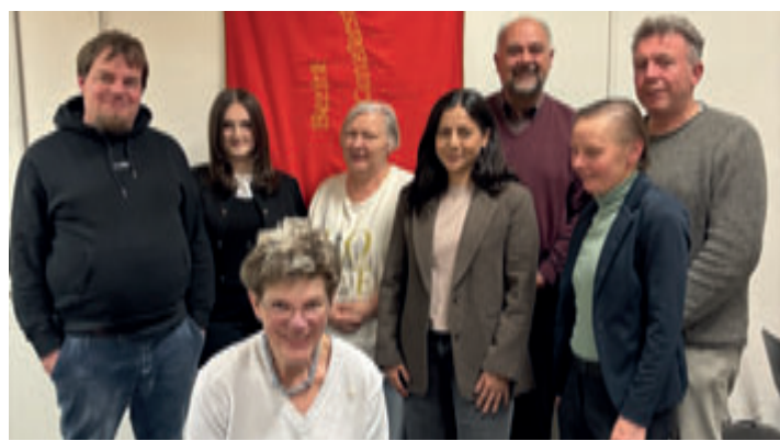
Der neu gewählte Vorstand im SPD-Distrikt Harburg-Ost

„Wir danken für das Vertrauen und gehen mit viel Motivation in die kommende Zeit“, so der neu gewählte Vorstand. Im Mittelpunkt der Arbeit sollen insbesondere die Herausforderungen im Alltag der Menschen stehen. Dazu zählen unter anderem die Verkehrssituation auf der Winsener Straße, die für alle Verkehrsteilnehmenden, ob zu Fuß, mit dem Rad, dem Auto oder dem Bus, sicherer und gerechter gestaltet werden soll. Darüber hinaus will sich der Vorstand für eine starke Infrastruktur, Sicherheit und Sauberkeit, bezahlbaren Wohnraum, verbesserte Freizeitangebote für Jung und Alt und ein lebenswertes Miteinander einsetzen.