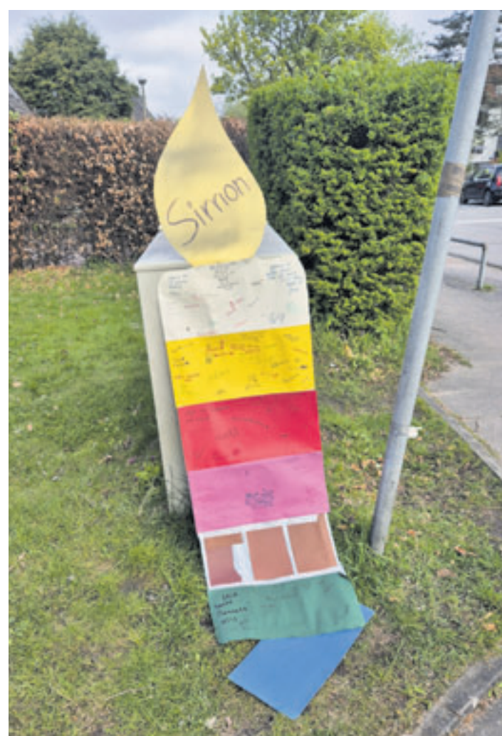
Freunde und Mitschüler haben ihre Gedanken und Wünsche für den getöteten Simon aufgeschrieben