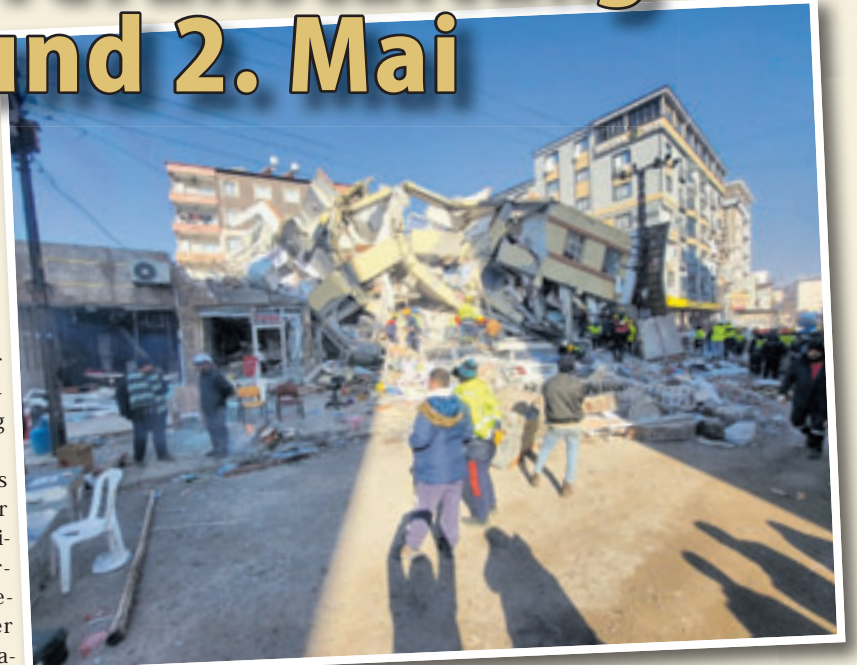
Rettungshunde werden überall auf der Welt eingesetzt, wie hier zum Beispiel beim Erdbeben in der Türkei 2023