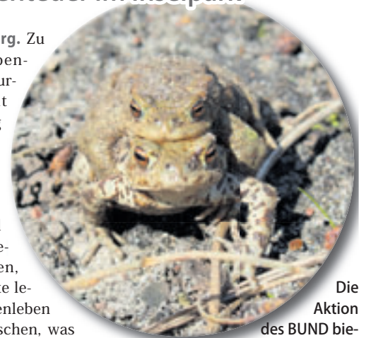
Die Aktion des BUND bietet spannende Einblicke in die Entwicklung der Amphibien

■ (au) Wilhelmsburg. Zu einem Familienabenteuer im Wilhelmsburger Inselfpark lädt der BUND Hamburg am Sonntag, 3. Mai, von 11 bis 13 Uhr in den BUND-Naturerlebnispark gegenüber Hauland 83. „Wir wollen gemeinsam entdecken, wo Frosch und Kröte leben, wie ihr Familienleben aussieht und erforschen, was sie für eine unglaublich spannende Verwandlung durchmachen“, so der BUND.