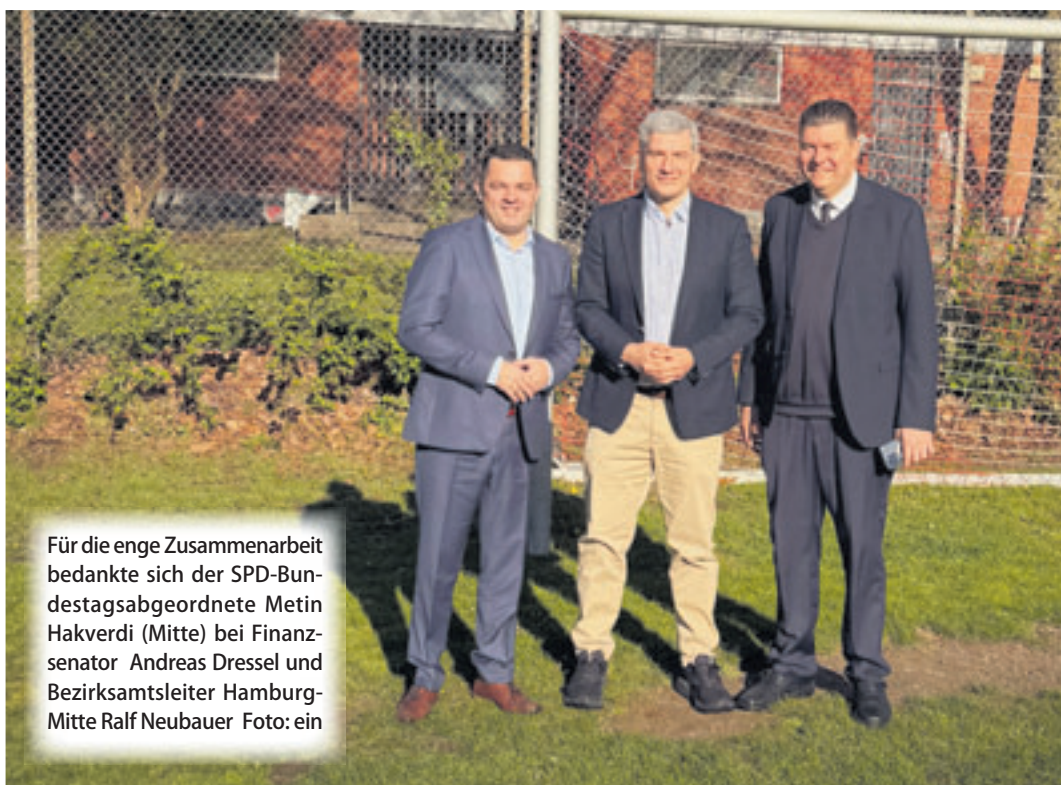
Für die enge Zusammenarbeit bedankte sich der SPD-Bundestagsabgeordnete Metin Hakverdi (Mitte) bei Finanzsenator Andreas Dressel und Bezirksamtsleiter Hamburg-Mitte Ralf Neubauer

■ (au) Wilhelmsburg. Endlich auch mal gute Nachrichten aus Berlin! Wie der SPD-Bundestagsabgeordnete für Wilhelmsburg, Metin Hakverdi, vergangenen Donnerstag mitteilte, gibt es eine beträchtliche Finanzierungsspritze für die Sanierung des Sportfunktionsgebäude der Sportanlage Fährstraße, denn: Der Haushaltsausschuss des Bundestages hat die erste Fördertranche des Programms „Sanierung kommunaler Sportstätten“ freigegeben – mit dabei: 630.000 Euro für die Sanierung beträgt 1,4 Millionen Euro – 630.000 Euro da-