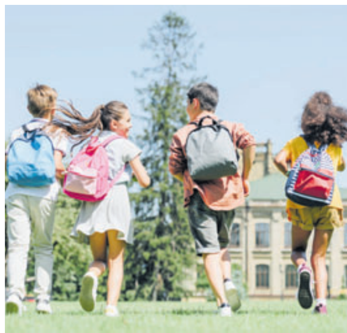
Mehr als 17.000 Fünftklässler starten nach den Sommerferien auf einem Gymnasium oder einer Stadtteilschule

Die Lessing-Stadtteilschule folgt mit 162 Schülern, und direkt dahinter mit 161 Schülern kommt die Stadtteilschule Fischbek-Falkenberg. Für die Elisabeth-Lange-Schule haben sich immerhin noch 138 Kinder entschieden. Bei den Gymnasien hat das Helmut-Schmidt-Gymnasium in Wilhelmsburg mit 168 Schülern die Nase vorn im Süderelbe-Raum. Am Gymnasium Süderelbe sind es 167, am Friedrich-Ebert-Gymnasium 162, am Heisenberg-Gymnasium 140 und am Alexander-von-Humboldt-Gymnasium 100. Die Schlusslichter im Süden bilden das Gymnasium Neugraben mit 100 und das Gymnasium Finkenwerder mit 84 neuen Schülern.