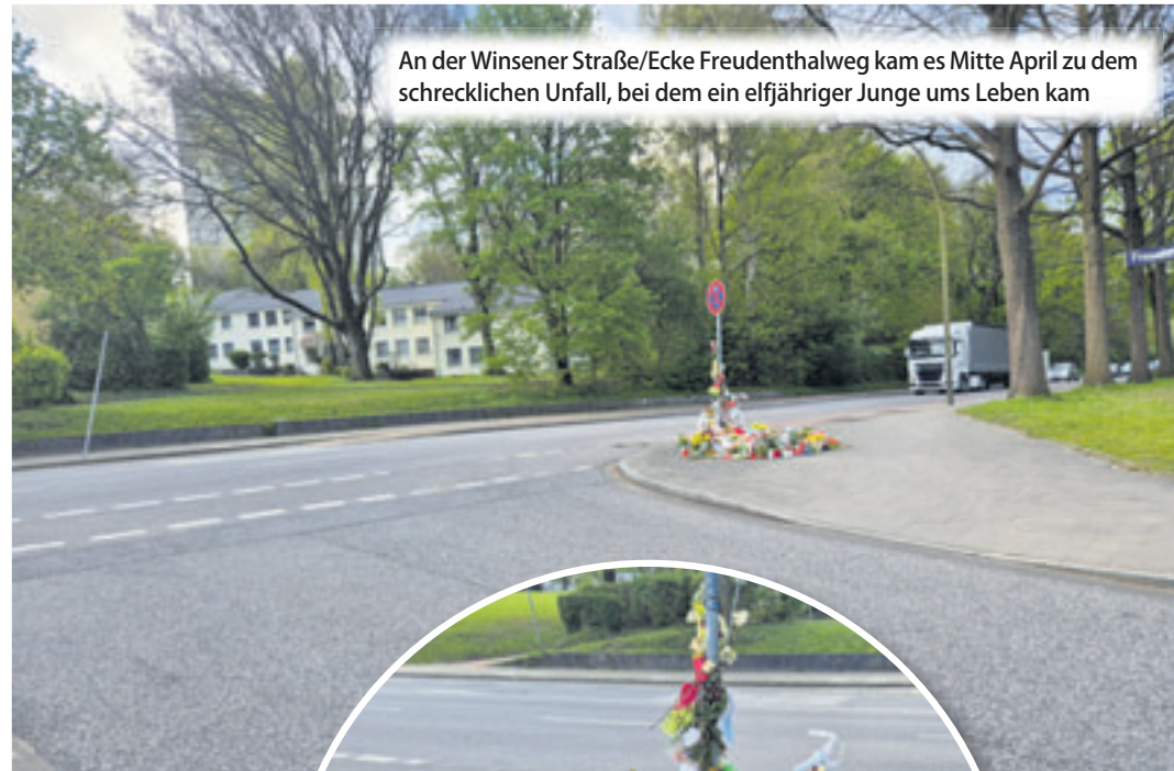
An der Winsener Straße/Ecke Freudenthalweg kam es Mitte April zu dem schrecklichen Unfall, bei dem ein elfjähriger Junge ums Leben kam

■ (au) Wilstorf. Dieser schwere Verkehrsunfall hat weit über die Grenzen Hamburgs hinaus