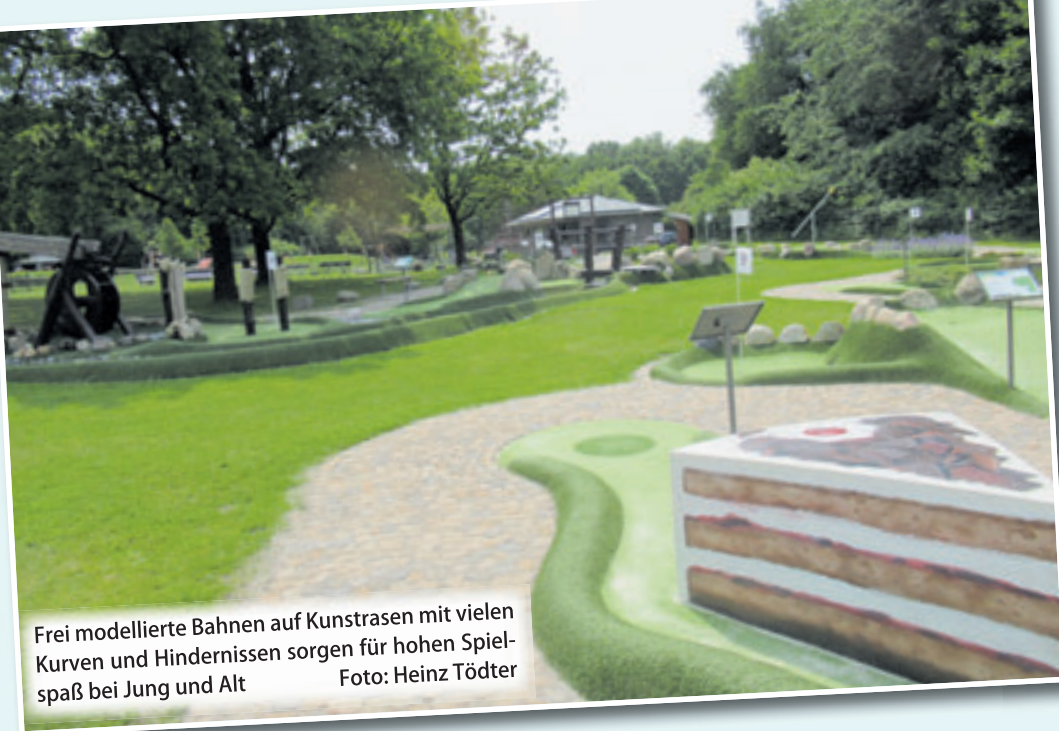
Frei modellierte Bahnen auf Kunstrasen mit vielen Kurven und Hindernissen sorgen für hohen Spielspaß bei Jung und Alt

■ (mk) Schneverdingen. Adventuregolf ist die moderne Art des bekannten Minigolfs. Frei modellierte Bahnen auf Kunstrasen mit vielen Kurven und Hindernissen sorgen für hohen Spielspaß bei Jung und Alt. Beim Schnucken-Golf dreht sich alles um die Lüneburger Heide – die 18 Bahnen der Minigolfanlage stehen jeweils für eine besondere Attraktion unserer Heide-region. Den Anfang bildet natürlich die legendäre Lüneburger Salzsau, weiter geht es über den Wilseder Berg und durch den Schneverdinger Heidegarten mit der imposanten Sonnenuhr. Vorbei an Bendestorfer Binnendüne, dem Egestorfer Steingarten, der Buchweizenorte und den leckeren Heidekartoffeln kommt man dann zurück ins Schneverdinger Pietzmoor mit den blauen Fröschen und zum Abschluss zu den Heidschnucken, bevor am Kiosk Erfrischungen auf die Spieler warten. Und während die Erwachsenen sich bei Kaffee und Kuchen auf der Kaffeeterrasse oder unter den alten Eichen vom Spiel aus-