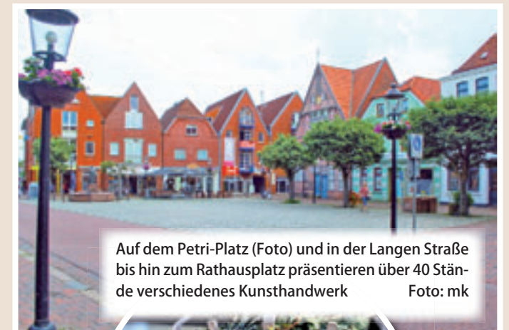
Auf dem Petri-Platz (Foto) und in der Langen Straße bis hin zum Rathausplatz präsentieren über 40 Stände verschiedenes Kunsthandwerk

ten Schaustellern mit ihren Verzehr- und Getränkeständen verwöhnen lassen. Besucher können sich natürlich am Verkaufsoffenen Sonntag am 3. Mai von 13 bis 18 Uhr in den gut sortierten Geschäften auf einen gemütlichen Shopping-Tag freuen, bei dem das eine oder andere Schnäppchen zu machen ist.