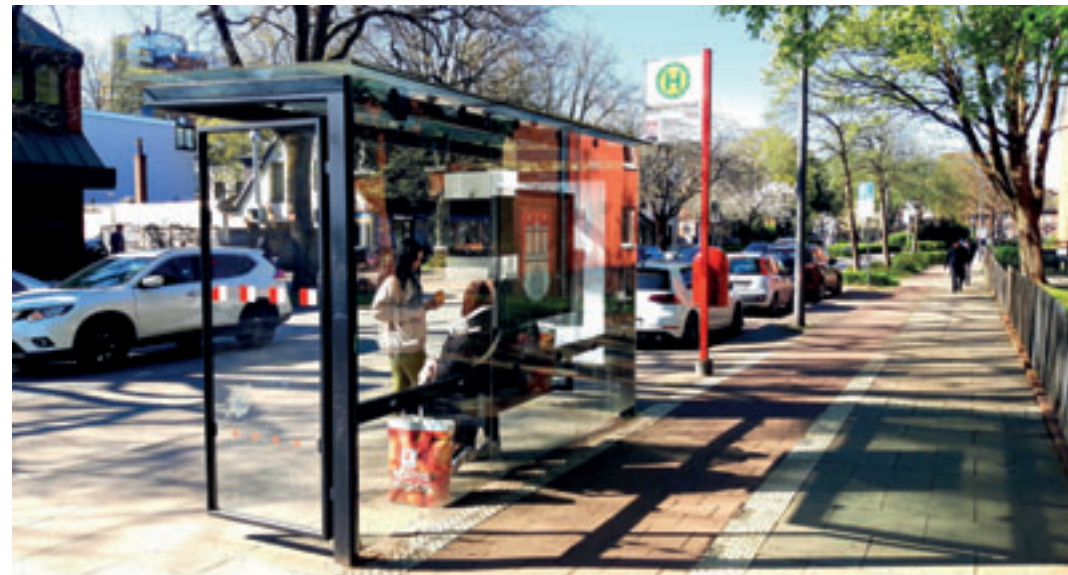
Bislang gibt es in Harburg/Süderelbe nur bedachte Bushaltestellen ohne Grünbepflanzung.

■ (mk) Harburg/Süderelbe. Vor dem Hintergrund der fortschreitenden Klima- und Biodiversitätskrise bestehe laut Grünen ein erhöhter Handlungsbedarf zur Stärkung ökologischer Strukturen im städtischen Raum. Insbesondere dicht bebaute Städte seien auf zusätzliche Maßnahmen angewiesen, um Lebensräume für Tiere und Pflanzen zu schaffen und klimatische Belastungen zu verringern.