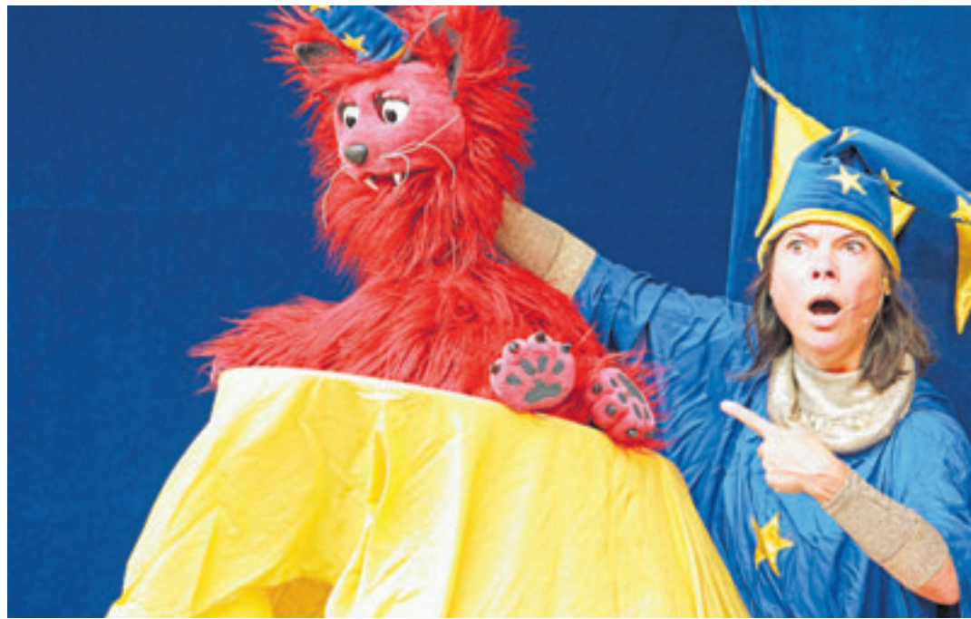
Mit Uroma Ursulas Zauberkiste und einer magischen Katze gelingt es Zora, auf die Bühne zu kommen. Wie genau, können die Besucher des Sonntagsplatzes erfahren

die Bühne: Zora gehört zur Zirkusfamilie – aber auf die Bühne darf sie nicht. Während die anderen aufre-