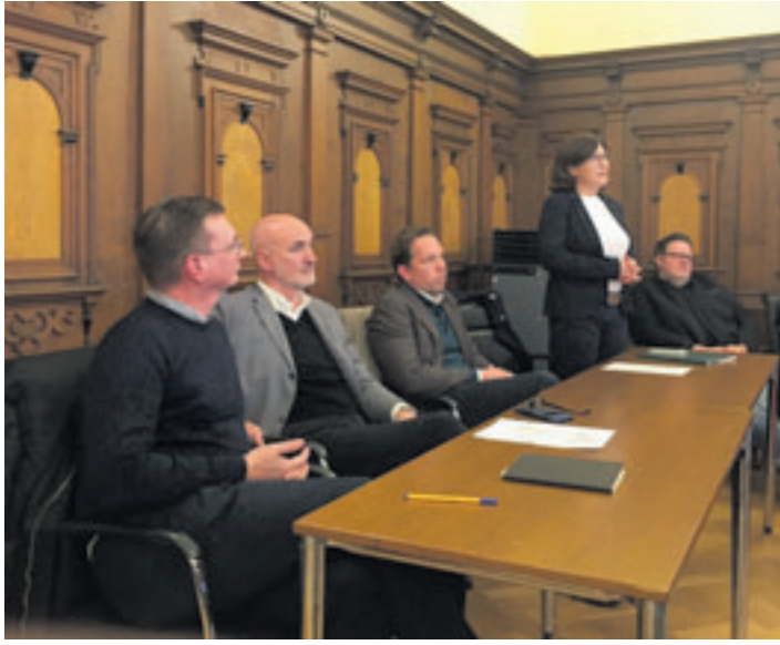
Vertreter von Störmer Murphy and Partners und Becken Development GmbH referierten über das Projekt „Neuländer Quartier“

■ (mk) Harburg. Wie geht es weiter mit dem ruhenden Bauprojekt Neuländer Quarree, wollten SPD und Grüne wissen. In einem Antrag hatten die Parteien den Vorsitzenden der Bezirksversammlung gebeten, auskunftsfähige Vertreter der Behörde für Stadtentwicklung und Wohnen zeitnah in den Stadtentwicklungsausschuss einzuladen, um über den gegenwärtigen Stand der Verhandlungen zur Zukunft der Entwicklung der beiden Grundstücke Neuländer Quarree und New-York Hamburger zu berichten. Beide Flächen stehen für eine wechselvolle Geschichte: Gedacht waren die Areale, die zuletzt der Firma Consus – einer Tochter der Adler-Gruppe – gehörten, ei-