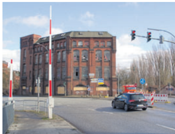
Die Gebäude der New-York Hamburger Gummi-Waaren Compagnie bilden nun ein eigenes Projekt