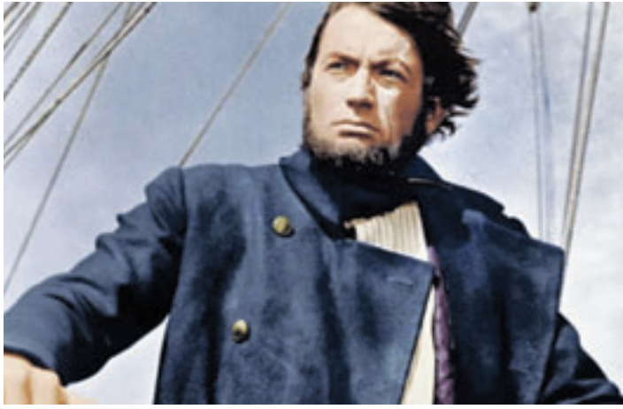
Gregory Peck wäre im April 110 Jahre alt geworden. Ein guter Grund, mit Moby Dick mal wieder einen Filmklassiker zu zeigen

Um Gedenken geht es auch in dem Film, der am Sonntag, 10. Mai, um 18 Uhr startet. Die Organisation „Omas gegen Rechts“ präsentiert