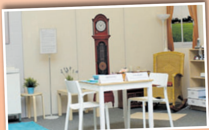
Die begehbare Demenz-Musterwohnung der Diakonie Hamburg macht erlebbar, wie kleine Anpassungen das Leben mit Demenz erleichtern können

gen für Betroffene, Zugehörige und Fachkräfte. Zusätzlich hat die Diakonie Hamburg für Angehörige den Demenz-Kompass entwickelt – einen umfassenden Flyer mit wichtigen Informationen, Tipps und Hilfsangeboten für den Umgang mit Demenz im Alltag. Interessierte können diesen unter 040 306295 telefonisch bestellen oder auf der Website der Diakonie Hamburg herunterladen. Weitere Informationen dazu, wie die Diakonie Hamburg Menschen mit Demenz und ihre Angehörigen unterstützt, gibt es unter www.diakoniehh.de/demenz .