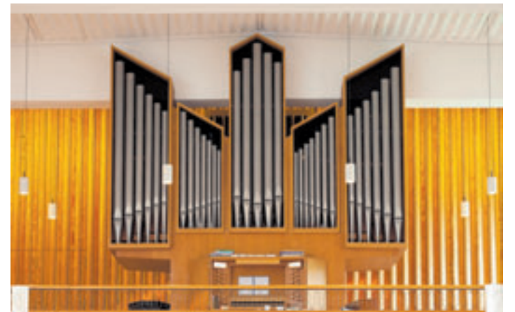
Nach der Sanierung der Orgel in den vergangenen Monaten können sich die Besucher der Thomaskirche wieder auf erstklassige Konzerte freuen