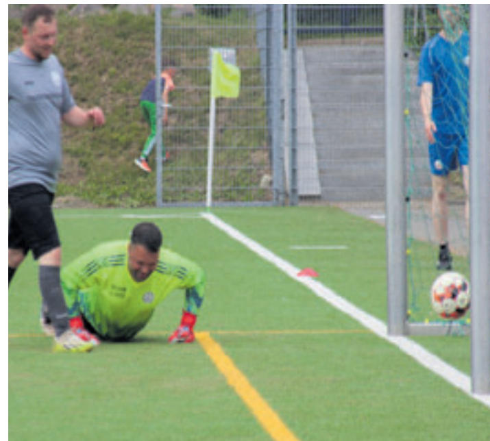
Drin oder nicht drin – das war beim Benefizturnier der HTB Heroes Anfang Juni auf der Jahnhöhe Nebensache