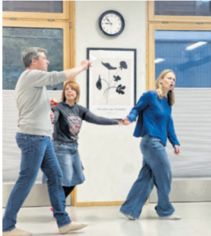
In entspannter Atmosphäre zeigt die Theaterschule Neugraben Interessierten verschiedene Übungen und Improvisationen aus dem Unterricht

Freude am Schauspiel unmittelbar erleben. Vorkenntnisse sind nicht erforderlich. Bei einem Getränk bietet sich die Gelegenheit, die Arbeit der Theaterschule kennenzulernen, mit den Kursteilnehmern ins Gespräch zu kommen und einen unterhaltsamen Abend zu verbringen. Die Veranstaltung richtet sich an alle Erwachsenen, die neugierig auf Schauspiel sind oder den Kurs unverbindlich kennenlernen möchten. Der Eintritt ist frei. Über Spenden zur Unterstützung der Arbeit der Theaterschule Neugraben freut sich das Team. Weitere Informationen unter www.theaterschuleneugraben.de .