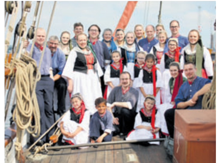
Begeistern weit über die Grenzen Finkenwerders und Hamburgs hinaus die Menschen: Die Finkwarder Speeldeel und de Lütt Finkwarder Speeldeel

■ (au) Finkenwerder. 50 Jahre Zusammenarbeit mit Rolf Zuckowski und 120-jähriges Bestehen: Genügend Gründe für die Finkwarder Speeldeel, diese beiden Ereignisse mit einem Sommerkonzert zu feiern! Rolf Zuckowski und die Finkwarder Speeldeel laden daher zu einem Konzert in familiärer und gemütlicher Atmosphäre ein am Sonntag, 21. Juni, um 16 Uhr in die Aula der Stadtteilschule Finkenwerder, Norderschulweg 14. Wenn Lieder wie „Snack mol wedder Platt“ oder „Fohr mol wedder de Ilv lang“ erklingen, wird gemeinsam gesungen und bestimmt auch ein wenig in Erinnerungen geschwelgt. Ein besonderes Highlight: Auch die Lütt Finkwarder Speeldeel, das Kinderensemble der Finkwarder Speeldeel, steht mit auf der Bühne. Vor genau 50 Jahren brachten Rolf Zuckowski und die Finkwarder Speeldeel ihre erste gemeinsame Langspielplatte „Hüt is Hüt“ heraus. Damit begann eine Zusammenarbeit, aus der über die Jahre eine enge und gewachsene