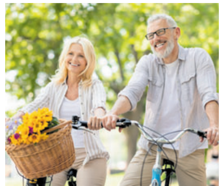
Aktiv sein, frische Luft genießen und den Kopf frei bekommen – das tut Körper und Nerven gut. Eine ausgewogene Ernährung, z.B. mit wichtigen B-Vitaminen, kann dafür wichtige Impulse liefern

Eine gezielte Nährstoff-Zufuhr kann dazu beitragen, körpereigene Regenerationsprozesse der Nerven zu unterstützen. Besonders wichtig sind dabei ausgewählte B-Vitamine: Vitamin B6 spielt eine zentrale Rolle für die Signalübertragung im Nervensystem.