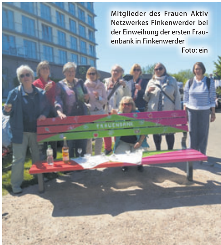
Mitglieder des Frauen Aktiv Netzwerkes Finkenwerder bei der Einweihung der ersten Frauenbank in Finkenwerder

Vorbeischaun, an der Elbe sitzen, Schiffe beobachten oder einfach die Ruhe genießen – die Frauenbank steht dort offen für alle, die gemütlich sitzen, den Ausblick genießen, ein Buch lesen, eine Gesprächspartnerin treffen oder aber auch Rat und Hilfe brauchen. Auch anonyme Hilfesuche sind möglich. „Brauchst du Hilfe in nicht einfachen Lebenssituationen oder möchtest einfach nur mal reden? Jede Frau kann auf der Frauenbank Unterstützung finden. An vielen Wochenenden wird es eine Zu-