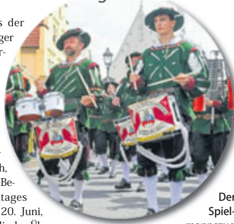
Der Spielmannszug aus Hofheim zählt zu den besten Deutschlands und trägt aktuell den Titel des Deutschen Vizemeisters

■ (au) Harburg. Eines der Highlights des Harburger Vogelschießens der Harburger Schützengilde von 1528 e.V. ist der Ausmarsch aus dem Rathaus und der Umarmung durch Harburg. Nun kommt noch eines hinzu: „Die Harburger Schützengilde freut sich, den Besucherinnen und Besuchern des Schützenfestes am heutigen Samstag, 20. Juni, eine besondere musikalische Überraschung präsentieren zu können: Das Blasorchester Seevetal erhält Unterstützung durch einen befreundeten Fanfaren- und Spielmannszug aus Hofheim in Franken“, teilt die Gilde mit. Rund 40 Musiker, Fahenschwinger sowie Standartenträger reisen aus Bayern nach Harburg an, um gemeinsam mit den örtlichen Musikzügen für ein außergewöhnliches Klangerlebnis zu sorgen. Der Spielmannszug aus Hofheim zählt zu den besten Deutschlands und trägt aktuell den Titel des Deutschen Vizemeisters. Von 14.30 bis 15.30 Uhr geben die Gäste ein exklusives Platzkonzert auf dem Harburger Rathausplatz. Im Anschluss begleiten die Musiker den Festumzug durch Harburg und werden dabei ihr beeindruckendes Können eindrucksvoll unter Be-