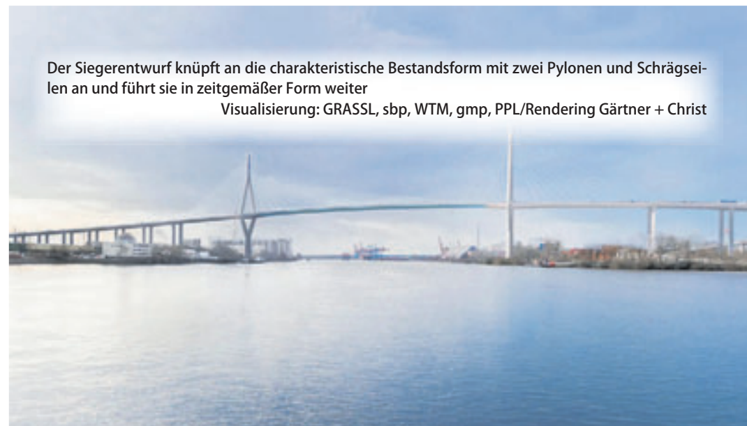
Der Siegerentwurf knüpft an die charakteristische Bestandsform mit zwei Pylonen und Schrägseilen an und führt sie in zeitgemäßer Form weiter Visualisierung: GRASSL, sbp, WTM, gmp, PPL/Rendering Gärtner + Christ

der Entwurf technisch neue Maßstäbe, etwa durch einen gezielt reduzierten und effizienteren Einsatz CO 2 -intensiver Materialien wie Stahl. Der ausgewählte Ent-