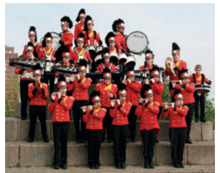
Die Showband des Schützenverein Neugraben-Scheideholz e.V. freut sich auf musikalischen Nachwuchs, der sie auch bei den verschiedensten Veranstaltungen und Aktivitäten begleiten wird.

Geprobt wird jeden Mittwoch von 16:30 Uhr bis 18:00 Uhr im Schützenheim Neugraben, Im Neugraber Dorf 48b, 21147 Hamburg. Der Jahresbeitrag für Kinder und Jugendliche liegt bei 47,00 Euro. Die benötigten Instrumente werden vom Verein kostenlos zur Ver-