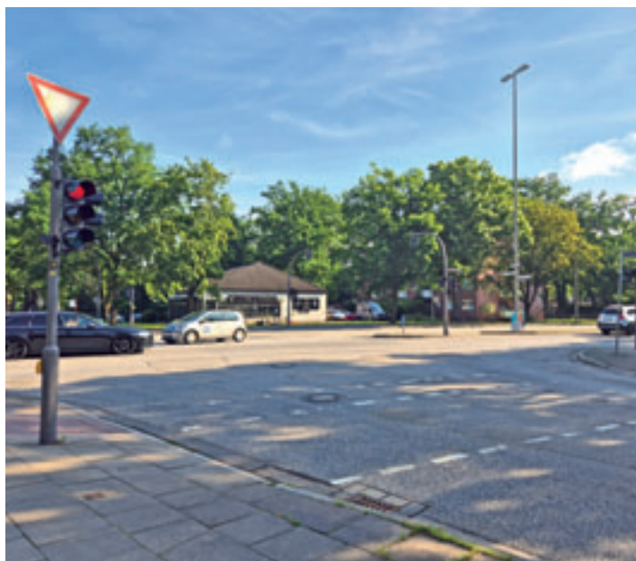
In den Herbstferien werden zwei Kreuzungen umgebaut, darunter die Kreuzung Scharlberg / Fischbeker Heuweg

Änderungen werden über die Baustelleninformationen unter www.hamburg.de/verkehr/stau-und-baustellen/baustellen und auf lsbg.hamburg.de mitgeteilt. Weitere Fragen beantwortet der LSBG unter lsbgkommunikation@lsbg.hamburg.de .