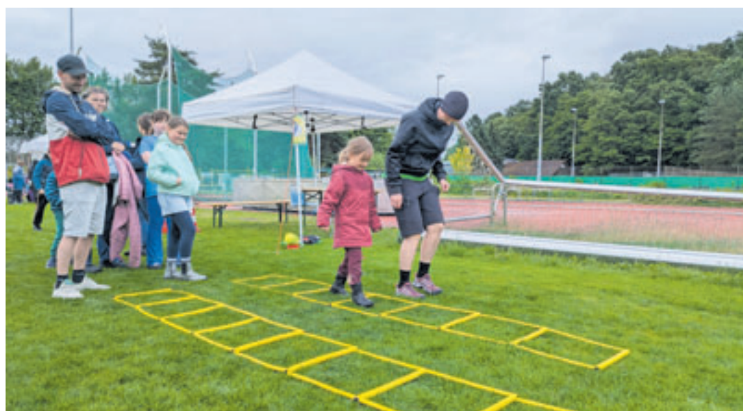
Bei der Mitmach-Rallye konnten die Kids zahlreiche Sportarten ausprobieren

man bei dem Regen leider machen, das bleibt nicht aus“, erklärte Mohr. „Aber insgesamt sind wir sehr zufrieden. Wir haben dem Regen getrotzt und hatten ein schönes Sommerfest.“ Zum diesjährigen Sommerfest der HNT gehörte auch wieder eine große Tombola, bei der mit etwas Glück tolle Preise warteten. „Wir möchten uns ganz herzlich bei allen Geschäften und Unternehmen aus der Nachbarschaft bedanken, die uns dafür Preise zur Verfügung gestellt haben“, sagte Mohr. „Wir bedanken uns außerdem bei unserem engagierten Helferteam, unseren Partnern und allen Unterstützern. Alle zusammen haben diese schöne Veranstaltung möglich gemacht – und wir freuen uns auch alle gemeinsam schon auf das nächste Jahr.“