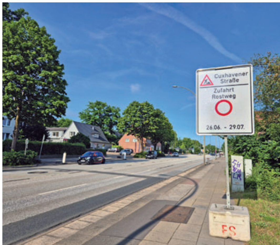
Für rund zwei Monate müssen sich die Nutzer der B73 auf Verkehrsbehinderungen einstellen. Laut LSBG wird die Fahrbahn für eine verkehrssichere und langlebige Infrastruktur erneuert

Zweimonatige Bauphase beginnt am 26. Juni