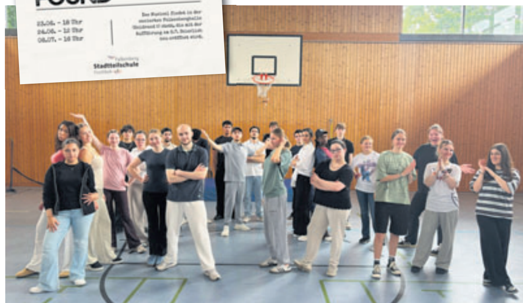
Sie haben eine Geschichte geschrieben, geprobt, getanzt und gehen damit nun als Musical auf die Bühne: Schüler der Stadtteilschule Fischbek-Falkenberg