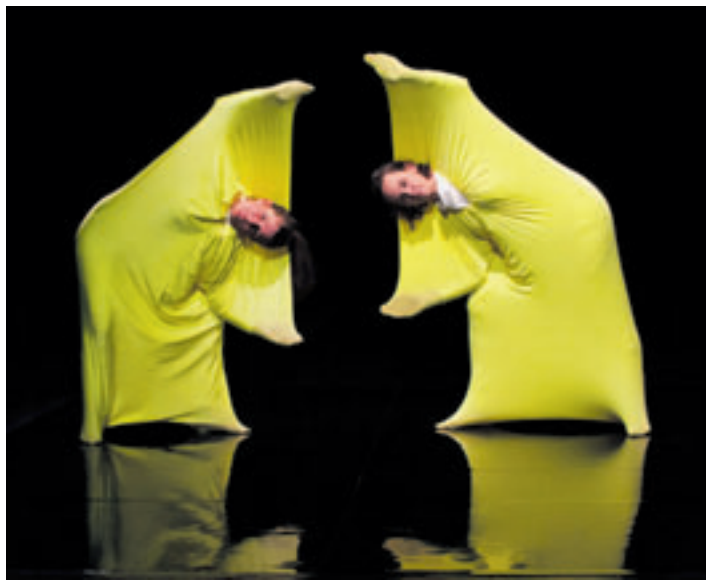
Am 3. Juli wird das Stück „Luca – eine Urzelle spielt verrückt“ im Rahmen des Ersten Harburger Kindertheaterfestivals gespielt.

■ (sl) Süderelbe. Zehn Theaterstücke, zehn verschiedene Ensembles, sechs Bühnen – am Sonntag, 28. Juni, fällt der Startschuss für das erste Harburger Theaterfestival für junges Publikum. Was nördlich der Elbe schon lange selbstverständlich zum Kulturprogramm gehört, hat jetzt endlich auch den Sprung über den Fluss geschafft. Bis Montag, 6. Juli, zeigen verschiedene Theatergruppen der freien Szene im ganzen Bezirk verteilt ihre spannendsten Produktionen für junge Menschen im Alter zwischen zwei und zwölf Jahren. Der Spielplan bietet ein abwechslungsreiches Programm vom pointierten Figurenspektakel über modernen Tanz bis hin zum engagierten Performance-Theater in Vormittagsvorstellungen für Kindergärten und Grundschulen. Organisiert wird das Spektakel von der compag-