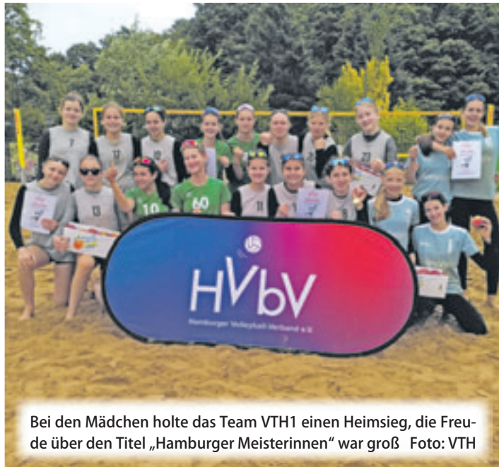
Bei den Mädchen holte das Team VTH1 einen Heimsieg, die Freude über den Titel „Hamburger Meisterinnen“ war groß

■ (au) Neugraben. Das Volleyball-Team Hamburg (VTH) war am vergangenen Samstag Ausrichter der Hamburger U15-Vereinsmeisterschaften im Beachvolleyball. Insgesamt fünf Jungen- und acht Mädchenteams gingen auf der HNT-Beachanlage am Opferberg bei wechselnden Bedingungen mit Regen und böigem Wind an den Start. Bei den Mädchen holte das Team VTH1 einen Heimsieg. Als Hamburger Meisterinnen geht es für sie nun Ende Juni zur Deutschen Meisterschaft nach Freiburg. Die anderen drei VTH-Teams belegten die Plätze vier, fünf und sieben. Im Turnier der Jungen gelang den Gastgebern kein Sieg, aber der eine oder andere Satzgewinn. Das jahrgangsjüngere VTH-Team will darauf aufbauen und nächstes Jahr