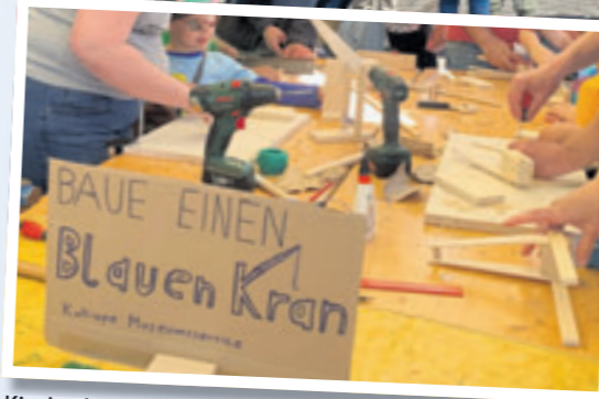
Kinder können bei der „Kalliope“ einen Ewer aus Holz basteln.

doch immer Massenveranstaltungen“, kann ganz beruhigt sein. Statt mehrerer Millionen Menschen wie jüngst beim Hamburger Hafengeburtstag, tummeln sich hier „nur“ rund 30.000 Gäste. „Wir wollen