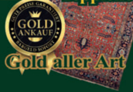
Gold aller Art