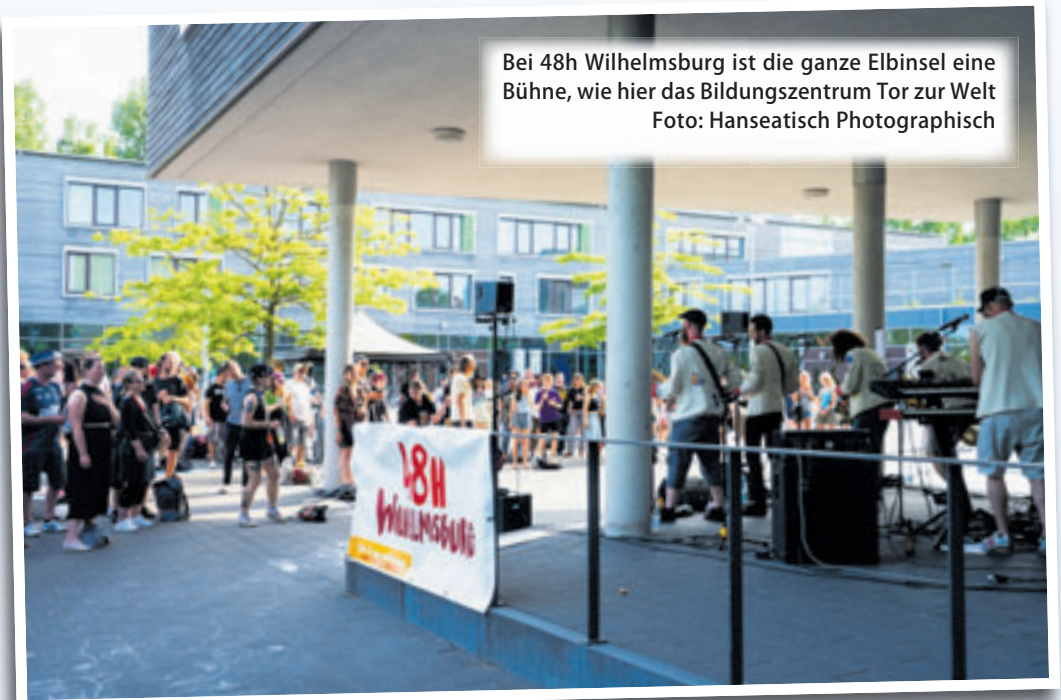
Bei 48h Wilhelmsburg ist die ganze Elbinsel eine Bühne, wie hier das Bildungszentrum Tor zur Welt

Orten und der Unterstützung vieler Menschen aus dem Stadtteil. Besucher können das Festival unter anderem durch Spenden, Festivalbändchen sowie dem Kauf von Getränken und Speisen an den Veranstaltungsorten unterstützen. Das vollständige Programm gibt es ab jetzt online unter www.48h-mv.de .