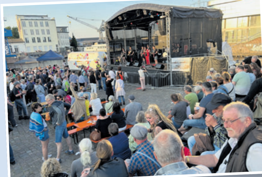
Gute Musik auf drei Bühnen, ein leckeres Getränk und entspannte Atmosphäre – das gibt es nur beim Harburger Binnenhafenfest.

18 Uhr. Diese Fahrten sind kostenlos, aber die Schiffsführer freuen sich über eine Spende. am Freitagabend um 18 Uhr mit „Kultfaktor“ auf der Kanalplatzbühne los. Bis 20 Uhr wird Post Punk und gespielt, bevor um 20 Uhr „Excited-Depeche Mode Tribute“ übernimmt. Den Abschluss bildet die Blues-Brothers Show von „Sixtyfive Cadillac“.