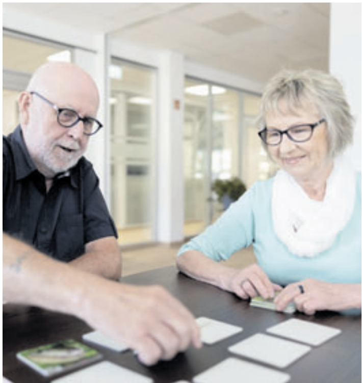
Ehrenamtliche schenken ihre Zeit – sei es beim Kartenspielen oder einem Spaziergang

Wer Interesse an dem Ehrenamt hat, meldet sich unter Telefon 04172 9660 oder per E-Mail an harburg@johanniter.de, ebenso Menschen, die einen Besuchswunsch haben.