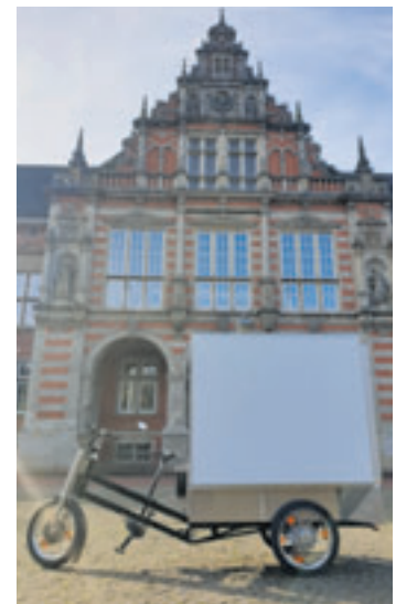
Bessere Parkmöglichkeiten vor Ort, gute Erreichbarkeit auch in engen und vollen Innenstädten, Fahrspaß und einen positiven Effekt auf die Gesundheit der Mitarbeiter, das bietet ein Lastenrad

■ (au) Harburg. Es soll flexibel, umweltfreundlich und alltagstauglich sein: das Lastenfahrrad. Seit März 2023 bereits können die Harburger vom Bezirksamt Harburg im Rahmen des Forschungsprojekts „KoGoMo zu nachhaltigen Mobilitätsformen“ eines für den privaten und gewerblichen Gebrauch nutzen. Nun bietet das Bezirksamt Harburg im Juni zwei Informationsveranstaltungen inklusive Testmöglichkeiten zur gewerblichen Nutzung von Lastenfahrrädern an. Der erste Termin ist am 4. Juni, von 11 bis 12.30 Uhr. Auf der 90-minüti-