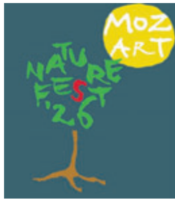
Die Mozartgesellschaft Hamburg und der NABU organisieren gemeinsam das Mozart Nature Fest 2026 Screenshot: Mozart Gesellschaft

sationsteam. Während die Mozart-Gesellschaft für die Musik sorgt, bietet der NABU