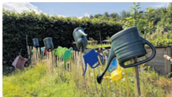
Kommenden Sonntag können im BUND-Naturerlebnispark allerlei Samen, Sträucher und Stauden getauscht werden.

ben – aber vielleicht schon immer gerne haben wollten. Natürlich können die gewünschten Pflanzen auch ohne Tausch gegen eine Spende erworben werden. In entspannter Atmosphäre werden Garten-Erfahrungen ausgetauscht. Tipps und Infos rund ums naturfreundliche Gärtnern und zum Umgang mit den erworbenen Pflanzenschatzen bekommt man gratis dazu! Weitere Informationen unter www.bund-hamburg.de/service/termine/detail/event/bund-pflanzentauschmarkt-naturerlebnispark/ .