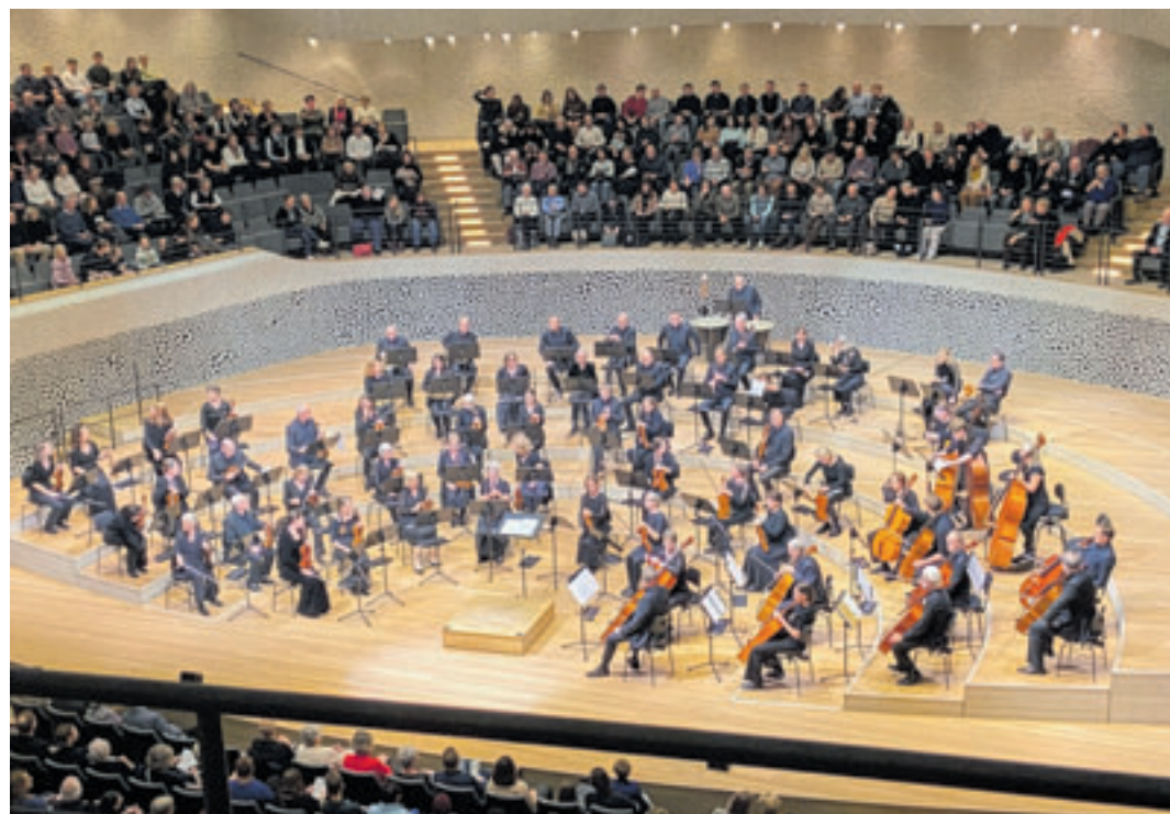
Das Hamburger Ärzteorchester, hier bei einem Auftritt in der Elbphilharmonie, gastiert zum 15. Mal im Helms-Saal für den guten Zweck

nen schönen Abend mit möglichst viel Publikum.“ Der Erlös ist auch in diesem Jahr wieder größtenteils für die Unterstützung von sozialen Einrichtungen gedacht, die sich um Kinder kümmern. „Das Schöne an diesem