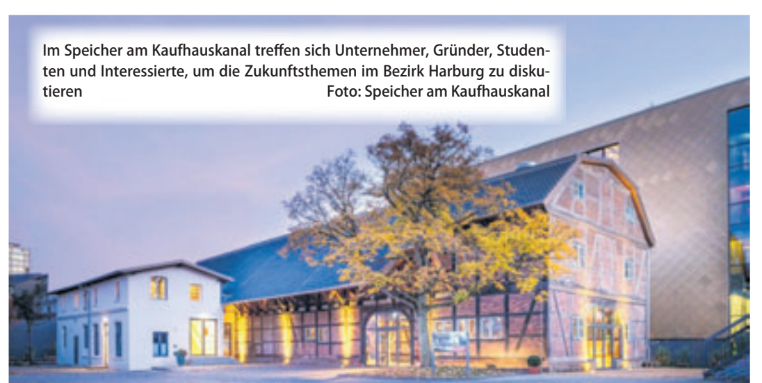
Im Speicher am Kaufhauskanal treffen sich Unternehmer, Gründer, Studenten und Interessierte, um die Zukunftsthemen im Bezirk Harburg zu diskutieren

Im Mittelpunkt steht die Frage, wie sich der Wirtschafts- und Wissenschaftsstandort Harburg weiterentwickeln kann. Besucher erwartet ein vielfältiges Programm mit praxisnahen Talks, Workshops, Best Practices sowie kostenfreien Beratungsangeboten – etwa zu Gründung, Finanzierung, Nachfolge, Energie oder Innovation. Ein besonderer Fokus liegt auf dem Austausch: Start-ups treffen auf Studenten, Unternehmen auf Wissenschaft, und Akteure aus Politik und Kultur kommen miteinander ins Gespräch. Ergänzt wird das Programm durch den „Walk of Innovation“, der aktuelle Forschungs- und