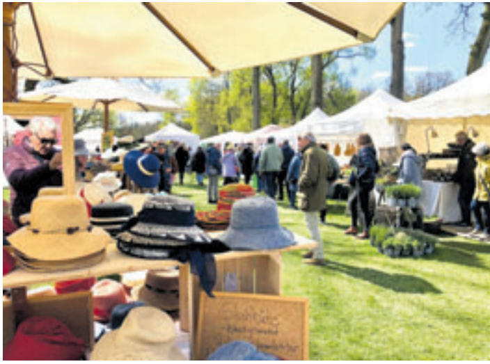
Traditionelles Kunsthandwerk und moderne Dekorationsprojekte finden Besucher in großer Auswahl, ob aus Holz oder Porzellan, Ton, Papier, in Leder oder Textil

■ (mk) Egestorf. Die „Landträume“ (Frühlingsmarkt) auf Hof Sudermühlen am 11. bis 12. April von 11 bis 18 Uhr stehen wieder an. Unter dem Motto „Die Freude am Schönen“ können sich Besucher in dem idyllisch gelegenen Ort einen schönen Tag machen. Zahlreiche Aussteller sind aus Nah und Fern angereist und haben ihre attraktiven Stände am Rundweg, im Hotel, zwischen den Pferdestallungen und auf dem Grün am Mühlteich aufgebaut. Sie laden zum Stöbern, Sich-inspirieren-lassen und Shoppen ein. Pflanzen und Blumen im Eingangsbereich künden vom Frühling und stimmen auf eine zauberhafte Veranstaltung mit einer besonderen Atmosphäre ein.