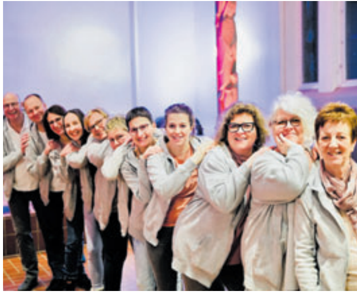
Der Chor „Beside You Gospel“ verspricht einen Abend voller Energie, Gefühl und Lebensfreude

Mit einem mitreißenden Mix aus klassischen und modernen Gospelstücken verspricht der Chor einen Abend voller Energie, Gefühl und Lebensfreude. Mal kraftvoll und rhythmisch, mal leise und berührend – die Sängerinnen und Sänger nehmen ihr Publikum mit auf eine emotionale musikalische Reise, die lange nachklingt. „Ein Abend, der unter die Haut geht!“, versprechen die Organisatoren. Der Eintritt ist frei, Spenden sind herzlich willkommen.