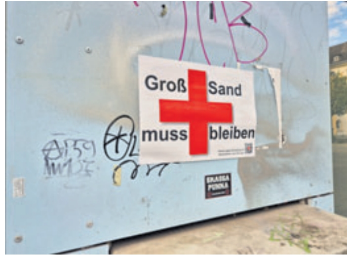
Monatelang haben Initiativen für den Erhalt des Krankenhauses Groß-Sand gekämpft – vergeblich

■ (au) Wilhelmsburg. Die endgültige Schließung des Krankenhauses Groß-Sand schockiert viele Menschen, nicht nur auf den Elbinseln. Der Verein Zukunft Elbinsel lädt unter dem Motto „Trauer und Dank für Groß-Sand“ am 10. April um 17 Uhr auf den Bonifatiusplatz ein. Es soll Abschied genommen werden von der „Insel der Menschlichkeit“ – mit einem „Leichenschmaus fürs Krankenhaus“, heißt es in einer Mitteilung. „Wir wollen bei der Kundgebung auf dem Bonifatiusplatz am Krankenhaus Groß-Sand zusammenkommen, uns austauschen, laut werden und gemeinsam für ein Krankenhaus in Wilhelmsburg eintreten. Bringt dazu gerne etwas zum Essen und Trinken mit, für Sitzgelegenheiten wird gesorgt sein“, so der Aufruf der Organisatoren. Zudem möchte der Verein unter anderem folgen-