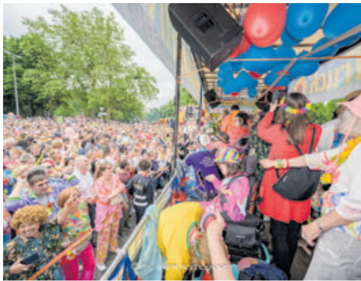
Auf dem Inklusionstruck von Peter Sebastian können Rollstuhlfahrende den Schlagermove mitfeiern

■ (sl) Hamburg. Ein Orakel ist nicht nötig, um zu wissen, dass am 4. Juli wieder Tausende Menschen mit bunten Perücken und Klamotten aus den 1970er-Jahren völlig entfesselt beim traditionellen Schlagermove auf den Straßen tanzen. Zum sechsten Mal mit dabei ist der Rollstuhl-Truck, den Schlagerstar Peter Sebastian vor ein paar Jahren ins Leben rief. Ab sofort können sich Rollstuhlfahrende für einen der begehrten Plätze auf dem Truck zum Schlagermove bewerben. „Wer als Rollstuhlfahrender Lust auf Schlager hat und inklusive Begleitperson kostenlos auf dem Truck mitfeiern möchte, kann sich bis zum 31. Mai unter dem Stichwort ‚Rollstuhl-Truck‘ bewerben. Schicken Sie bitte eine E-Mail an info@achteaufmich.de .“