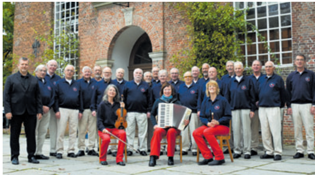
Der Hamburger Lotsenchor tritt am 12. April in der St. Gertrud-Kirche in Altenwerder auf

fen mit englischer Umgangssprache. Aus dieser Zeit stammen auch die wenigen echten plattdeutschen Shantys, sie gehören zu dem Besten, was es in diesem Genre gibt. Besucher können sich auf ein einzigartiges Konzert am 12. April ab 17 Uhr in der St. Gertrud-Kirche am Altenwerder Querweg freuen. Der Eintritt kostet 20 Euro, wovon 2 Euro an den „Verein zur Förderung und Erhaltung der St. Gertrud-Kirche Altenwerder e.V.“ gehen.