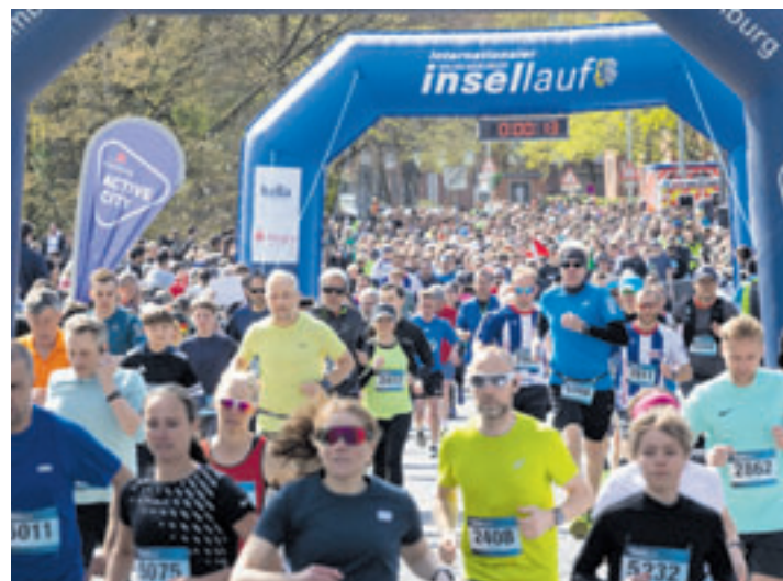
Im vergangenen Jahr nahmen insgesamt 3.700 Menschen am Wilhelmsburger Insellauf teil – Teilnehmerrekord.

Folgende Strecken inklusive Startzeiten stehen zur Auswahl: 8.50 Uhr Elbinsel-Halbmarathon (21,0975 km), 12.10 Uhr Inselläufer (10 km), 12.30 Uhr HASPA-Mühlenlauf (5 km). Anschließend finden ab 14 Uhr die 1 km AURUBIS AG-Schülerläufe der Jahrgänge 2013 – 2020 statt. Alle Infos unter www.wilhelmsburger-insellauf.de .