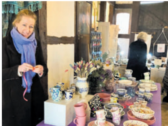
Zahlreiche Aussteller sind aus Nah und Fern angereist und haben ihre attraktiven Stände am Rundweg, im Hotel, zwischen den Pferdestallungen und auf dem Grün am Mühlteich aufgebaut

bereich zeigt Trends für die warme Jahreszeit mit den entsprechenden Accessoires. Es werden außerdem Schmuck, Taschen und hochwertige Wolldecken aus kleinen Manufakturen angeboten sowie Naturkosmetik und vieles mehr. Stände mit Delikatessen, Wurst und Käse, Wein und Spirituosen sowie Schokoladiges verführen zum Naschen. Eine abwechslungsreiche Gastronomie lädt mit Chill-out-Musik zum Verweilen ein. Die „Landträume“ auf Hof Sudermühlen sind ein wunderbares Ausflugsziel! Viel Spaß! Eintritt: 5 Euro / bis 16 Jahre frei Hof Sudermühlen Sudermühlen 1 21272 Egestorf info@selekt-veranstaltungen.de www.selekt-veranstaltungen.de Tel. 04532 260325