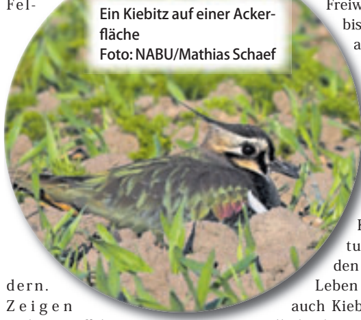
Ein Kiebitz auf einer Ackerfläche

■ (au) Wilhelmsburg. Mit der Initiative „KiebitzKieker“ schützen BUND, NABU und die Umweltbehörde in Hamburg seit 2021 gemeinsam mit landwirtschaftlichen Betrieben Kiebitze in Hamburg. Unterstützung erhalten die Akteure vom Bauernverband und der Landwirtschaftskammer. Das Konzept ist ebenso simpel wie effektiv: Ehrenamtliche halten während der Brutzeit von öffentlichen Wegen aus Ausschau nach Kiebitzen auf den Fel-