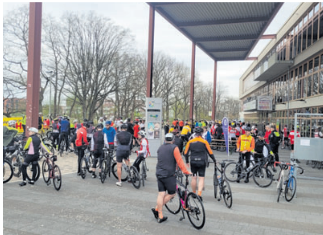
Ein Highlight zu Saisonbeginn, das im vergangenen Jahr sehr gut besucht war: Die Hamburger Radtourenfahrt der Harburger Radsportgemeinschaft.

RTF- und Gravelroute werden drei Geschenkgutscheine über je 100 Euro des örtlichen Fahrradcenters verlost. – Aufgrund des 75-jährigen Jubiläums der HRG haben Interessierte am Tag der Veranstaltung die Möglichkeit, mit einem deutlich reduzierten Jahresbeitrag dem Verein beizutreten. Die Anmeldung ist ab 8 Uhr geöffnet. Rennradfahrer starten ab 9 Uhr, die geführten Gravelbiker um 9.30 Uhr und die Familientour um 10 Uhr. Die Startkosten liegen bei 15 Euro, wobei die Verpflegung an Start/Ziel und unterwegs enthalten ist. Die Familientour ist kostenlos. Eine Voranmeldung ist nicht notwendig. Weitere Infos auf harburger-rg.de/rtf2026 .