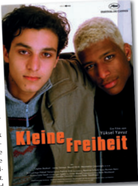
Am 12. April läuft der Film „Kleine Freiheit“ in 17 Hamburger Kinos.

■ (sl) Harburg. Am Sonntag, 12. April, laden die Hamburger Art-house- und Programmkinos zum elften Mal zur außergewöhnlichsten Kinotour Deutschlands ein. Einen ganzen Sonntag lang – von 11 bis 21 Uhr – zeigen in diesem Jahr 17 Hamburger Kinos in der ganzen Stadt den Film „Kleine Freiheit“ von Yüksel Yavuz.