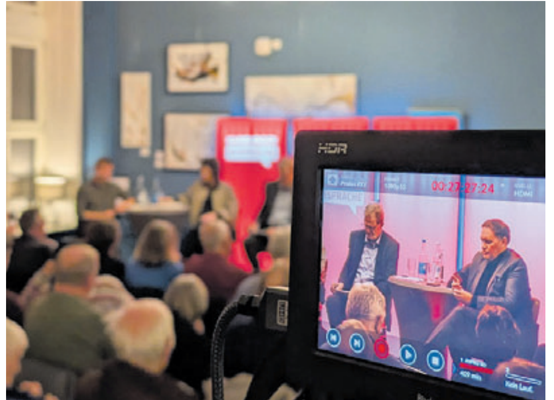
Im November vergangenen Jahres startete die Neuauflage der Harburger Gespräche, in der es unter anderem um die Rolle des Qualitätsjournalismus ging

fluss geprägt. Vor diesem Hintergrund geht die Veranstaltung der Frage nach, ob sich eine neue Phase globaler Machtpolitik – möglicherweise sogar eine Renaissance imperialer Strukturen – abzeichnet. Der Eintritt ist frei. Um Anmeldung unter harburger-gespraech@spd-hamburg.de wird gebeten. Interessierte Bürger sind herzlich eingeladen, sich an der Diskussion zu beteiligen und gemeinsam über die Herausforderungen und Perspektiven einer sich wandelnden Weltordnung zu sprechen.