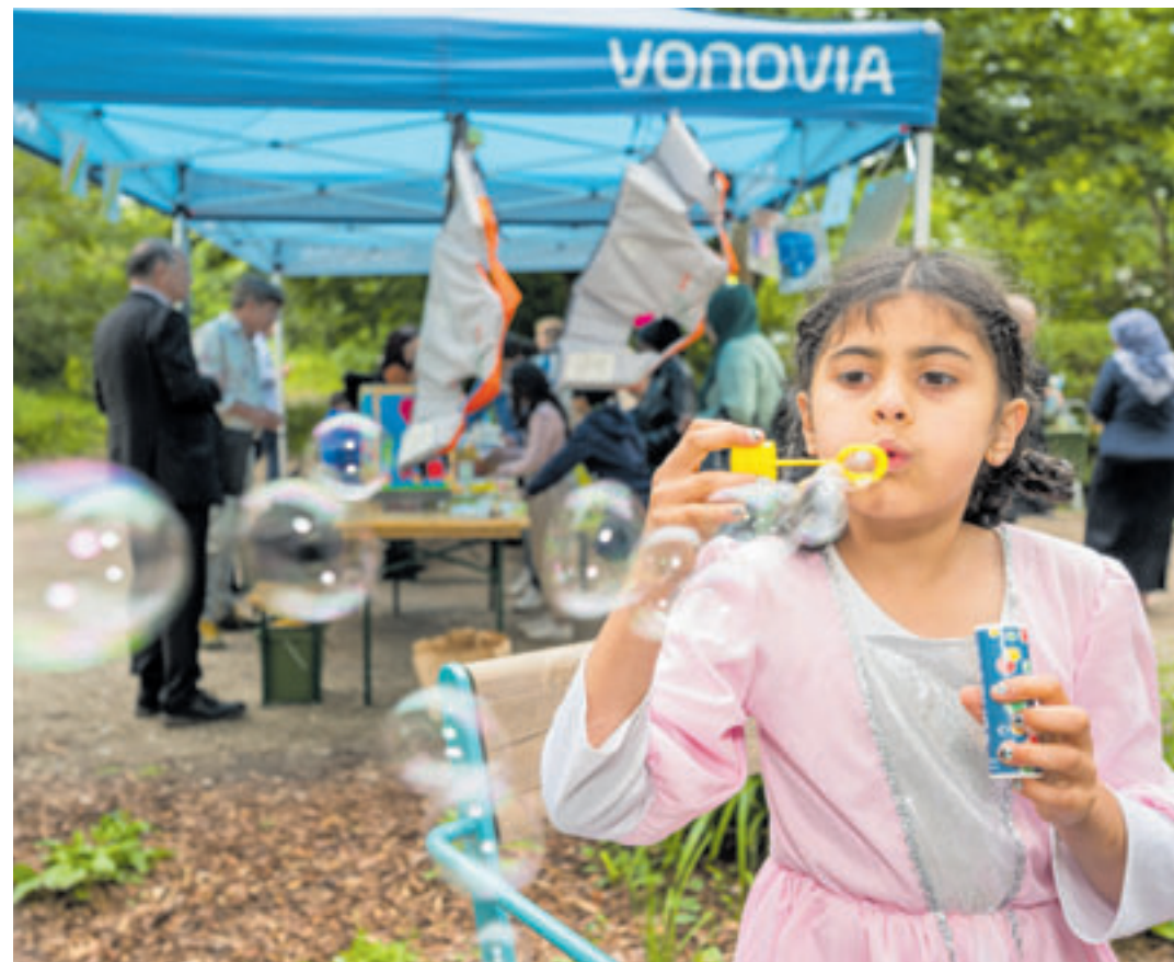
Für die Kinder gab es ein buntes Rahmenprogramm mit themengerechten Aktivitäten und Spielen

der Korallusstraße ein. Neben dem bekannten Programm mit Glücksrad, Insektenhotels, Gewinnspiel und der tatkräftigen Unterstützung durch die Stadtreinigung Hamburg und Musterknaben eG bereicherten weitere lokale Akteure den Aktionstag: Die Schulkind- und Familienbetreuung „Froschteich“, die Kita Krümelkiste, die BI Bildung und Integration Hamburg Süd gGmbH, die Initiative StoP sowie die Stadtteilpflege Wilhelmsburg engagierten sich vor Ort mit Mitmach- und Bastelaktionen sowie Informationen für mehr Nachhaltigkeit in Hamburg-Wilhelmsburg. Die Minibar sorgte für das leibliche Wohl der Besucher.