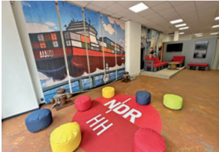
Das NDR Pop-Up Studio in der Bremer Straße 3. Ab dem 13. Juli soll der Raum mit Menschen und Themen gefüllt werden!

Und auch die Hamburger Landespolitik wird sich hier wiederfinden: bereits am 12. Juli, also einen Tag vor Eröffnung, stellt sich der Erste Bürgermeister Peter Tschentscher den Fragen im Sommerinterview. Die Zweite Bürgermeisterin Katharina Fegebank und die Fraktionsspitzen der in der Bürgerschaft vertretenen Parteien folgen im Juli und August. Die Gespräche werden immer im Pop-up-Studio aufge-