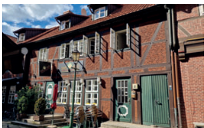
Von außen ist vom Brand nicht mehr viel zu sehen, im Inneren laufen die Aufräumarbeiten auf Hochtouren

schoß. Daraufhin rückte die Feuerwehr mit bis zu 70 Einsatzkräften der Berufs- und der Freiwilligen Feuerwehr an, um das Feuer zu löschen und das historische Gebäude zu retten. Da sich das Feuer in die Zwischendecke des Gebäudes ausgebreitet hatte, erhöhte der Einsatzleiter der Feuer- und Rettungswache Harburg die Alarmstufe auf Feuer mit zwei Löschzügen. Es kamen Drehleitern und ein Teleskopmastfahrzeug zum Einsatz. Gäste, die nach dem Spiel noch gemütlich in der Lämmertwiete verweilten, sollen nach Berichten des Hamburger Abendblatts mitgeholfen haben, Stühle und Tische beiseite zu räumen, um Platz für die Feuerwehrleute und ihre Gerätschaften zu schaffen. Gäste und Bewohner wurden nicht verletzt, ein Kamerad der Freiwilligen Feuerwehr verletzte sich bei den Löscharbeiten am Knie und kam anschließend ins Krankenhaus. Insgesamt dauerten die Löscharbeiten rund fünf Stunden an. Die genaue Brandursache wird nun ermittelt, genauso, wie hoch der Sachschaden insgesamt ist.