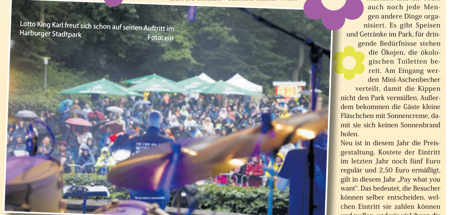
Lotto King Karl freut sich schon auf seinen Auftritt im Harburger Stadtpark

Neu ist in diesem Jahr die Preisgestaltung. Kostete der Eintritt im letzten Jahr noch fünf Euro regulär und 2,50 Euro ermäßigt, gilt in diesem Jahr „Pay what you want“. Das bedeutet, die Besucher können selber entscheiden, welchen Eintritt sie zahlen können und wollen, und wie viel ihnen die Kultur wert ist. Trotz des Modells gibt es aber auch die Möglichkeit, vorab Tickets in drei Preisklassen zu erwerben. Fünf Euro kostet das „Am-Ende-des-Geldes-ist-noch-so-viel-Monat-übrig“-Ticket, Zehn Euro das „Standard-Ticket“ und 20 Euro das „Supporter-Ticket“. Ausgenommen aus diesem Preismodell sind die Auftritte von Stefan Gwildis und Lotto King Karl. Für diese beiden Konzerte erfolgt ein separater Ticketverkauf. Die Tickets sind online und in der Harburg Info, Hölertwiete 6, erhältlich.