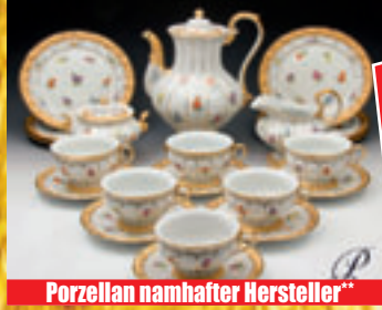
Porzellan namhafter Hersteller**