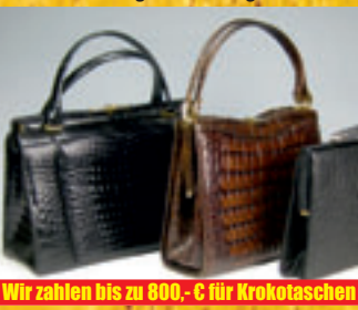
Wir zahlen bis zu 800,- € für Krokotaschen