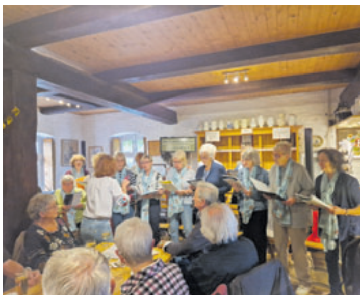
Der Wilhelmsburger Mühlenchor gab zum 25-jährigen Jubiläum der Wilhelmsburger Möhlensnacker sein Können zum Besten!