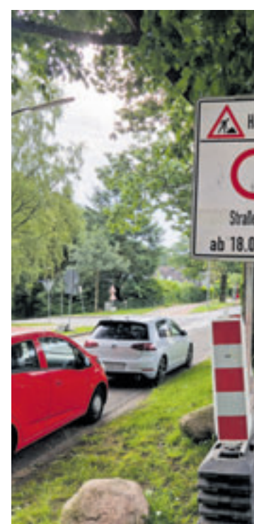
Ab dem 18. Juli wird nun endlich die Fahrbahn erneuert, die Arbeiten dauern circa sechs Wochen an

ten fortgeführt. Die Baufelder der Abschnitte rücken entsprechend des Baufortschritts vom Ehestorfer Weg in Richtung In der Alten Forst. Der Anliegerverkehr ist von beiden Seiten bis an das Baufeld heran möglich. Innerhalb des jeweiligen Baufeldes ist ein Befahren und das Erreichen der Grundstücke nicht möglich. Eine Umleitung ist nicht ausgeschildert.