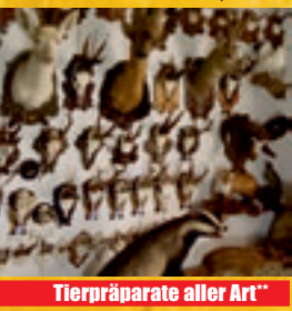
Tierpräparate aller Art**