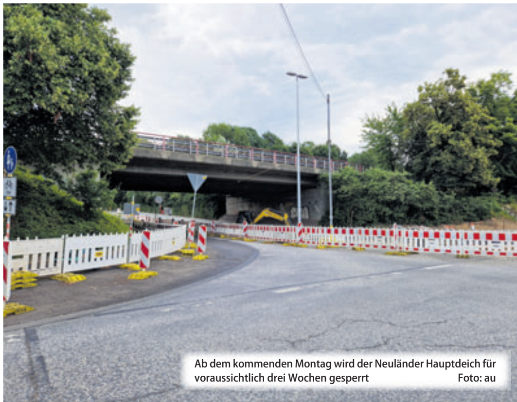
Ab dem kommenden Montag wird der Neuländer Hauptdeich voraussichtlich drei Wochen gesperrt

Die Einrichtung der Einbahnstraße am Veritaskai bleibt aufgrund der Sperrung der Hannoverischen Straße bis Sonntag, 4. August, bestehen. Die Umleitung erfolgt über den Karnapp und die Seevestraße. Der Fußverkehr wird sicher durch das Baufeld geleitet. Der Radverkehr nutzt die Umleitung über die Neuländer Straße und die Nartenstraße.