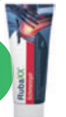
Rubaxx Schmerzgel (PZN 18709526)