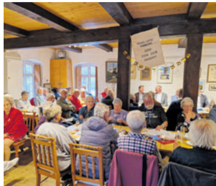
Bis auf den letzten Platz gefüllt war die Wilhelmsburger Windmühle Johanna bei der Jubiläumsfeier Anfang Juli

Wer ebenfalls am Plattdeutschen Stammtisch der Wilhelmsburger Möhlensnacker einmal teilnehmen möchte, das nächste Treffen findet statt am Mittwoch, 7. August, um 18 Uhr in der Wilhelmsburger Windmühle.