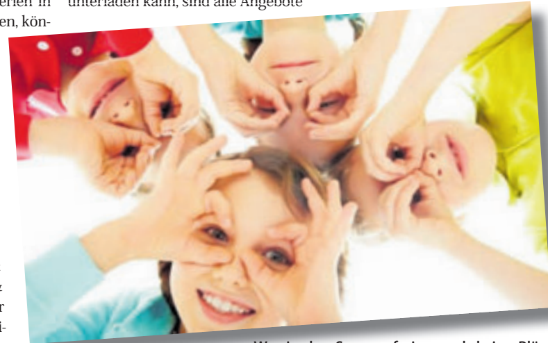
Wer in den Sommerferien noch keine Pläne hat, findet viele Veranstaltungen im Hamburger Ferienpass

Alle Angebote nur für den Bezirk Harburg findet man unter dem Link https://www.hamburg.de/politik-und-verwaltung/bezirke/