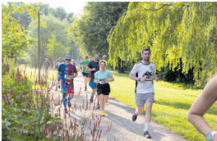
Bei bestem Wetter, noch vor dem angekündigten Gewitter, machten sich die Teilnehmer des Sunset Hamburg 2024 auf die rund fünf Kilometer lange Runde im Wilhelmsburger Inselepark.