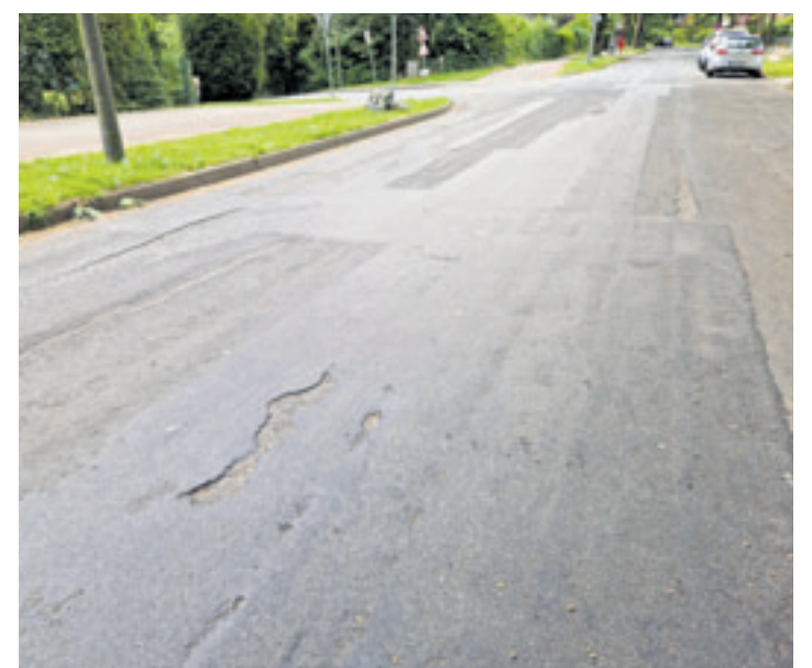
Die Fahrbahn des Hainholzweges ist teilweise in einem sehr schlechten Zustand

Am Donnerstag, 18. Juli und Freitag, 19. Juli, wird der gesamte Abschnitt aufgrund von Fräsarbeiten voll gesperrt. Ab Montag, 22. Juli, werden die Arbeiten in Abschnit-