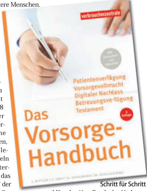
Schritt für Schritt erklärt das Handbuch der Verbraucherzentrale, wie man ausreichend vorsorgt

und die rechtlichen Folgen werden erläutert. Ein eigenes Kapitel nimmt den digitalen Nachlass in den Blick.