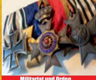
Militariat und Orden

Bisam • Persianer • Fuchspelze aller Art • Zobel • Nerze • Nutria • Chincilla