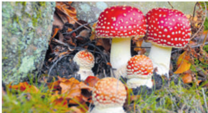
Vom ABC des Pilzesammelns über die Kunst des Buchdrucks bis hin zum Schwedisch-Sprachkurs bietet die Hamburger Volkshochschule (VHS) auch in diesem Herbst wieder ein buntes Programm

Wichtig ist dem Mitarbeiter-Team der VHS, dass sich das Angebot ständig verändert. Natürlich sind die Klassiker wie Englischkurse in allen Schwierigkeitsgraden mit dabei. Aber es gibt auch Achtsamkeitskurse im Bergedorfer Gehölz oder im Wohldorfer Wald, eine PowerPoint-Werkstatt und Mac-Workshops, Veranstaltungen zu Fake News oder zu toxischen Beziehungen.