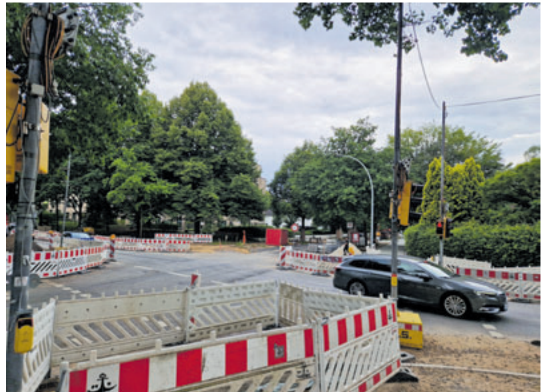
Noch ist die Kreuzung Denickestraße/Weusthoffstraße zu überqueren, ab kommenden Donnerstag ist hier alles vollgesperrt

Informationen zu weiteren Straßenbaumaßnahmen im Bezirk stehen unter www.hamburg.de/politik-und-verwaltung/bezirke/harburg/themen/verkehr zur Verfügung.