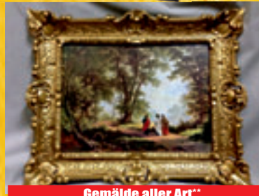
Gemälde aller Art**