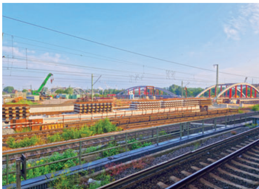
Durch kurzfristige, bauliche Maßnahmen unter anderem an den Eisenbahnbrücken Zollkanal und Harburger Chaussee auf der Veddel kommt es für vier Wochen zu Zugausfällen

Zugverkehr im Hamburger Süden eingeschränkt