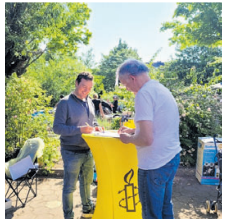
Bereits im vergangenen Jahr informierten die Harburger Mitglieder von Amnesty International auf dem FlohZinn in Wilhelmsburg