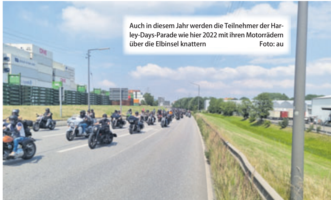
Auch in diesem Jahr werden die Teilnehmer der Harley-Days-Parade wie hier 2022 mit ihren Motorrädern über die Elbinsel knattern

die Köhlbrandbrücke in den Hafens. Die Harley-Parade fährt dann über die Freihafenelbbrücken weiter an den St. Pauli Landungsbrücken und dem Fischmarkt vorbei über die Reeperbahn und endet wieder am Großmarkt Hamburg. Dem entsprechend ist dann mit Straßensperrungen zu rechnen! Weitere Informationen unter https://hamburgharleydays.de .