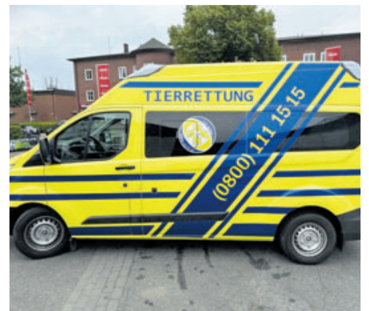
Ab sofort ist in Hamburg ein neuer Tierrettungswagen des TIER-NOTRUF.de im Einsatz.

Angefordert werden kann die Tierrettung rund um die Uhr unter der kostenfreien Rufnummer 0800 111515. Gegründet wurde der TIER-NOTRUF.de im Jahr 2015 und ist mittlerweile in allen fünf norddeutschen Bundesländern und in Nordrhein-Westfalen aktiv. Wer sich als freiwilliger Helfer in der Tierrettung engagieren und ausbilden lassen möchte, kann sich unter www.tier-notruf.de informieren und Kontakt aufnehmen.