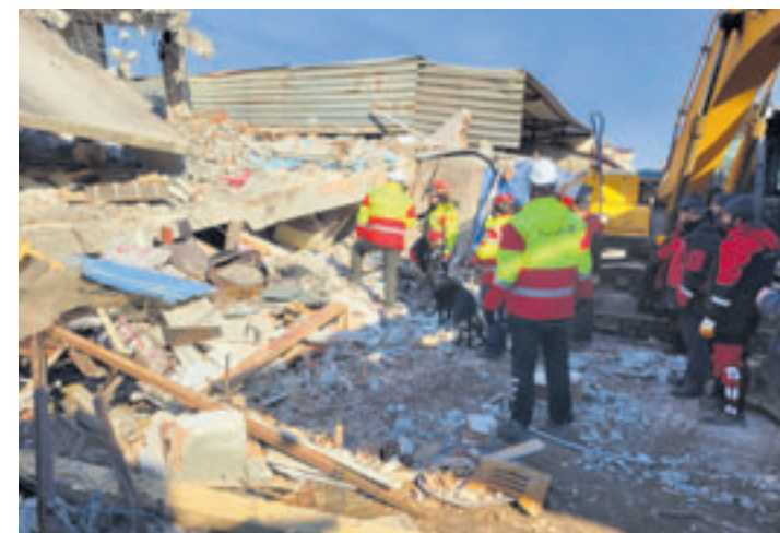
Die Mitglieder der BRH-Rettungshundestaffel Hamburg und Harburg sind in der ganzen Welt unterwegs, um Menschen zu retten, wie hier in der Türkei im vergangenen Jahr

einer Sperrung, die sogar für fünf Monate angesetzt ist, versuchen, Optimismus zu verbreiten. Appelle an die Geduld von Industrie und Reisenden sind aber nicht ausreichend. Die Sanierung des Schienennetzes muss beschleunigt werden und durch den vorherigen schnellen Ausbau von Umleistrecken abgepuffert werden. Speziell an der Elbe muss dringend mit dem schon vor Jahren als Teil des Deutschlandtakt-Konzepts geforderten Ersatzneubau der nächstgelegenen Elbbrücke in Lauenburg samt Streckenelektrifizierung begonnen werden, denn heute befindet sich von Hamburg aus gesehen die erste elektrifizierte und für Güterzüge geeignete Querung des Flusses 166 Kilometer entfernt in Wittenberge.“ Die GÜTERBAHNEN sind ein Bündnis von über 100 privaten Schienengüterverkehrsunternehmen.