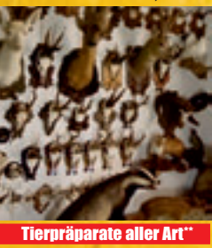
Tierpräparate aller Art**