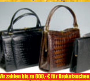
Wir zahlen bis zu 800,- € für Krokotaschen