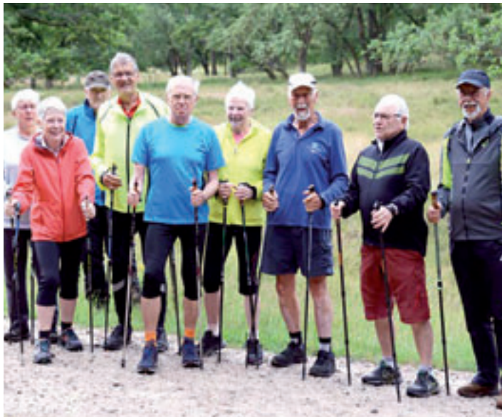
Eine fitte Gemeinschaft – Walkingsparte des TV Fischbek