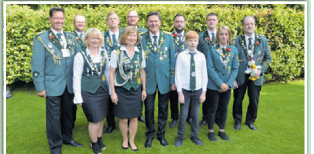
Die Würdenträger repräsentierten den Schützenverein Vahrendorf bei vielen Anlässen