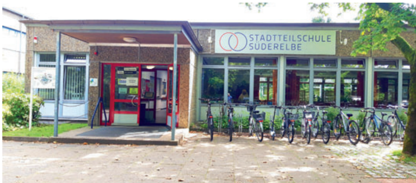
Die Stadtteilschule Süderelbe feiert ihr 50-jähriges Jubiläum

Neben allen schulbeteiligten Personen sind auch ehemalige Schüler, Kollegen, Nachbarn, Partner sowie alle Interessierten eingeladen, an diesem Tag zu feiern und auf 50 Jahre Schule im Stadtteil zurückzublicken.