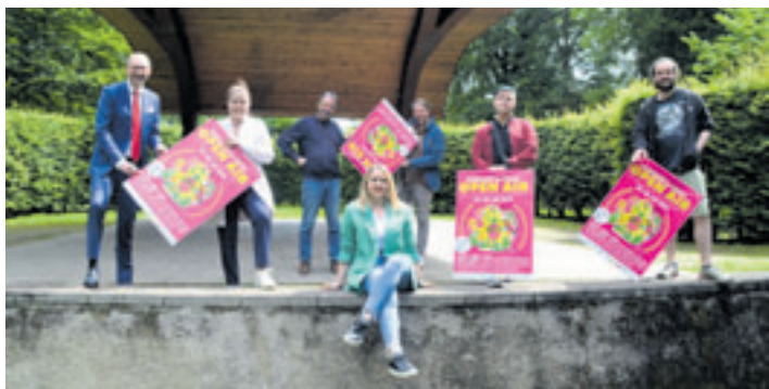
Das Organisationsteam des Open-Air-Festivals „Sommer im Park“ hat ein buntes Programm vom 23. bis zum 28. Juli auf die Beine gestellt

staltung. Kostete der Eintritt 2023 noch fünf Euro regulär und 2,50 Euro ermäßigt, gilt in diesem Jahr „Pay what you want“. Das bedeutet, die Besucher können selber entscheiden, welchen Eintritt sie zahlen können und wollen, und wie viel ihnen die Kultur wert ist. Trotz des Modells gibt es aber auch die Möglichkeit, vorab Tickets in drei Preisklassen zu erwerben. Fünf Euro kostet das „Am-Ende-des-Geldes-ist-noch-so-viel-Monat-übrig“-Ticket, Zehn Euro das „Standard-Ticket“ und 20 Euro das „Supporter-Ticket“. Ausgenommen aus diesem Preismodell sind die Auftritte von Stefan Gwildis und Lotto King Karl. Für diese beiden Konzerte erfolgt ein separater Ticketverkauf. Die Tickets sind online und in der Harburg Info, Hölerwiete 6, erhältlich.