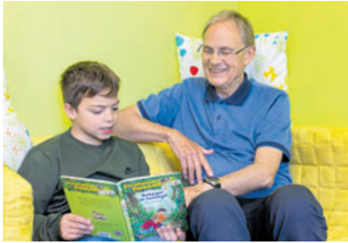
Wer hat Zeit, Lust und Geduld, Kindern beim Lesenlernen zu helfen?

■ (sl) Phoenix-Viertel. Glückliche Kinder, die Eltern haben, die ihnen abends etwas vorlesen und sie mit Geduld durch die ersten Schritte des Selberlesens führen. Doch viele Kinder haben aus unterschiedlichen Gründen nicht so viel Glück, und diese Kinder werden in der Schule sehr schnell abgehängt. Um hier schon gleich in den Anfängen gegenzusteuern, vermittelt der Verein „Mentor – die Leselernhelfer e.V.“ ehrenamtliche Lesepaten. Diese Erwachsenen treffen sich einmal in der Woche für etwa eine Stunde mit einem Kind in der Schule. Durch Vorlesen und Gespräche werden die Schüler in spielerischer Weise an Texte herangeführt und zum Zu-