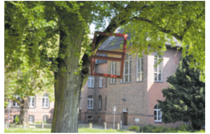
Die zuständige Behörde für Kunst und Medien lehnt den Kauf dieses hängenden Kunstwerkes in der Nähe des Harburger Rathauses ab

getrestriktionen finanziell nicht am Erwerb des Kunstwerks beteiligen.“ Die BKM schätze jedoch die kulturelle Bedeutung des Kunstwerks sehr und würden sich freuen, wenn alternative Finanzierungsmöglichkeiten gefunden werden könnten. Es wäre denkbar, durch private Sponsoren oder durch spezielle Förderprogramme zusätzliche Mittel zu akquirieren. Die Erweiterung des Kunstpfades durch das zusätzliche Werk würde zur Bereicherung der künstlerischen Gestaltung im innerstädtischen Bereich beitragen und die kulturelle Attraktivität des Bezirks steigern, erklärt die BKM.