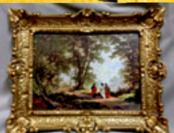
Gemälde aller Art**