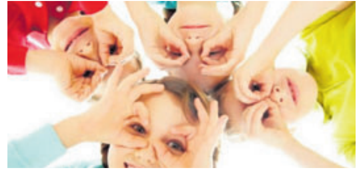
Wer in den Sommerferien noch keine Pläne hat, findet viele Veranstaltungen im Hamburger Ferienpass

■ (sl) Hamburg-Süd. Am kommenden Donnerstag, 18. Juli, beginnt für alle Hamburger Schüler die heiß ersehnte Ferienzeit. Sechs lange Wochen ohne Hausaufgaben oder nervige Prüfungen. Für alle, die noch keine Pläne haben, was sie in der freien Zeit machen können, hat die Stadt Hamburg wieder einen Ferienpass zusammengestellt. Wenn die Schüler das kleine Heftchen nicht schon vor der Ferien in ihrer Schule bekommen haben, können sie es sich in den Bücherhallen oder bei Budni abholen. Die Ferienpass-Karte muss ausgefüllt und zu allen Ferienpass-Veranstaltungen mitgenommen werden – sonst gibt es keine Ermäßigungen. Auf der Ferienpass-Homepage kann man verschiedene Kategorien wie beispielsweise „Abenteuer & Entdeckungen“, „Natur & Umwelt“, „Sport & Spiel“ oder „Allerlei & Außerdem“ anklicken. Mit Hilfe einer Filterfunktion zeigt das System dann die Angebote in dem entsprechenden Bezirk an. Dabei gibt es auch kostenlose Angebote wie Roboter programmieren an der