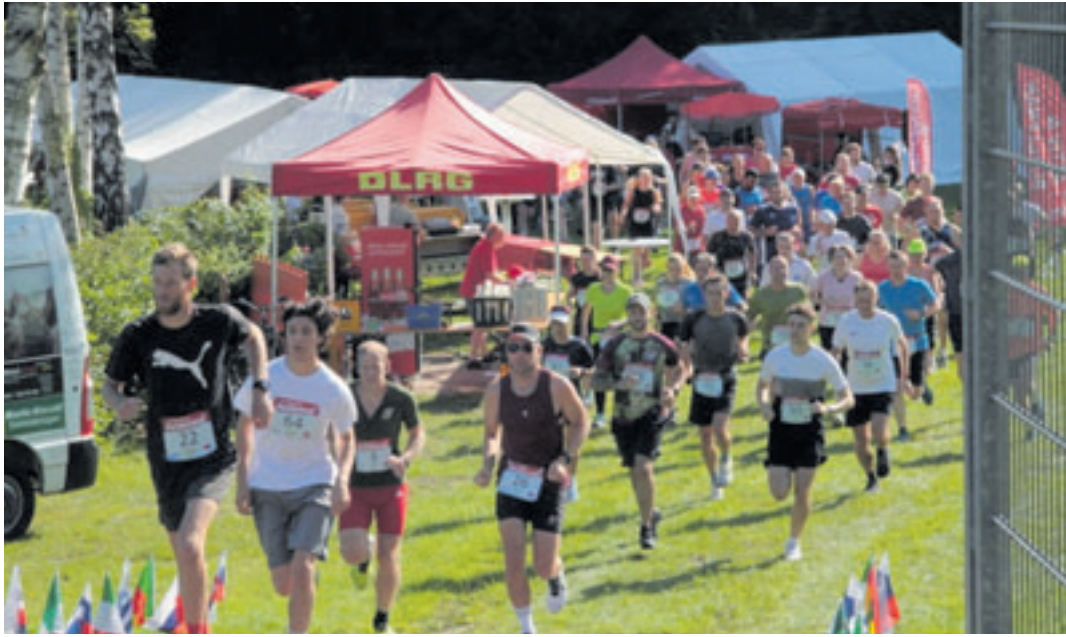
Am 18. August soll der 21. Heidelauf über die Bühne gehen

■ (mk) Neu Wulmstorf. Der 21. Neu Wulmstorfer Heidelauf am 18. August wirft seine Schatten voraus. Start für die 10,5 km lange Strecke durch die wunderschöne Fischbeker Heide ist um 10 Uhr. Walken, Laufen oder Wandern. Alle bewegen sich, wie sie sich wohlfühlen und angemeldet haben. Start und Ziel ist im Freibad Neu Wulmstorf. Am Vorabend gelegte Pfeile aus Sägespänen geben Orientierung und schonen den Naturraum. Die Kinderläufe der Kleinsten bis einschließlich 13. Lebensjahr beginnen ab 14 Uhr: Bis 4 Jahre werden 150 Meter gelaufen, 5-6 Jahre 400 Meter, 7-8 Jahre 800 Meter, 9-10 Jahre 1200 Meter und 11-13 Jahre 1600 Meter. Änderung vorbehalten, je nach Anzahl der Anmeldungen.