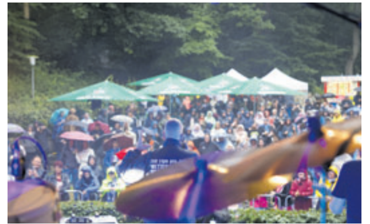
Lotto King Karl freut sich schon auf seinen Auftritt im Harburger Stadtpark

„Soul im Park“ und am Freitag mit „Rock im Park“. Am Samstag heißt das Motto „Tanzen im Park“, und den Abschluss bildet am Sonntag das Thema „Blues im Park“. Darüber hinaus gibt es zahlreiche Ferien-Programmeangebote, und natürlich sind auch die beliebten Theater-Spaziergänge wieder mit dabei. Der Stadtmaler Ralf Schwinge will wieder ein großes Bild zusammen mit den Besuchern malen. Workshops und ein Einblick in die Welt der Robotertechnik runden das Programm ab. Das Organisationsteam verspricht ein kunterbuntes Programm, das „das