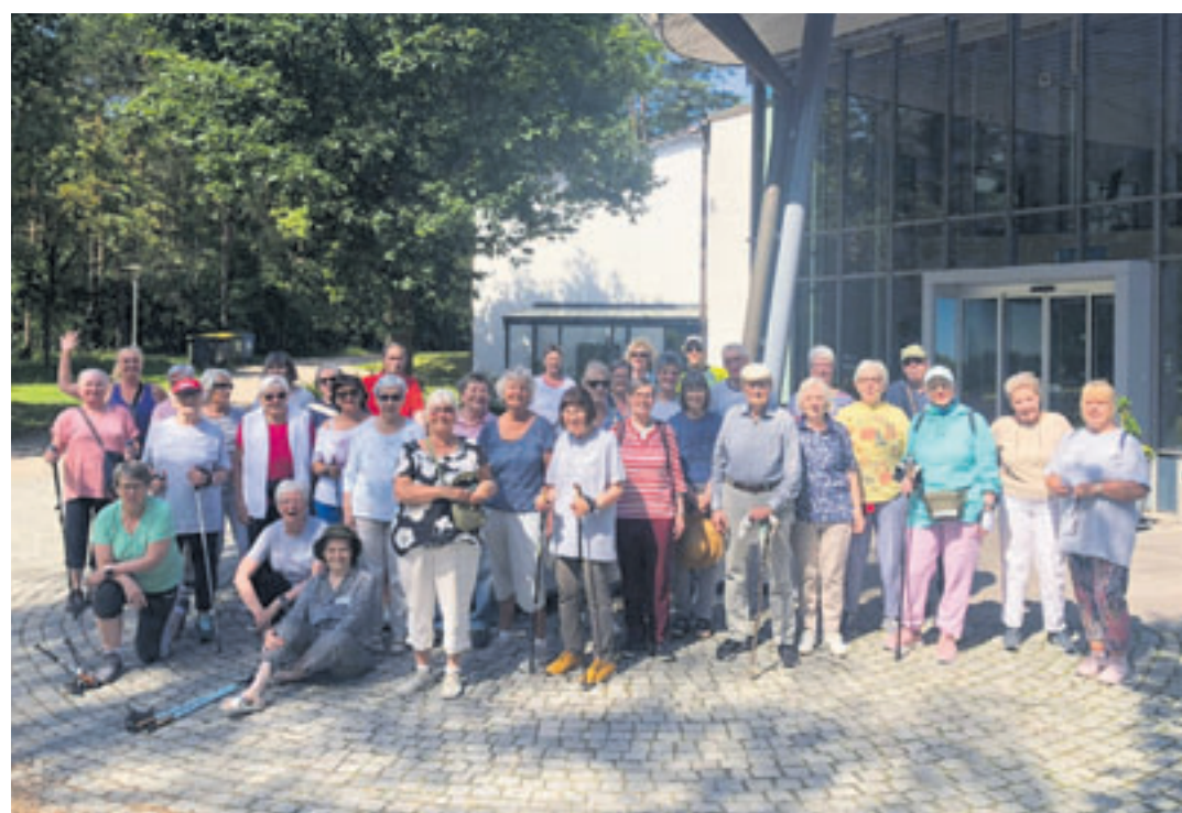
Die Teilnehmer des „Bewegten Wochenendes“ zeigten sich von der Vielfalt des Angebotes angetan

lichen Zeiten/Strecken eingeteilt. Nach dem Abendessen ging es ab 18 Uhr auf die Couch: Die EM-Achtelfinals Deutsche gegen Dänemark und Schweiz gegen Italien versprachen jede Menge an Spannung. Die Teilnehmer verfolgten die Partien mit großem Interesse. Und schon war der letzte Tag des „Bewegten Wochenendes“ angebrochen. Morgens stand nochmals Wassergymnastik für Anfänger und Fortgeschrittene auf dem Programm. Gegen 13 Uhr ging es mit der Bahn wieder nach Hamburg zurück. Alle waren sich einig, dass dieses Wochenende wirklich bewegend war und bedankten sich abschließend bei der Kursleiterin Angelika Czaplinski vom TV Fischbek.