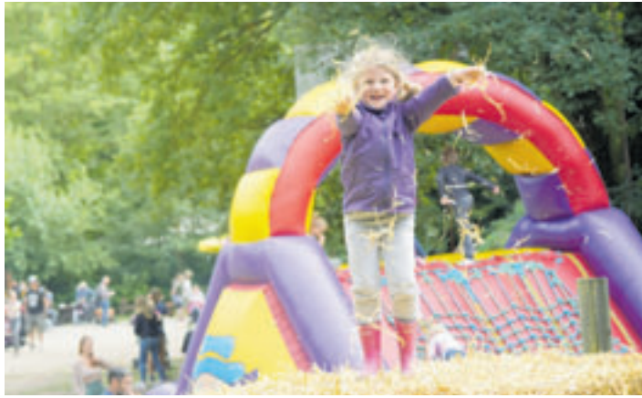
Kinder können sich auf tierisch spannende Ferienprogramme wie den „Kleinen Tierpfleger“ und den „Kleinen Falkner“ freuen

pakas und Eseln können Besucher den Tieren ganz nah kommen und sie sogar streicheln. Apropos streicheln: Wer einmal Frettchen streicheln möchte, sollte unbedingt am Fühlstand des Natur-Erlebnis-Zentrums im Wildpark Schwarze Berge e.V. vorbeischaun. Abenteuerlustige können beim Seilklettern hoch hinaus oder sich auf der Hüpfburg und der Strohhallenburg unter dem Elbblickturm austoben. Wer das bunte Treiben lieber entspannt genießen möchte, dreht stündlich eine gemütliche Runde mit der Wildpark-Bahn. Für kreative Köpfe gibt es Bastelstände in der Kunsthandwerkerhalle, an denen Anden-