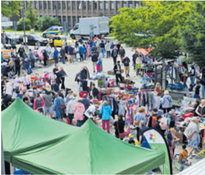
Bereits am frühen Morgen nutzten zahlreiche Besucher die Gelegenheit, sich die besten Schnäppchen zu sichern