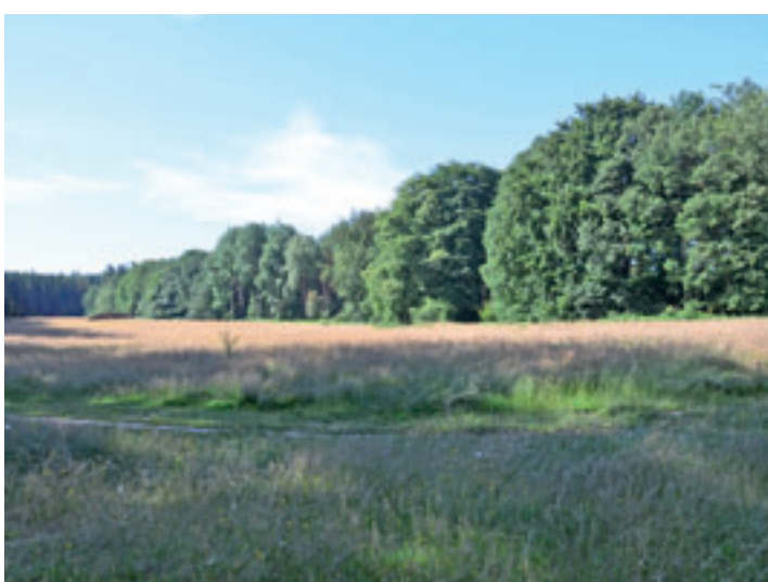
Laut Bezirksamt Harburg stellt die Hundewiese im Waldfrieden vor dem Hintergrund des dramatisch zurückgehenden Bestandes an Insekten ein wichtiges Biotop dar, weshalb auf eine Mahd der Fläche verzichtet wird