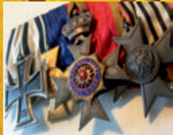
Militariat und Orden

Bisam • Persianer • Fuchspelze aller Art • Zobel • Nerze • Nutria • Chincilla