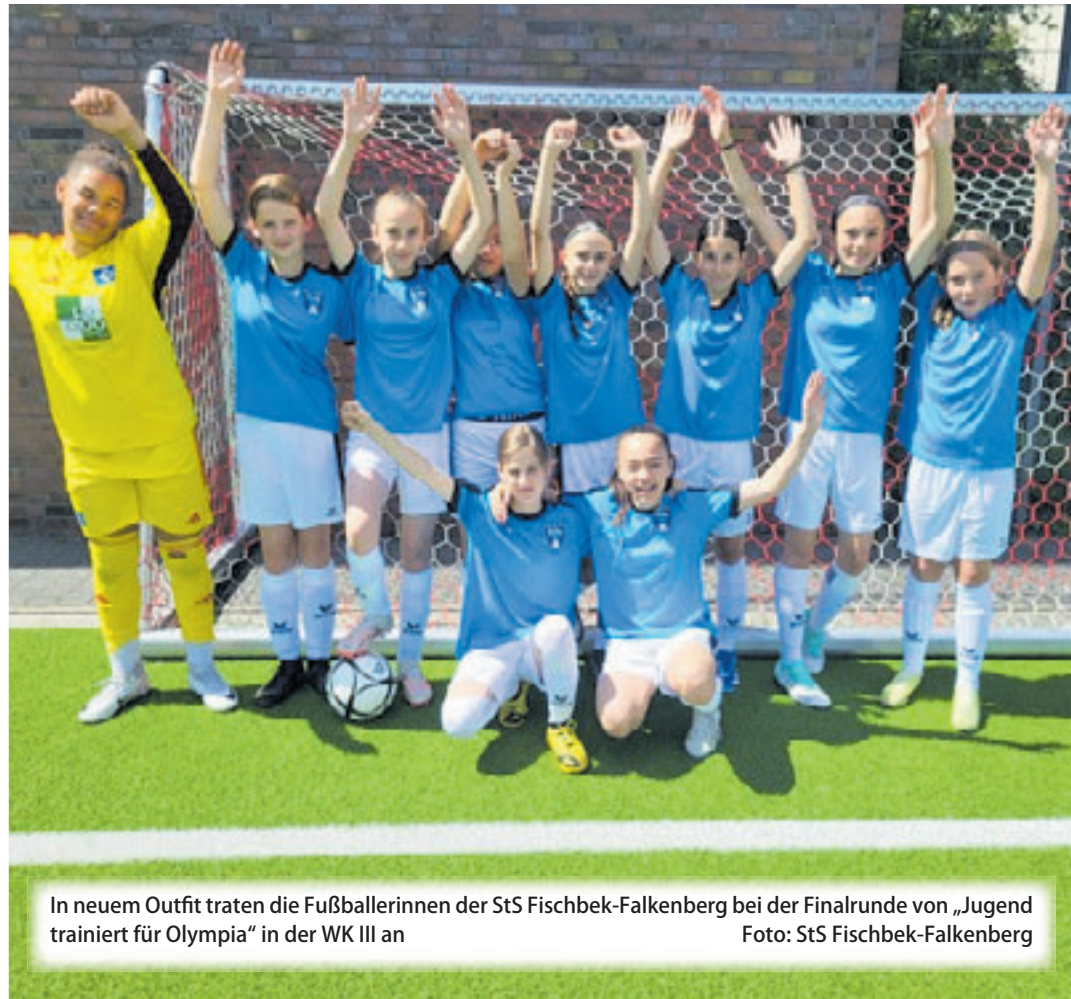
In neuem Outfit traten die Fußballerinnen der StS Fischbek-Falkenberg bei der Finalrunde von „Jugend trainiert für Olympia“ in der WK III an