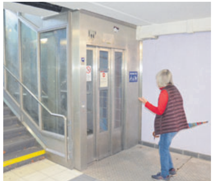
Immer noch defekt: Wann der Aufzug des S-Bahnhofs Neugraben wieder funktioniert, konnte der zuständige LSBG nicht sagen