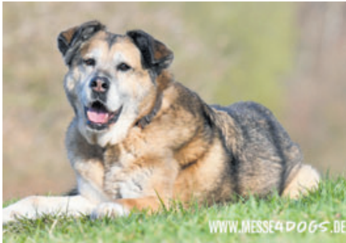
Alles rund um den Hund gibt es bei der Messe4dog

Alles für den besten Freund des Menschen Messe4dogs auf dem Parkdeck des Marktkauf Centers Bergedorf