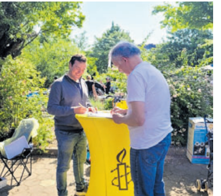
Bereits im vergangenen Jahr informierten die Harburger Mitglieder von Amnesty International auf dem Flohzinn in Wilhelmsburg