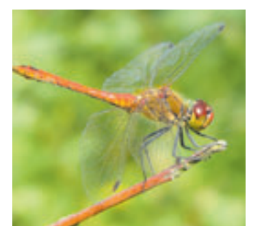
Die Loki Schmidt Stiftung zu einem Spaziergang rund um das Thema Libellen ein

gen für Erwachsene 5 Euro, für Kinder 3 Euro, für Familien 10 Euro. Eine Teilnahme ist nur nach vorheriger Anmeldung möglich. Anmeldung bitte bis zum 4. Juli per E-Mail unter fischbek@loki-schmidtstiftung.de .