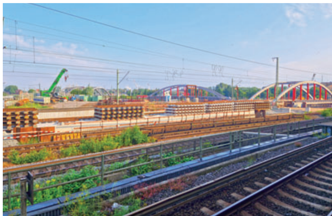
Durch kurzfristige, bauliche Maßnahmen unter anderem an den Eisenbahnbrücken Zollkanal und Harburger Chaussee auf der Veddel kommt es für vier Wochen zu Zugausfällen

■ (au) Wilhelmsburg/Harburg. Wieder einmal wird deutlich, wie der Hamburger Süden durch nur wenige Faktoren verkehrlich abgehängt werden kann. Wie die Deutsche Bahn (DB) vergangene Woche mitteilte, sind kurzfristige Arbeiten an den Eisenbahnbrücken Zollkanal und Harburger Chaussee erforderlich, um die Strecke in den beziehungsweise aus dem Süden Hamburgs in stand zu halten. Zudem müssen zwei Weichen bei den Veddeler Brücken erneuert und Schienen an der Abzweigung zu den Norderelbbrücken gewechselt werden. Aufgrund dieser Bauarbeiten kommt es vom 15. Juli bis voraussichtlich 12. August zu Ausfällen und Einschränkungen im Zugverkehr mit Auswirkungen für den Personen- als auch für den Güterverkehr.