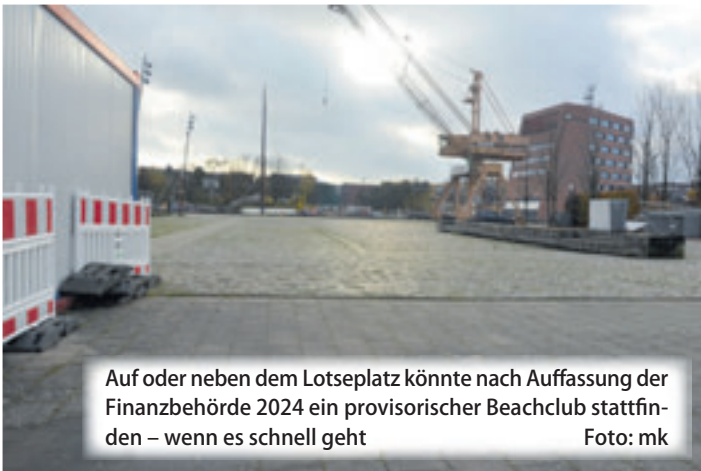
Auf oder neben dem Lotseplatz könnte nach Auffassung der Finanzbehörde 2024 ein provisorischer Beachclub stattfinden – wenn es schnell geht

den Kanalplatz für dieses Jahr vorschlagen. Auf diesen Flächen wäre eine Interimslösung grundsätzlich bereits nach dem Binnenhafenfest möglich. Jedoch bedürfen auch die Errichtung und der Betrieb eines solchen Provisoriums einer entsprechenden Genehmigung. Um die Nutzung einer Interimslösung noch in diesem Jahr zu ermöglichen, würde die Bezirksverwaltung einen entsprechenden Antrag schnellstmöglich bearbeiten und entscheiden. Zu beachten bleibe, dass es dafür einer Beantragung bedarf, die durch den künftigen Betreiber erfolgen muss. Hierauf hat die Bezirksverwaltung keinen Einfluss, machte die Finanzbehörde deutlich.