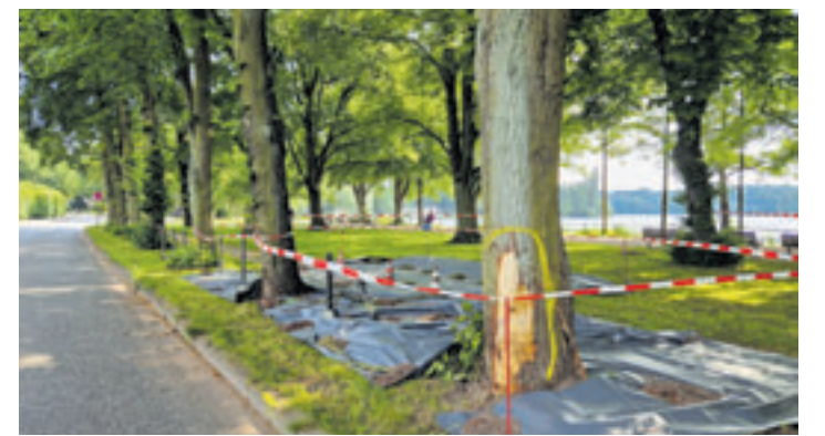
Nur wenige Stunden nach dem schweren Unfall an der Außenmühle ist nur noch ein beschädigter Baum, Abdeckplanen und Flatterband an der Unfallstelle zu sehen

diesem Unfall kommen konnte. Möglicherweise mit zu hoher Geschwindigkeit unterwegs.