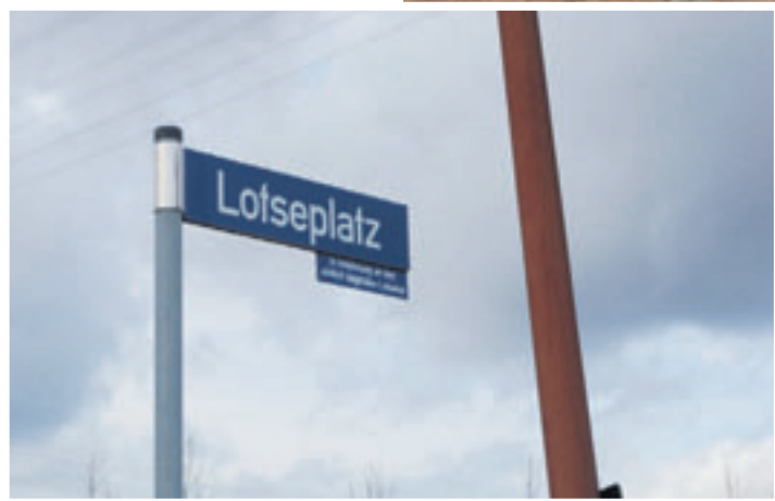
Der Lotseplatz verfügt über eine attraktive Lage am Wasse

arbeitet werden mussten. Im Mai sollte dann feststehen, wer zukünftig am Treidelweg den Beachclub betreiben wird. Nun kommt das große „Aber“: Allerdings müssen für die Errichtung von Baulichkeiten erst Baugenehmigungen beantragt und entsprechende Arbeiten beauftragt und ausgeführt werden, sodass der Beachclub in seiner endgültigen Gestaltung wohl erst 2025 bereit sein wird, ließ das Bezirksamt SPD und Grüne nicht warten. Deshalb ihr Antrag auf eine provisorische Nutzung 2024. Die Finanzbehörde erklärte zu diesem Ansinnen, dass der LIG im Zusammenhang mit der Ausschreibung des Grundstücks am Treidelweg in ständigem Kontakt mit der Bezirksverwaltung stehe. Beide streben eine baldige Vertragsaufsertigung an, sofern der Zuschlag erteilt sei. Unter Beach-