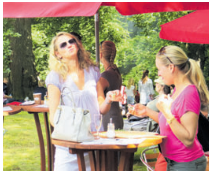
Auch für das kulinarische Wohl der Besucher wird auf dem Sommermarkt gesorgt

Hier findet der Besucher Kunsthandwerk-Produkte aus Holz, Keramik, Papier oder auch Eisen, wie geschmiedete Gartendekorationen oder Rosenbögen. Einen besonderen Stand finden sie von Pflanzenhandel Lietz, der hier eine große Auswahl mediterraner Pflanzen wie Oliven-