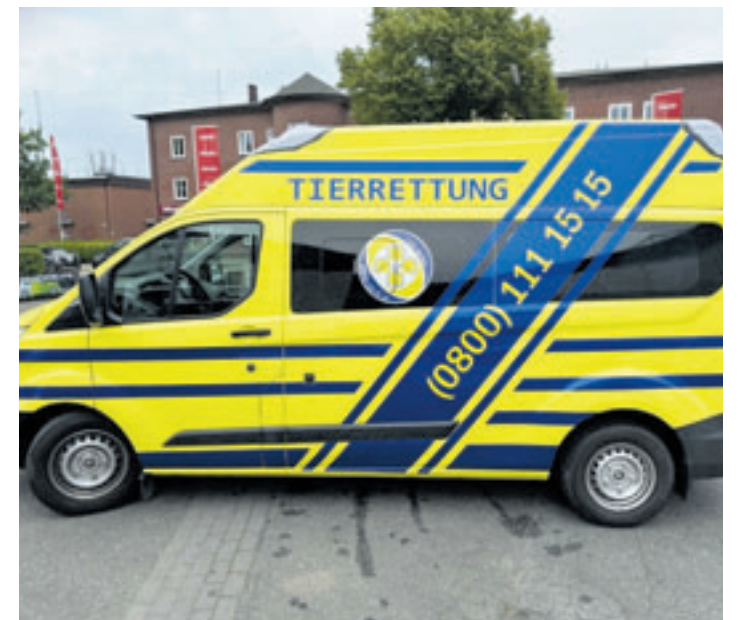
Ab sofort ist in Hamburg ein neuer Tierrettungswagen des TIER-NOTRUF.de im Einsatz.

Angefordert werden kann die Tierrettung rund um die Uhr unter der kostenfreien Rufnummer 0800 111515. Gegründet wurde der TIER-NOTRUF.de im Jahr 2015 und ist mittlerweile in allen fünf norddeutschen Bundesländern und in Nordrhein-Westfalen aktiv. Wer sich als freiwilliger Helfer in der Tierrettung engagieren und ausbilden lassen möchte, kann sich unter www.tier-notruf.de informieren und Kontakt aufnehmen.