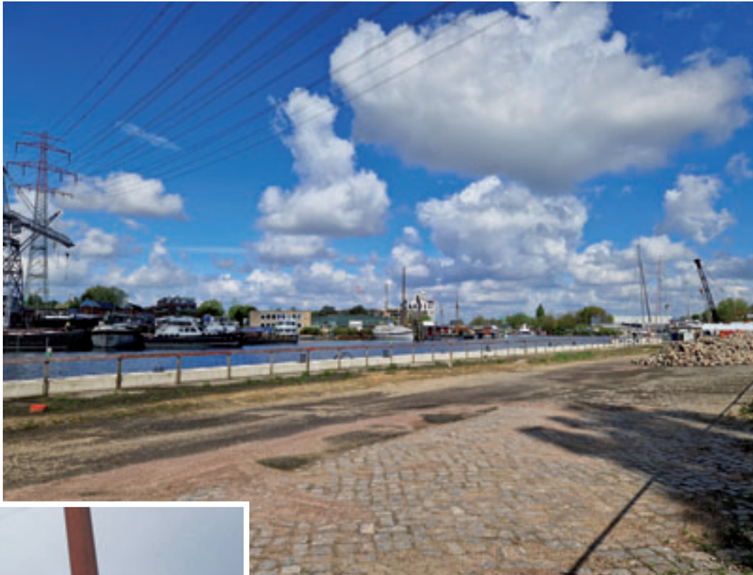
Am Treidelweg soll der zukünftige Beachclub seine endgültige Heimstätte haben

■ (mk) Harburg. Das Dauerthema Beachclub im Harburger Binnenhafen beschäftigt weiter die Gemüter. Zuletzt hatten SPD und Grüne in einem Antrag für den Standort Treidelweg gefordert, dass auf der fertiggestellten Fläche eine provisorische Nutzung hinsichtlich eines Beachclubs bereits 2024 möglich sein müsse. Zwar sei das Interessensbekundungsverfahren für die Fläche am Treidelweg für einen neuen Beachclub und verschiedene Wasserliegeplätze für Gastroschiffe in diesem Bereich nahezu abgeschlossen. Ende April 2024 sollte durch den Landesbetrieb Immobilien und Grundbesitz (LIG) die Entscheidung getroffen werden, welcher der Bewerber, die Konzepte eingereicht haben, den Zuschlag erhalten soll. Nach Ablauf der Bewerbungsfrist hatten Interessenten noch Bearbeitungshinweise erhalten, die abge-