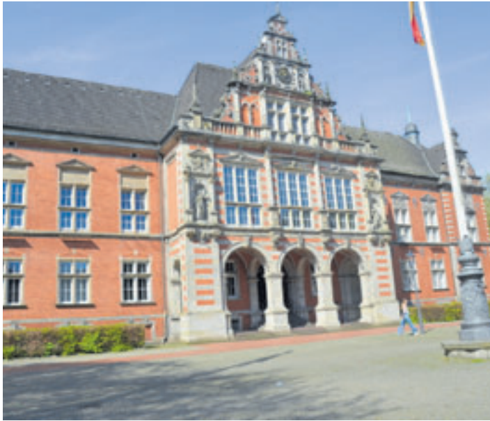
Am 6. Juli präsentieren sich auf dem Rathausplatz rund 40 Initiativen, Vereine und Institutionen mit ihren Angeboten für verschiedenste Altersgruppen.