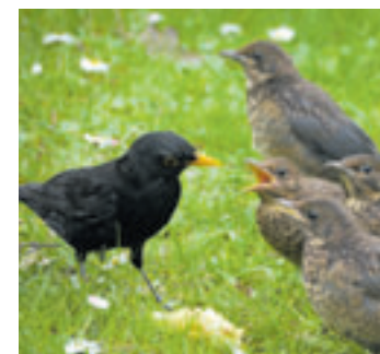
Jetzt sind die jungen Vögel unterwegs – bitte nicht anfassen. Die Eltern sind meistens in der Nähe, rät der NABU

■ (sl) Hamburg. Allen Hobbygärtnern juckt es gerade in den Fingern. Nahezu jede Pflanze im Garten sieht aus, als könnte sie einen kräftigen Formschnitt vertragen. Aber noch sind viele Vögel mit der Brutpflege beschäftigt. Daher bitten die Umweltorganisationen, noch mindestens bis Ende Juli mit dem Rückschnitt von Hecken und Sträuchern zu warten. „Brütende Vögel könnten durch Schnittmaßnahmen so sehr gestört werden, dass sie ihre Brut aufgeben. Auch haben Beutegreifer ein leichteres Spiel, wenn die schützenden Zweige weggeschnitten werden und die Nester so leichter zu entdecken sind. Darüber hinaus gibt