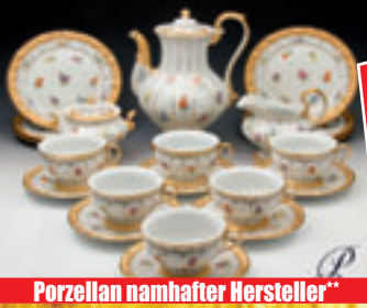
Porzellan namhafter Hersteller**