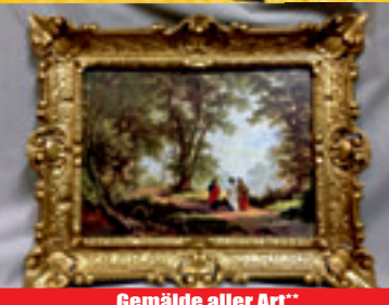
Gemälde aller Art**