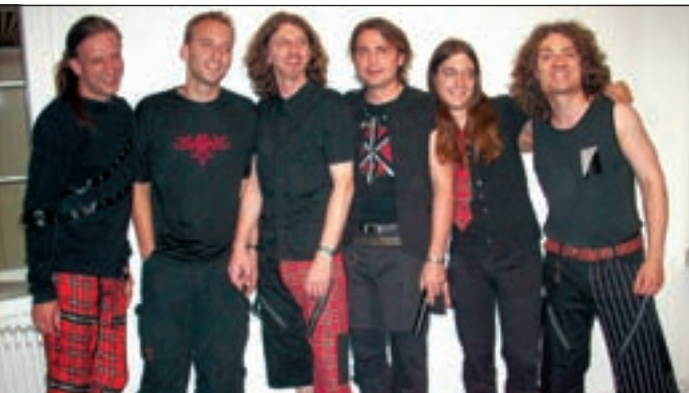
Heizen ordentlich ein, die Brogues.

■ (Is) WILHELMSBURG. Irische Musik aus dem Thüringer Wald. Gibt's nicht? Falsch gedacht. Nicht nur Musiker von der grünen Insel können traditionsreiche irische Musik zum Besten geben. Der Celtic Rock Circus ist wieder unterwegs. Nach der Veröffentlichung ihres fünften Albums, ist nun wieder alles klar für die Live-Bühnen dieser Welt. Im Grunde irisch, aber vor allem rockig-fetzig, erledigen die sechs Musiker aus den „Thüringer Highlands“ in ihrer Show genau das, was sie in ihrer Ankündigung versprechen. „Irish songs and more...“ heißt es da. Und genau dieses „mehr“ charakterisiert