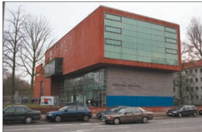
Interessierte können einmal einen Blick hinter die Kulissen wagen.

Auch auf der Elbinsel machen sie Halt: am Freitag, 23. Januar um 21.00 Uhr spielen sie live in der Honigfabrik in der Industriestraße auf. Nichts wie hin und ordentlich im Stile von „Lord of the Dance“ mit feiern und tanzen. Der Eintritt kostet acht Euro.