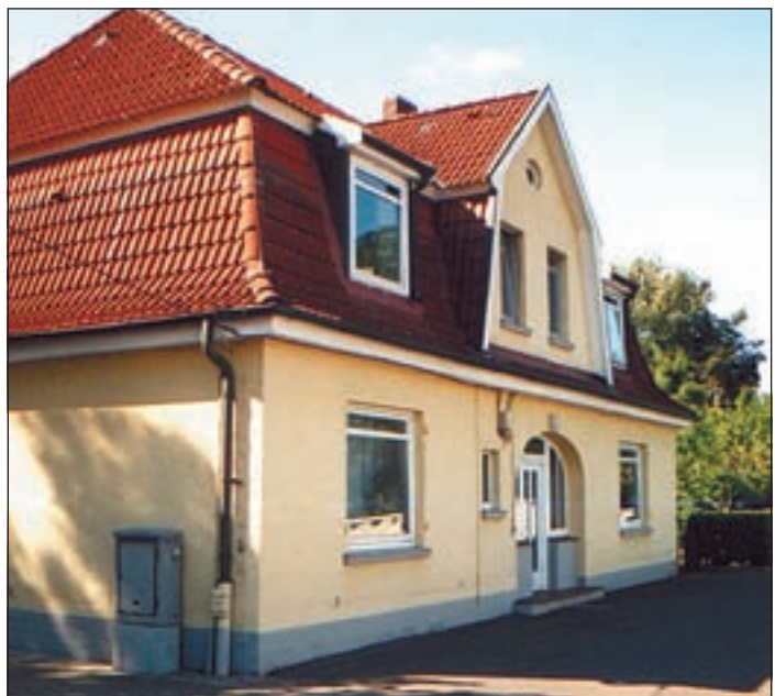
Immer sonntags geöffnet, das Bunthaus.