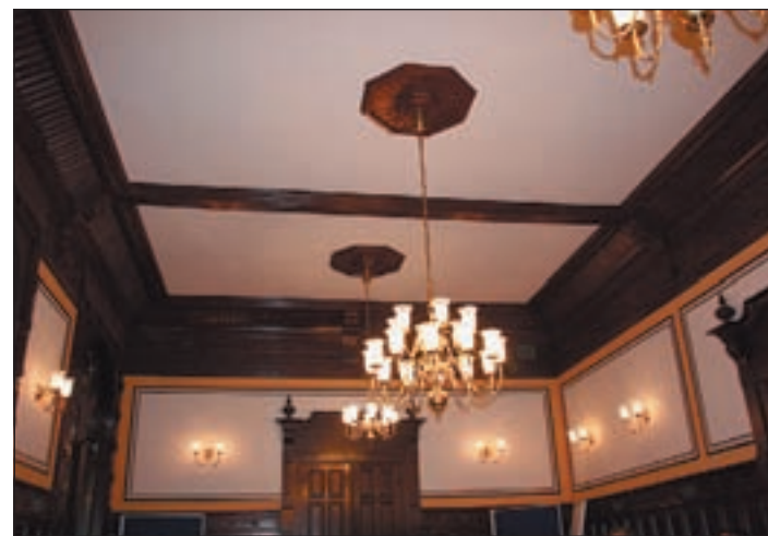
Ort des Geschehens, der Sitzungssaal im Wilhelmsburger Rathaus.

Was war aber nun passiert am Abend des 13. Januars? Es ging um den Antrag 6.9, der erst kurz