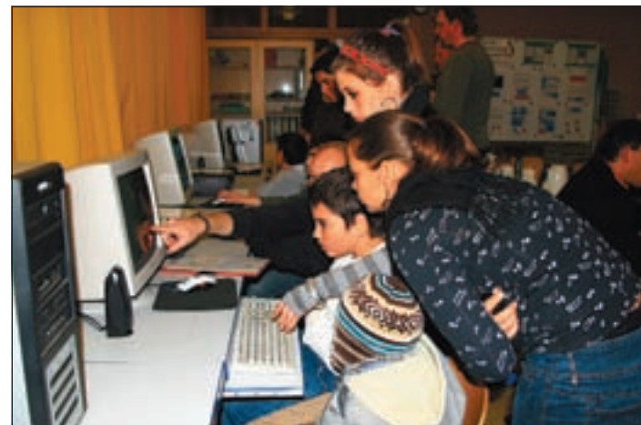
Einweisung der ganzen Familie am eigenen PC.

Computerkenntnisse zählen heute zu den Kernkompetenzen auf dem Arbeitsmarkt. Der selbstständige Umgang mit Office-Programmen, dem Internet und den damit verbundenen Medien, sind als Zugang zu Bildung und Weiterbildung nicht mehr wegzudenken. Bereits in der Grundschule werden die Kinder an Computer herangeführt, und für den nachhal-