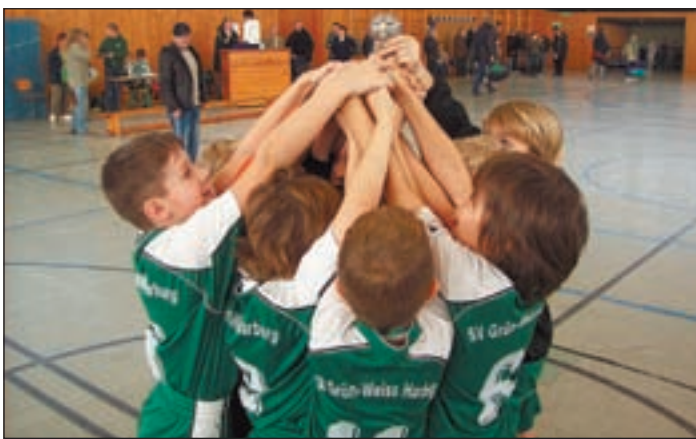
Auch kleine Pokale kann man feiern: Grün-Weiß Harburg III nach der Siegerehrung.

Die dritte Mannschaft von Grün-Weiß Harburg belegte nach einer starken Leistung überraschend den dritten Rang, die zweite landete auf Rang sieben. Beim Siebenmeter-Wettbewerb guckte Daniela von der