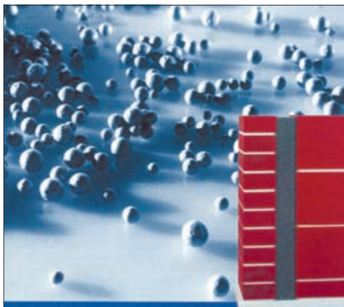
RigiBead ist die perfekte Kerndämmung von zweischaligem Mauerwerk.

■ (pm) SOTTORF. Seit drei Generation hat sich der traditionsreiche Zimmereibetrieb Oelkers dem vielseitigen und anspruchsvollen Handwerk des Holzbaus verschrieben. So erhält man neben zahlreichen Aufträgen für die Errichtung von Carports, stielechten Dachstühlen, Gauben und dem passenden Innenausbau auch viele Anfragen zur Restaurierung von Terrassen, Treppen, sowie Bootsstegen und Gartenwegen.