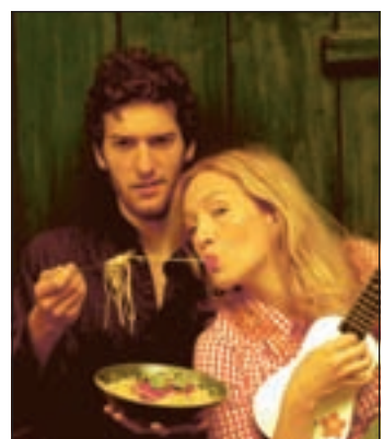
Gunst der Stunde nutzen, das Duo „Das Geld liegt auf der Fensterbank, Marie“.

vom Improtheater Steife Brise. Wer also Interesse hat, einfach mal wieder herzlich zu lachen sollte sich am Freitag, 23. Januar in der Sporthalle Veddel am Zollhafen 5b einfinden. Um 20.00 Uhr geht's los. Weitere Informationen zum Comedy- und Kabarettwettbewerb gibt