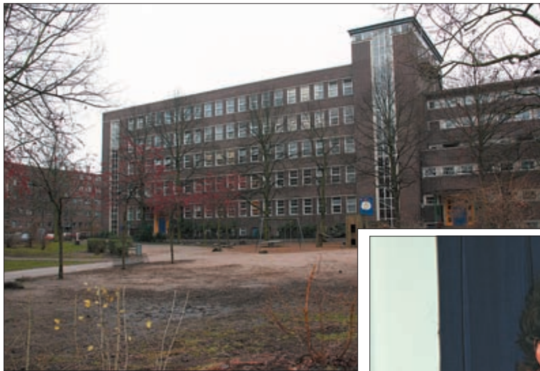
Eine von Vieren auf den Elbinseln, die Schule Slomanstieg