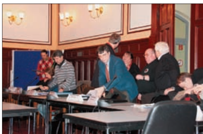
Stabile Mehrheit, SPD und GAL im Ausschuss.

So stellte die CDU fest, dass zur Sitzung nicht ordnungsgemäß geladen wurde und daher die Fraktion nur unter Protest der Tagesordnung zustimme. Die Linke haute in die selbe Kerbe, in dem sie den Vorschlag machte alle Tischvorlagen nicht zu befassen, weil es