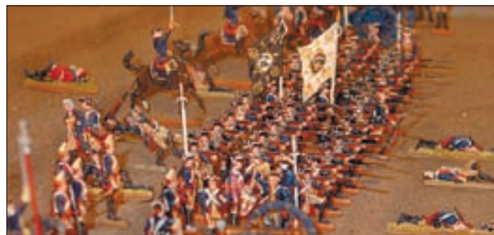
Spielzeug „anno dazumal“.