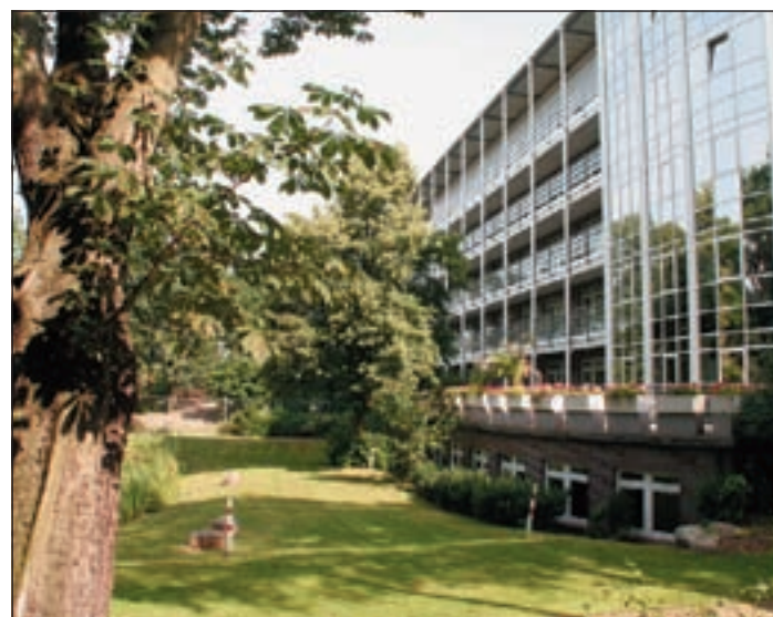
Kompetente Pflege wird im Krankenhaus Groß-Sand garantiert.

■ (Is) WILHELMSBURG. Auch in 2009 geht's weiter mit dem Kinonachmittag für die Kleinen in der Honigfabrik in der Industriestraße. Über den Kinderfilmring Hamburg werden dort verschiedene Filme gezeigt. Am Freitag, 23. Januar um 15.00 Uhr gibt's König der Diebe nach dem gleichnamigen Roman von Cornelia Funke.