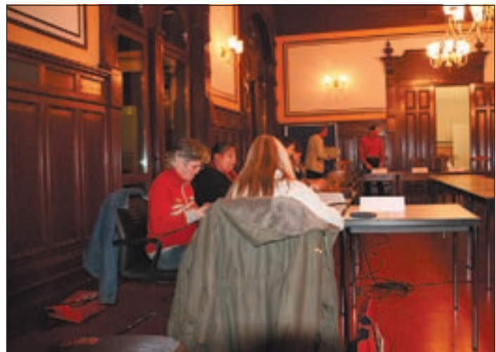
Klare Kante - die Opposition auf der Insel.

doch zu schaffen sein müsse, alle Anträge rechtzeitig zu verschicken, damit jeder Abgeordnete zu Hause die Zeit hat, alle zu lesen. Natürlich wurde dieser Vorschlag mit der rot-grünen Ausschussmehrheit abgelehnt, und es konnte dann doch endlich losgehen. Das war auch gut so, gab es doch