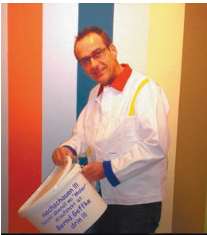
Bernd Geffke Malereibetrieb

Haacke IsolierKlinker Am Ohlhorstberge 3, 29227 Celle Tel.: (05141) 805 121 www.haacke-isolierklinker.de