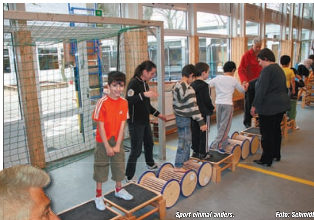
Sport einmal anders.