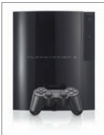
Spielzeug heute.

■ VEDDEL. Die Winterferien sind vorüber, aber Frühling ist deswegen noch lange nicht. Um Familien die graue Jahreszeit zu verkürzen, bietet Hamburgs Auswanderermuseum BallinStadt ab Januar regelmäßig Wochenendaktionen an. In speziellen Einführungen für Kinder und Bastelworkshops an Bord des Auswandererschiffes lernen Groß und Klein alles über das Leben der Auswanderer und nehmen selbstgebautes Spielzeug wie von vor 100 Jahren mit nach Hause. Denn Spielzeug gibt es, seitdem es Kinder gibt. Was heutzutage Spie-