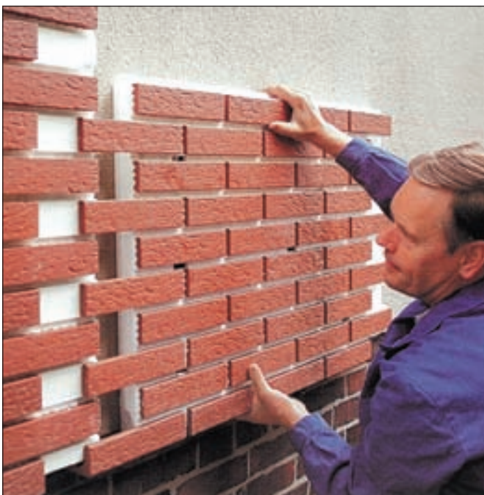
Fachmännisch angebrachte Isolierklinker sorgen für gute Wärmedämmung und helfen Geld zu sparen.

Energieeinsparung durch Fassadensanierung